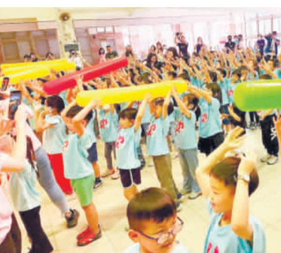
城幼畢業生晚會，園方規劃互動遊戲，小朋友彼此玩得開心。