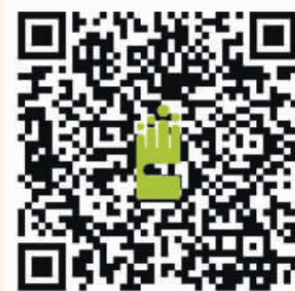
國健署長者防跌專區