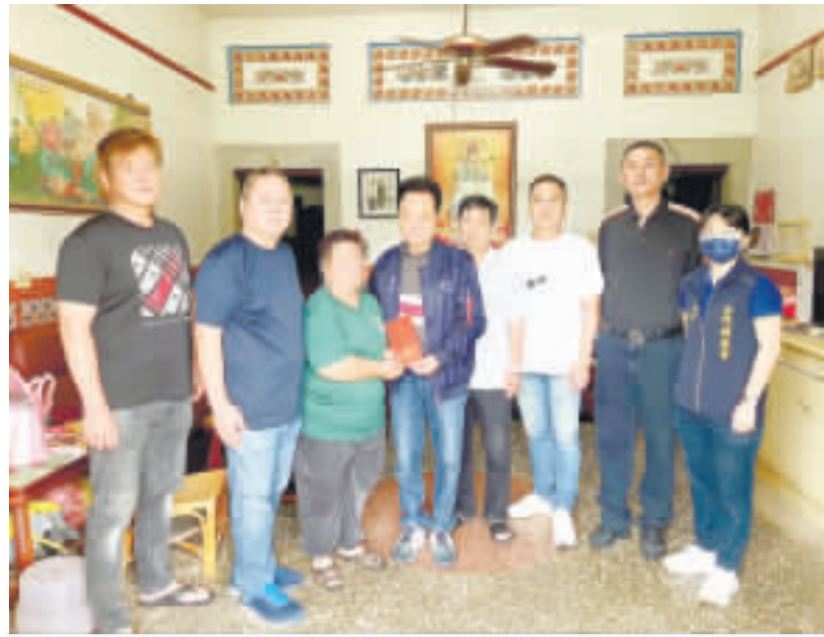
金門縣議長洪允典昨至烈嶼青岐葉家慰問，致贈慰問金表達關懷。

記者楊水詠／綜合報導 烈嶼鄉青岐葉姓男子年紀未滿四十歲正逢青壯，為家中主要經濟來源，日前突因不明原因驟然離世，致使葉母感到錯愕且悲痛欲絕，其生活亦因失去經濟支柱而陷入困境。金門縣議長洪允典聞訊後，於昨日上午偕同議員石永城、張雲量、洪鴻斌，並在議會主管人員陪同下，前往葉家探視葉母表達關懷並致贈慰問金。 金門縣議會表示，葉姓男子與母親兩人相依為命，平日工作以負擔家計，為家中主要經濟來源，葉母則是在烈嶼公墓擔任臨時工，賺取微薄薪資補貼家用，生活未臻寬裕，現 家中兒子突然驟逝，葉母除需面對喪子之痛以外，也需面對日後生活狀況，洪議長得知訊息後，心裡感到非常不捨，也立即前往慰問。 洪議長到葉家後先瞭解葉母的生活現況，葉母表示對於兒子年紀輕輕就突然過世，感到非常錯愕而且無法接受，她表示將配合醫院及相關單位進行相關程序，同時也由衷感謝大家的關心。 洪議長除了安慰葉母之外，也鼓勵她堅強面對日後的生活，洪議長向葉母表示，未來若有需要議會協助之處，請她隨時聯繫村長，他將盡全力協助她渡過難關。