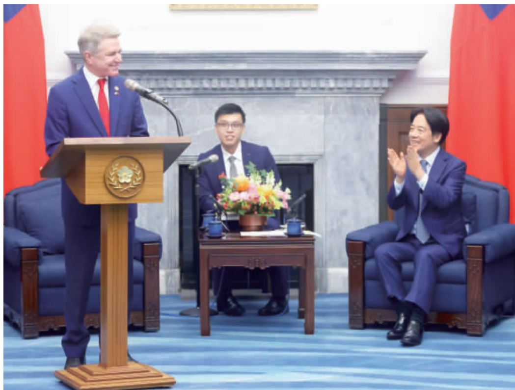
美國聯邦眾議院外交委員會主席麥考爾 (Michael McCaul) (左) 率跨黨派議員慶賀團訪台，27日晉見總統賴清德 (右)，麥考爾秀中文喊「我們愛台灣」，現場響起掌聲。