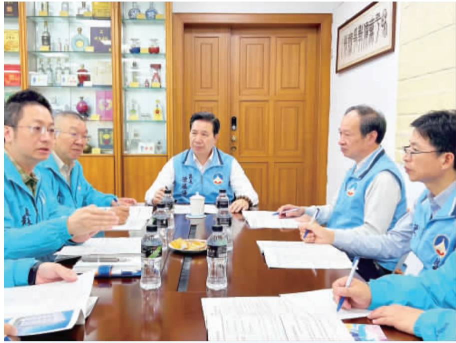
左、縣長陳福海與財政處等相關單位討論關於西南門里公所都更案的最新進度。 右、「金門縣金城鎮西南門里公所暨周邊地區公辦都市更新案」示意圖。

示，本案專家學者及本府委員對建物設計及計畫內容皆有不 同意見及建議，經過多次討論 及實施者積極配合修改，加上 日前全部原有權人皆已完成 房屋選配意願，都更腳步又往 前跨出一大步，相信對下一次 相關計畫審議核定更具信心。 縣長陳福海表示，從政以來 一直非常關注金門土地宜居問 題，除了致力改善老舊危樓，