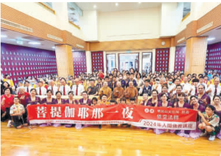
金蓮淨苑人間佛教講座，吸引許多民眾聆聽，現場聽眾合影。