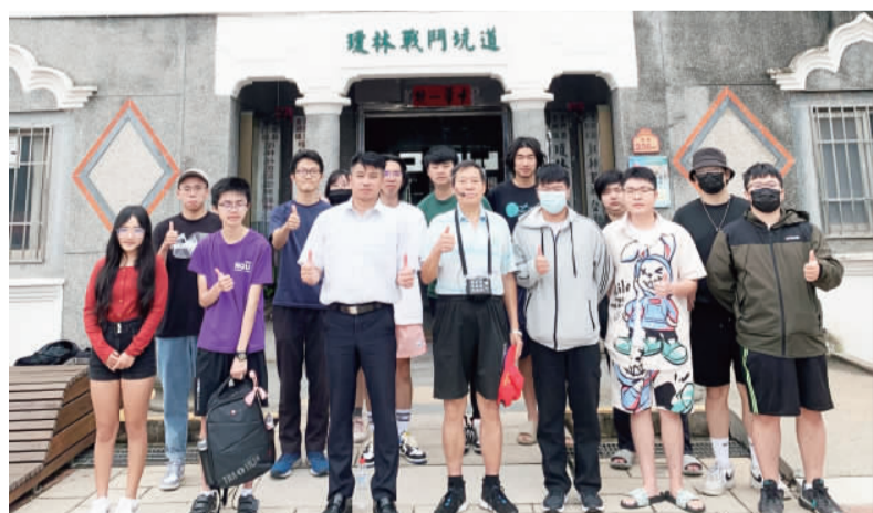
國立金門大學學生走讀金湖鎮瓊林聚落合影。

記者楊水詠／金湖報導 國立金門大學學生在通識課「金門生態學」教授王宏男博士帶領下，一行人於昨日走讀金湖鎮瓊林聚落，同時在文史工作者蔡清其的導覽解說下，讓金大生從自然歷史與人文教育的角度，了解金門豐厚的文化底蘊和在地文化優勢。 此次，金大生走讀瓊林聚落課程內容豐富精彩，文史工作者蔡清其寓意：瓊林民防館的建築細節與其和時代意義；遠近馳名的風獅爺與靈驗小故