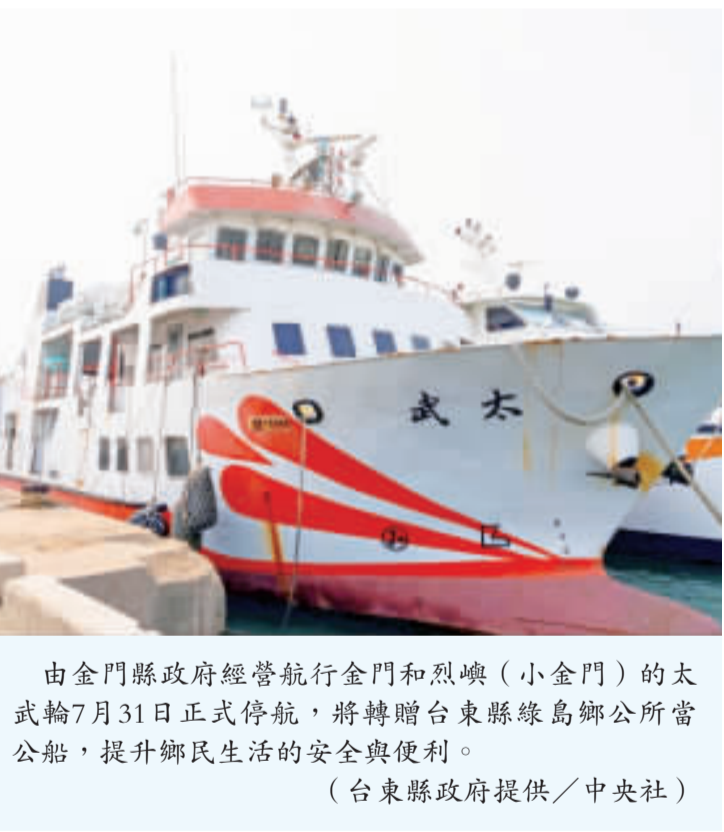
由金門縣政府經營航行金門和烈嶼(小金門)的太武輪7月31日正式停航，將轉贈台東縣綠島鄉公所當公船，提升鄉民生活的安全與便利。

【中央社記者盧太城台北29日電】會肩負金門和烈嶼交通重任，及台灣與中國廈門「小三通」重要橋樑的金門縣政府公船太武輪，即將在金門轉贈台東綠島鄉公所當公船，守護綠島鄉民。