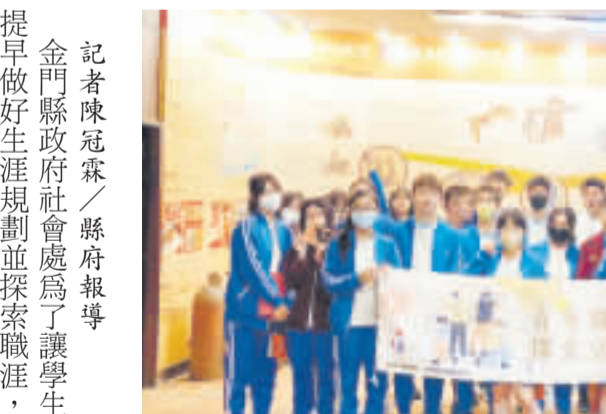
金門縣政府社會處安排「青年職涯探索活動計畫」，參觀金合利觀光工廠。

記者陳冠霖／縣府報導 金門縣政府社會處為了讓學生提早做好生涯規劃並探索職涯，特別辦理「青年職涯探索活動計畫」，透過職場體驗及參訪方式，讓學生了解職業道路上的挑戰與機會。 為將來投身社會工作做準備，活動中，專業師傅不僅介紹了金屬工藝的基本知識，還分享了自己在職場上的經驗和心得，讓學生了解職業道路上的挑戰與機會。 現場有獎券答活動加強並宣導青少年勞動權益，教導學生一些基本打工常識及注意事項，以社會處表示，本場活動係藉由職場體驗及參訪方式讓學生探索個人的生涯，以達到預做規劃之效果，會選擇以觀光工廠為體驗及參訪地點，除了想讓學生了解金屬工藝的多元面與思維，也希望藉由敲敲打打金屬工藝，親身體驗基礎金工技術，從中感受金屬工藝之美，並豐富手作經驗，培養多元興趣。