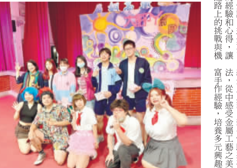
烈嶼國中舉辦形式職涯講座，特別採用戲劇化手法，有效激發學生對於職業規劃的興趣。