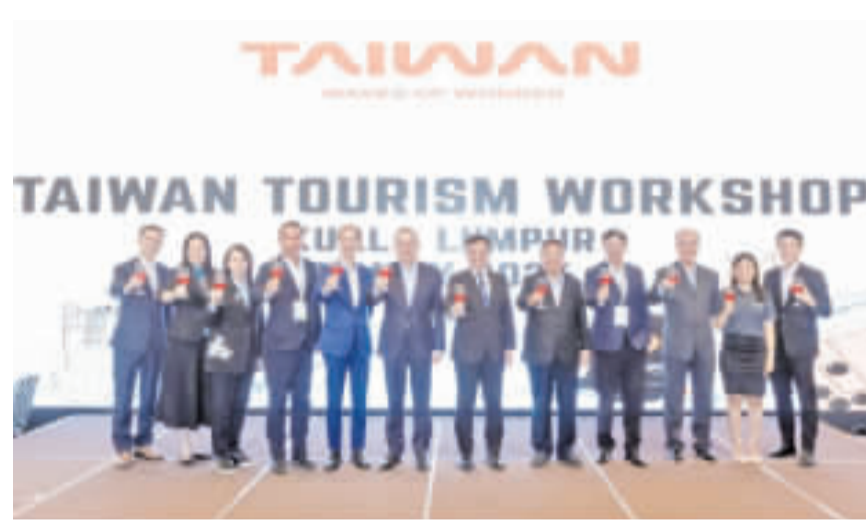
卜公使與主辦單位等團隊合影。