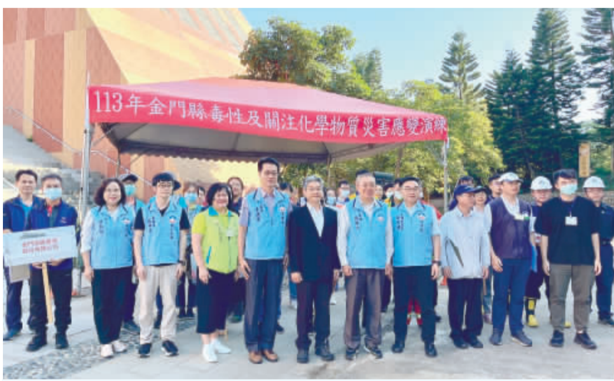
左、毒性及關注化學物質災害應變演練來賓及參演人員合影；右上、右下：演練共動員7個單位參演，演練情境逼真，過程確實，順利圓滿完成。

記者高凡洋／綜合報導 金門縣政府於昨(29)日下午假國立金門大學舉辦「113年金門縣毒性及關注化學物質災害應變演練」，共動員包括國立金門大學、縣府環保局、消防局、自來水廠、衛生局、金門酒廠實業股份有限公司、環境部化學物質管理署中區環境事故專業技術小組等7個單位參演。演練情境逼真，過程確實，順利圓滿完成。 113年金門縣毒性及關注化學物質災害應變演練，由縣府參議張瑞心主持，計有主辦單位環保局、