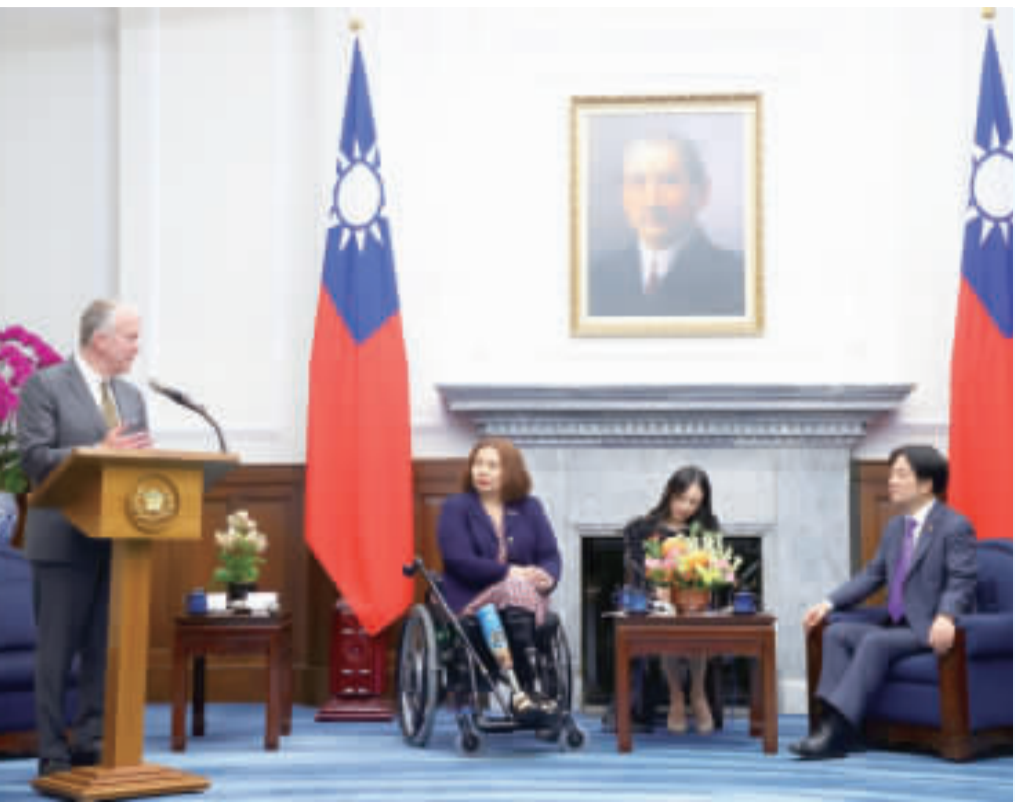
總統賴清德(右)29日在總統府接見美國參議院跨黨派代表團，參議員蘇利文(Dan Sullivan)左一、政詞強、此行展現台美關係堅若磐石、有原則而且是跨黨派的，這樣對台灣支持在美國已經超過75年，他要向賴總統及台灣人民保證，不管未來的75年還是之後，可以確保美國對台灣的支持是不會改變的。左2為參議員達克沃斯(Tammy Duckworth)。