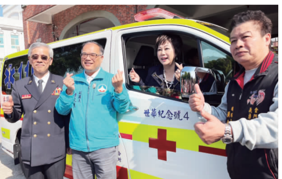
右、在眾多來賓的見證下，這輛高規格救護車正式上路肩負起守護金門鄉親生命安全的重要任務。

記者高凡淳／綜合報導 世界華人工商婦女企管協會昨(19)日捐贈一輛價值新台幣四百多萬元、具備先進配備的高規格救護車，配發金湖消防分隊並正式上路，肩負起守護金門鄉親生命安全的重要任務。 副縣長李文良代表陳福海縣長出席啓用典禮，感謝世華不遠千里把珍貴資源及滿滿愛心送到離島，李文良表示，這輛救護車的背後，來自於全球世華姊妹們一點一滴累積而成的愛心，是對第一線消防與救護同仁最大的支持與打氣，這份關懷跨越海洋來到金門，