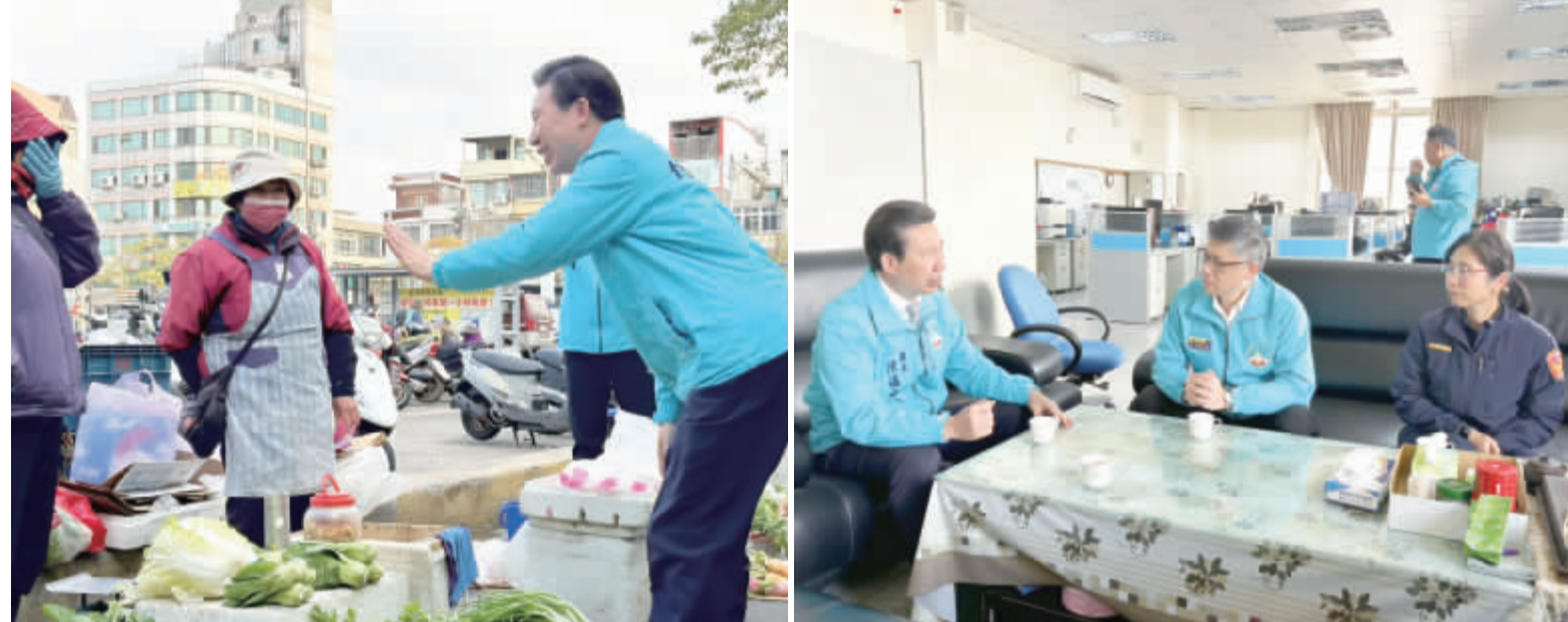
左、縣長陳福海前往金湖市場關心民情；右、在金湖分局，縣長也與警方就執法實務進行交流。

記者陳冠霖／綜合報導 爲貼近民意、掌握基層實況，金門縣長陳福海19日走訪金湖地區，首站前往金湖市場，實地了解市場供需情形與春節前物價波動狀況。陳縣長沿著市場動線逐一巡視，關心民生物資供應是否充足、價格是否平穩，並主動向攤商與採買民眾寒暄問候，傾聽第一線的生活聲音，展現縣府重視民生、關懷鄉親的施政態度。 走訪過程中，陳縣長與多位攤販和採買鄉親交談，了解不同品項的進貨成本、銷售情形與消費者反應，並關注節前市場人潮與交易狀況。他指出，市場是最貼近民眾生活的場域，物價穩定攸關家戶生計，縣府將持續掌握供需變化，透過跨局處協調與資訊掌握，確保重要民生物資供應無虞，讓鄉親在重要節慶前能安心採買、穩定過年。 縣長陳福海指出，市場不只是買賣交易的空間，更是鄉親日常生活與情感交流的重要場域，攤販的經營狀況，往往最能反映地方經濟的真實樣貌。縣府在推動各項政策時，必須先理解基層實際處境，才能做出貼近需求的調整。他強調，穩定物價、照顧小商家生計，是縣府責無旁貸的工作，未來也會持續透過實地走訪與定期溝通，讓政策回應生活、讓行政真正服務人民。 在與攤商交流時，部分業者也反映警方執法人員取證過於嚴格，實務上缺乏彈性，對生計造成壓力。陳縣長當場耐心傾聽，詳細詢問具體情形與發生時段，並表示理解攤商長期在市場經營的辛勞，縣府對於基層民情的回饋高度重視，相關意見將納入後續檢討與溝通。 陳縣長認爲，依法行政固然重要，但親與第一線人員，共同打造秩序良好、關係和諧、生活安心的幸福金門。 在會談中，陳縣長也轉達市場攤商的實際反映，與警方就執法實務進行交流。他期盼基層員警在合法範圍內，能保有溫度彈性與人性化思維，兼顧「情、理、法」三者的平衡，讓執法不僅是規範的落實，更是公共服務的一環。他表示，基層員警在第一線執勤相當辛勞，攤商爲生計努力經營同樣不易，縣府希望在不違法、不失職的前提下，讓制度多一分彈性、執法多一分溫度，讓民眾感受到政府不是高高在上，而是站在身邊，一起解決問題的夥伴。 陳縣長表示，市場秩序、民生需求與公共安全，皆需在制度與人性之間取得平衡，這也是地方治理中最重要、也最具挑戰性的課題。透過親自走入現場、傾聽不同角度的聲音，不僅有助於即時釐清問題，更能促進彼此理解，降低對立與誤解，讓政策執行更順暢。 縣長陳福海強調，未來將持續以「以民爲本」爲核心價值，強化跨單位溝通機制，讓執法更有溫度、服務更貼近人心，並在守法前提下兼顧情理，攜手鄉親與第一線人員，共同打造秩序良好、關係和諧、生活安心的幸福金門。