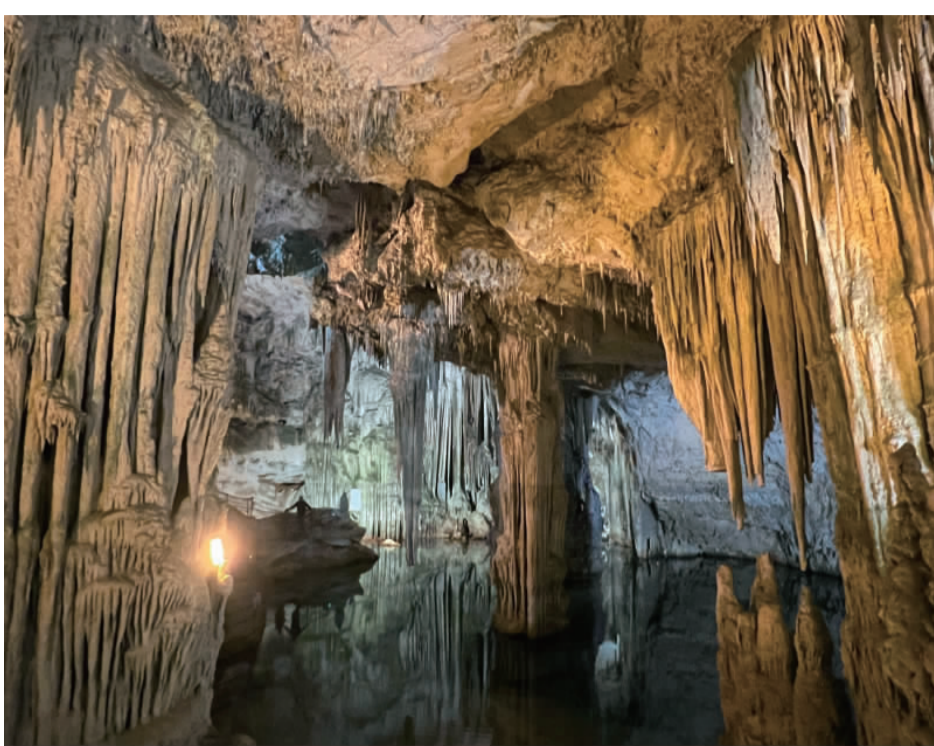
義大利薩丁尼亞島奇景「海神洞穴」，內部奇幻的鐘乳石景觀，每年吸引全球大批遊客前來。（中央社）

「別有洞天」難以形容內部複雜的格局與廳室，沿著迂迴通道，參觀者時而登高，時而穿過極狹窄空間，陸續可通往多個洞室，例如有一座「廢墟廳」，是因為此處鐘乳石在19世紀時遭遊客破壞而得名；「皇家宮殿大廳」則像大自然創造的迎賓室，岩壁的鏤空雕花與對稱效果，宛如建築師精心設計。另有佈滿小型鐘乳石的「蕾絲節帶廳」，以及可從高處俯瞰全景的「音樂廳」。 海神洞穴是因石灰岩溶蝕形成的獨特喀斯特（Karst）地貌，在洞穴內造成鐘乳石、石筍、石柱等景觀。鐘乳石形成需要很長時間，根據官網資料，大約每百年只能增加1立方公分，石筍形成更緩慢，大概每200、300年才能增加1立方公分。