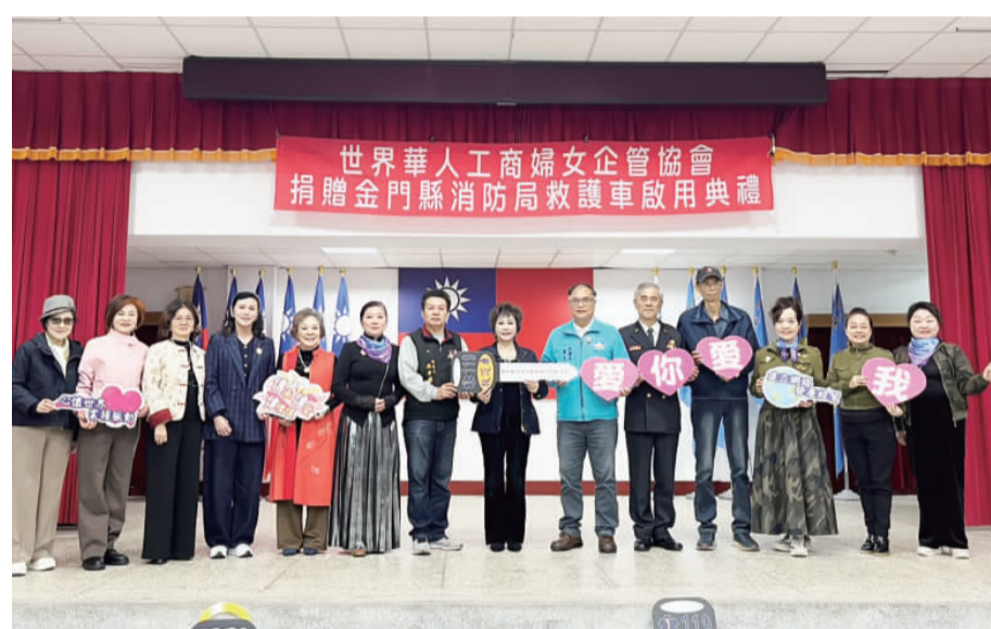
左、世華在「619國際行善日」與「2025愛你愛我—全台救護車、救災車捐贈計畫」號召下，跨海捐贈高規格救護車給金門；右、在眾多來賓的見證下，這輛高規格救護車正式上路肩負起守護金門鄉親生命安全的重要任務。