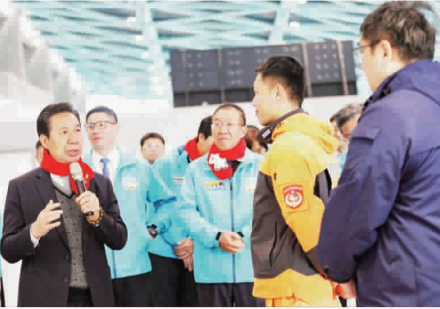
縣長陳福海昨(23)日舉行就職三週年活動，呈現縣府團隊在建設、社會福利與教育政策上的全方位進展。

記者許峻魁／金城報導 縣長陳福海就職滿三週年，金門縣政府特別舉辦「愛陪伴·世代同行」教育未來系列活動，結合扎根政策宣講、現場邀請到金門烏克麗麗、金湖國小附設幼兒園以及金沙國小附設幼兒園團體表演，帶來活潑有趣的表演與溫馨劇場，共同呈現縣府團隊在建設、社會福利與教育政策上的全方位進展，現場洋溢溫馨與希望的氣氛。 昨日的「愛陪伴·世代同行」教育未來系列活動，特別選在即將於二月三日進行的試營運的水頭旅客服務中心新大樓出境大廳辦理，縣府各級主管、主管出席活動，同時邀請金沙附幼、金湖附幼的老師、幼童以及家長共襄盛舉，現場並由文化局、教育處、衛生局、家庭教育中心等單位進駐攤位，宣導縣府扎根零碼的施政，透過互動式闡釋、親子體驗與專業人員解說，向家長說明托育補助、育兒津貼、婦幼照顧及托育資源等政策支持。 縣長陳福海表示，縣政的推動從來不是冰冷的數字與工程，而是每一個家庭、每一位孩子與長者的真實感受。就職三週年的活動以「祖孫代間互動」為核心，象徵縣府施政從零歲到老年，從個人到家庭的完整照顧，實踐「讓金門成為世代共融、安心生活的幸福島嶼」。他強調，投資孩子就是投資金門的未來，縣府會做年輕父母最堅實的後盾。 陳福海感謝金門鄉親三十六年來一路相伴，他從政的三十六年以來，想的不是個人，而是上天給他的任務，希望能讓金門這塊土地有更好的發展。 就職三週年選在水頭旅客服務中心舉行，陳福海指出，這棟大樓耗資巨大就是為了要扮演未來金門重要的關鍵。他強調金門是一座小島，如果沒有來自世界各地的的好朋友到金門，就是一個封閉的小島。他認為，金門有兩個重要交通，對空是尚義機場，另一個則是港口，他感謝歷任縣長為機場打下良好基礎，讓旅運大樓得以興建。未來新大樓一年可達三百五十萬到五百萬的運量，將可以跟對岸有更好的交流。 陳福海回顧從政以來親親對他的期待。他說，他從政的初衷就是《禮運大同篇》，早年戰爭時期地方長輩生活十分辛苦，他把