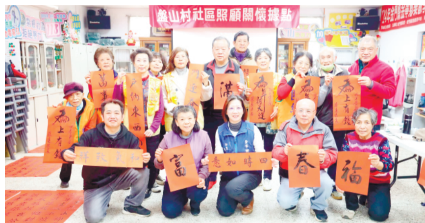
國際佛光會金寧分會聯合盤山村社區舉辦「大師揮毫迎新春·福氣春聯送鄉親」，邀請金門縣文藝協會多位書法名家現場揮毫。(金寧鄉公所提供)

透過春聯揮毫活動，不僅讓民眾提前感受濃濃年味，也展現地方社區、宗教團體與藝文團體攜手合作的成果，讓傳統書法藝術在地深耕，為金寧鄉增添溫暖且充滿人情味的新春風景。