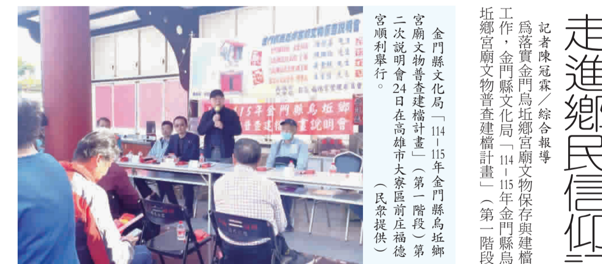
走進鄉民信仰記憶 烏坵宮廟文物建檔逐步到位

皆有縣徽及金門感恩券字樣；100元面額為粉紅色；500元面額為黃棕色；1000元面額為紫藍色。 民政處表示，除了券面樣式還有防偽辨識三步驟，也請民眾熟記：1.看：感恩券面上皆隨機分布防偽纖維，且迎光透視即能看連續性浮水印。2.照：紫外光源照射下，感恩券正面會產生螢光反應，顯現「金門縣徽」識別意象。3.掃：感恩券正面皆印有QRcode，只需使用手機掃描該QRcode，即進入至官方驗證頁面，確認是否為官方編碼；另店家透過感恩券核銷系統，輸入序號即能確認該券是否須「一戶籍現設籍金門縣」，且已經兌付；若為已核銷兌付的感恩券則無法繼續流通使用。 另外，感恩券採用多重防偽印設計，民眾無須擔心感恩券遭影印重複使用問題。若以影印機複印，票券背面會顯示「複製無效」的警語經易辨識偽券。民政處表示，15年感恩券使用期限至12月31日，店家核銷至16年1月31日止，歡迎鄉親多加消費使用，更鼓勵本縣店家響應收受，增加感恩券二次流通機會，創造更多經濟價值。 15年春節感恩券發放作業，即日起在全縣各鄉鎮公所民政課受理申請，本節次凡符合民國50年2月17日以後出生及民國60年2月17日以前出生，並須「一戶籍現設籍金門縣」，且