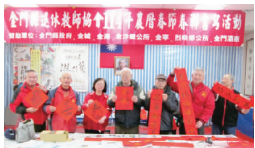
金門縣退休教師協會「新春揮毫送春聯」活動中，多位退休教師揮毫潑墨書寫吉祥喜氣的春聯，提前為新春增添喜慶與祝福。