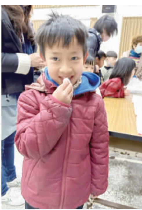
何浦國小舉辦「龍鬚糖體驗」，學子透過看、聽、吃，從中認識珍貴的傳統技藝。