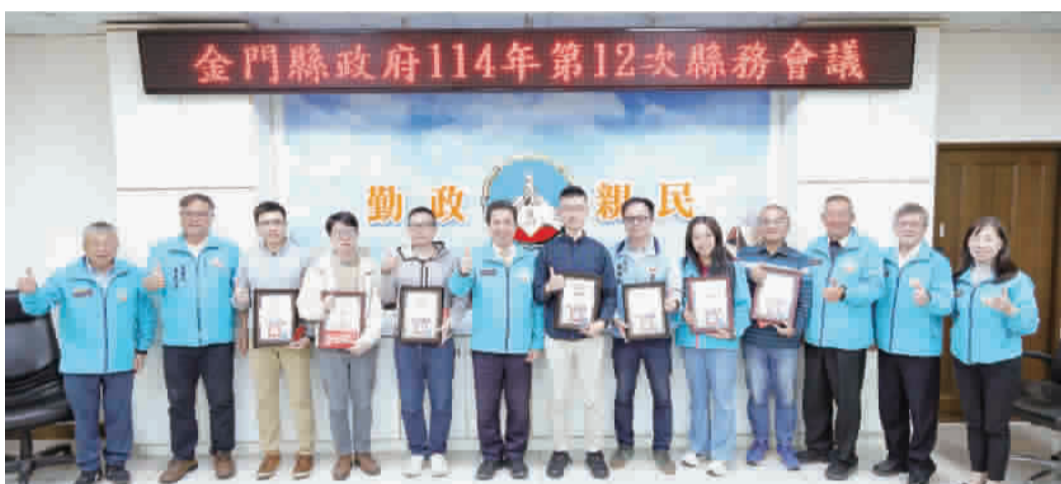
金門縣政府舉辦「2025金門縣政府生成式AI黑客松成果發表及評選會」，並由縣長陳福海頒發獎給獲獎單位。

記者陳冠霖／縣府報導 為加速推動智慧政府與生成式AI技術於公部門的實務應用，金門縣政府近日舉辦「2025金門縣政府生成式AI黑客松成果發表及評選會」，邀集縣府各機關單位組成共16支團隊參與，針對行政效能、公共服務及縣政治理提出多元創新提案，充分展現金門在數位轉型與科技治理上的前瞻布局與行動力。縣長陳福海指出，縣府持續以「科技為用、治理為本」為方向，鼓勵公務體系勇於嘗試新工具，讓科技真正回應行政現場需求，進一步提升服務品質與民眾感受，展現金門在數位轉型與科技治理上的前瞻行動力。 縣長陳福海表示，面對AI快速發展所帶來的治理挑戰與契機，地方政府不能只是被動因應，而應主動學習、勇於嘗試，將科技真正導入行政流程與擴散潛力。 第二名由觀光處「觀光AI獵隊」獲得，團隊以「AI智慧導覽與推薦引擎」為主軸，結合旅遊大數據與在地景點分析，提供個人化遊程建議與即時導覽服務，期望藉由科技輔助，提升遊客旅遊體驗，為金門觀光發展注入新動能。 第三名則由兩支隊伍並列獲得，分別為產業發展處「青創AI頭腦」，提出「青創AI輔導與貸款機器」，以智能化方式整合青年創業諮詢與政策資訊，提升服務效率與可近性；以及人事處「人事處AI」，針對人事行政作業導入智慧化管理構想，強化資料整合與彈性運用，提升整體行政效能。 此外，評審亦選出三隊佳作，包括衛生局「衛你而AI」團隊，打造智慧孕產婦全方位照護平台，結合AI對話與心理評估工具，守護孕產婦身心健康；社會處「智慧社福先鋒隊」，推出「金門暖AI」，為獨居長者提供日常陪伴與即時緊急支援，深化社會安全網；以及工務處「工務智匠」，聚焦防汛整備，運用AI加速文書處理與多源情資整合，實踐「AI助政、防災先行」的治理理念。 縣長陳福海進一步指出，本次黑客松不僅是一場競賽，更是一個跨局處專業同仁在短時間內激盪出具體可行的解方，展現縣府編織整體學習力與創新力。他也特別肯定多數隊伍所提出的構想，已具備直接銜接現行行政流程的條件，未來只要經過適度優化，即有機會轉化為實際政策工具。 縣府也表示，即便未獲獎的團隊，同樣在創意發想與實務連結上展現高度潛力，評審過程中多次指出各隊實力相當、難分軒輊。縣府將持續透過內部培訓與跨單位合作機制，協助各團隊精進提案內容，期盼讓此次黑客松所累積的創新成果，逐步轉化為提升行政效率、優化公共服務、回應民眾需求的具體行動，為金門智慧治理開創更多可能性。