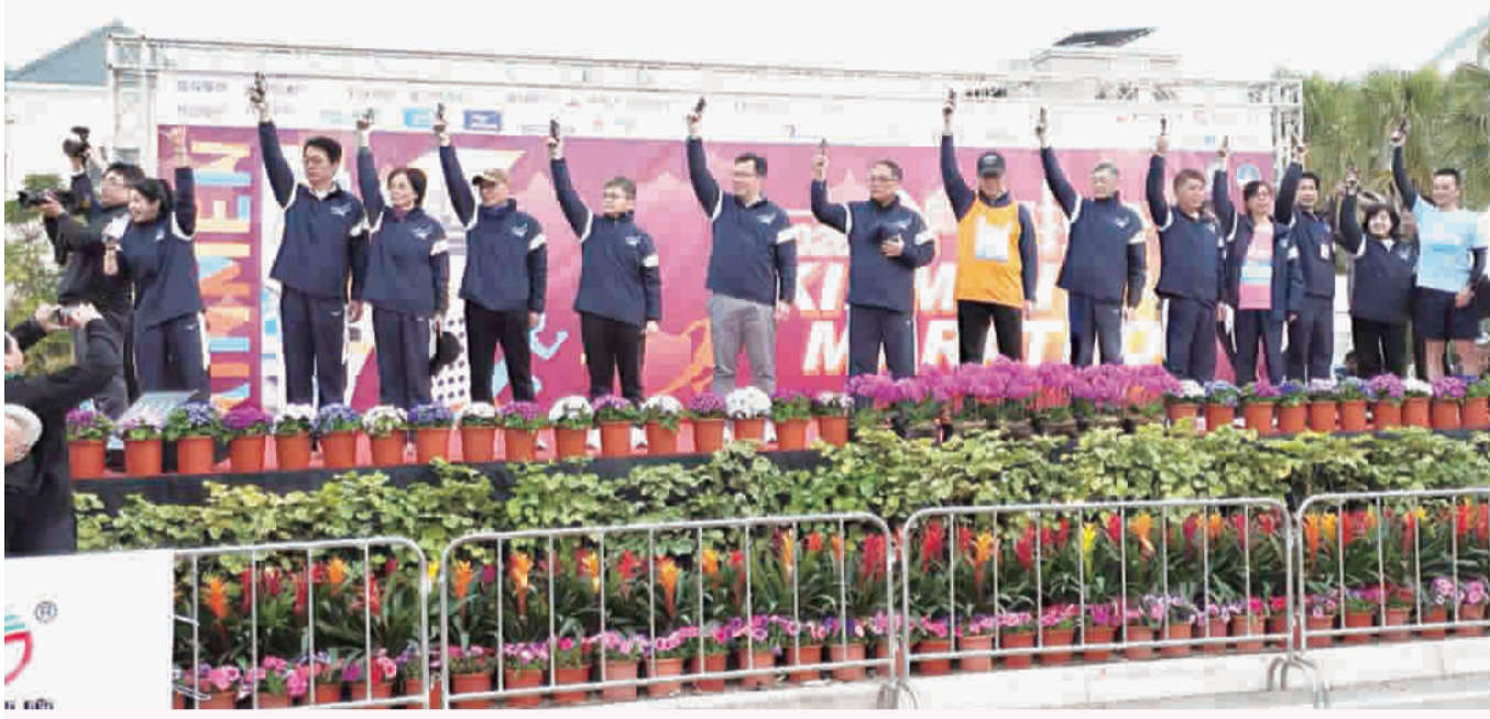
左、金門馬拉松第二天，在貴賓鳴槍聲中起跑；右、競賽組六千多人完賽。