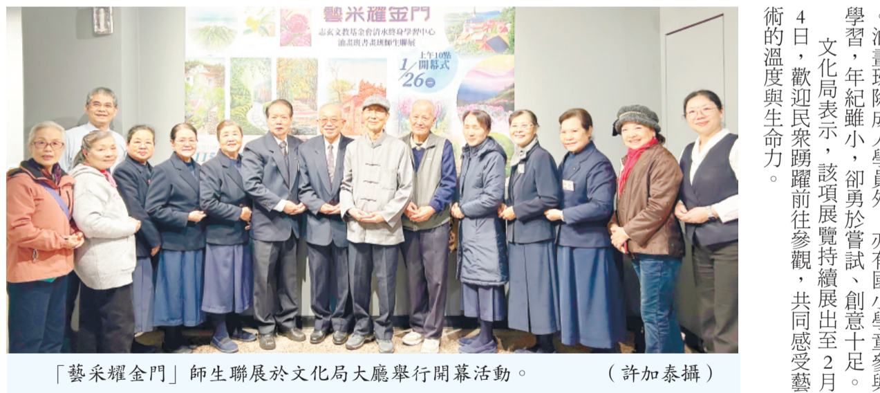
「藝采耀金門」師生聯展於文化局大廳舉行開幕活動。