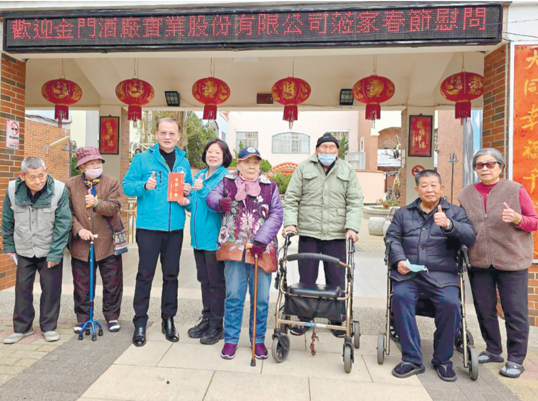
金酒公司慰問社福機構。