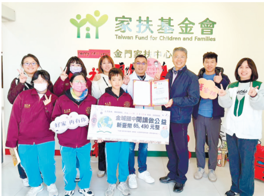
金城國中學生透過閱讀做公益，在行動中實踐社會關懷。