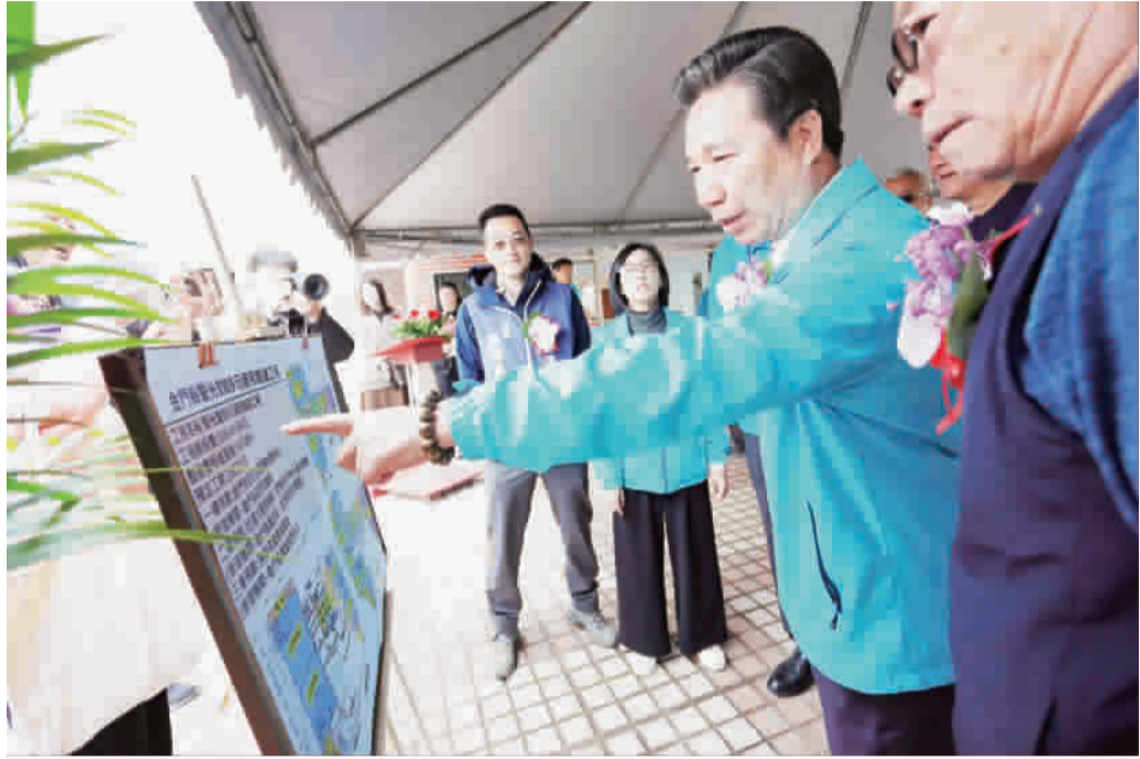
打造「老幼共融」創新場景，金門縣警光會館多元運用整建工程動土。(薛子軒攝)