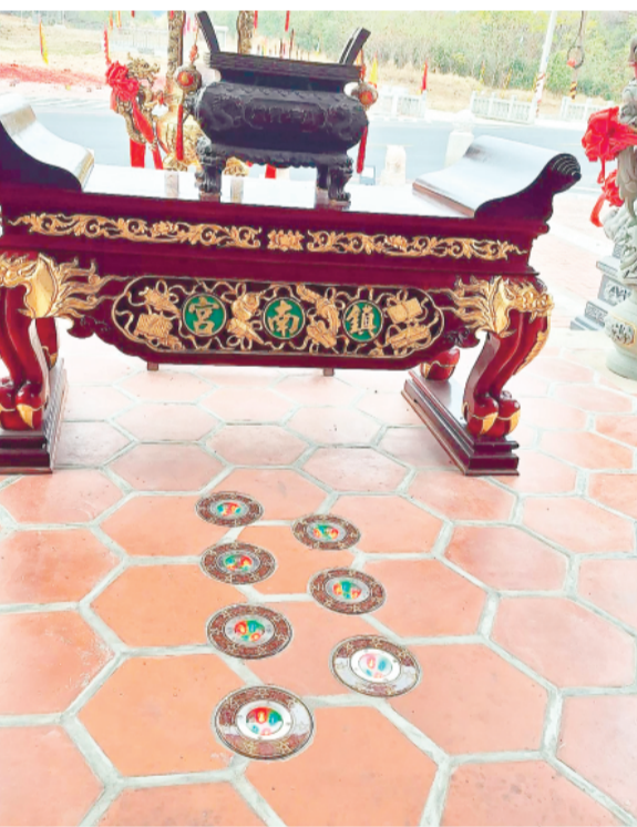
春節腳踩七星燈祈平安，後沙鎮南宮將湧入人潮。