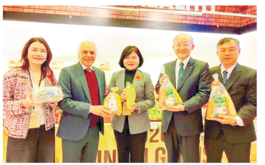
雲林縣政府在巴林連鎖通路AL JAZIRA超市辦理試吃推廣與展售活動。(文：中央社)

【中央社記者陳俊華台北30日電】立法院今天三讀修正通過住宅法部分條文，明定社會住宅應提供至少20%比率，出租給新婚2年內或有未成年子女的婚育家庭；內政部應建置社會住宅登記平台，就戶數需求、房型配置等，作為將來擬訂社會住宅興辦計畫的依據。 立法院第11屆第4會期今天舉行最後一次院會，下午處理住宅法部分條文修正草案。現行條文規定，社會住宅應提供至少40%以上出租給經濟或社會弱勢者，三讀通過條文中增訂，應提供至少20%比率出租給新婚2年內或有未成年子女的婚育家庭。 為確保民眾即時掌握全國社會住宅招租等相關資訊，三讀通過條文規定，內政部應建置全國統一的申請登記平台，並定期統計分析，將其供給區位、戶數需求、房型配置及所需公共設施，作為將來擬訂社會住宅興辦計畫的依據；中央建置的申請登記平台，得直接地方主管機關的社會住宅登記平台。 為促進租賃住宅市場資訊透明，經表決後通過國民黨、民衆黨提案，三讀條文規定，主管機關應定期蒐集、分析、公布住宅資訊，其中租賃住宅市場應依其形態及屋齡區分「每坪租金價格」及「租金指數」；每坪租金價格資訊，以中位數及分位數方式呈現，並以租金補貼、包租代管物件優先辦理。 三讀通過條文中，增訂第19條之1，明定與辦社會住宅各年度計畫物件總量中，包租代管以達50%為原則；另增訂第20條之1，辦理都市計畫新訂、擴大或通盤檢討時，應對當地人口發展及居住狀況，評估住宅使用需求、劃設住宅所需用地。 【中央社記者賴于稼台北30日電】立法院今天三讀修正通過住宅法部分條文，明定社會住宅應提供20%的婚育宅，建置社會住宅申請登記平台，且應定期公布租賃住宅市場每坪租金等。