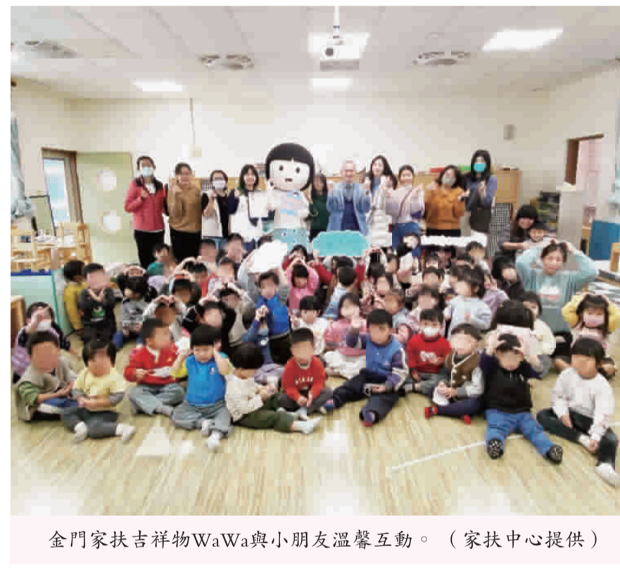
金門家扶吉祥物WaWa與小朋友溫馨互動。

記者蔡麗玉／金寧報導 為讓居家安全觀念從小扎根，同時提升家庭親子陪伴品質，金門家扶中心日前於金寧鄉圖書館舉辦「親子共讀共玩」活動，邀請繪本繪師、居家安全專家及手工作業師參與。活動結合繪本導讀、居家安全探索及手作體驗，透過輕鬆溫暖的互動方式，引導親子在陪伴中學習，讓安全教育自然融入日常生活，陪伴孩子在愛與支持中安心成長。 活動以繪本《小安的大城堡》為主題，透過生動有趣的故事情節，引導幼兒認識居家生活中可能潛藏的安全風險。在家長的陪伴下，孩子們一起閱讀、討論故事內容，並透過提問與分享，學習辨識危險情境，逐步建立基本的自我保護觀念。隨後進行的「居家環境大探險」活動，將抽象的安全概念轉化為具體可行的生活行動。 活動現場氣氛溫馨熱鬧，孩子們在遊戲與學習中感受到家長的關注與陪伴，家長在互動過程中，理解不同成長階段幼兒所需要的安全引導方式。多位家長於活動後回饋表示，感謝家扶用心規劃活動內容，讓親子相處不但是共享時光，更是成為充滿意義的學習歷程。 為使活動進行更加順暢，金門家扶特別邀請參與週末課輔班的家扶受助學童擔任活動小志工，協助書Q餅手作流程並陪伴幼兒互動。這群年齡介於六至十二歲的小志工，在社工的引導下分工合作，協助照顧幼童、減輕家長負擔，也讓家長更能安心投入親子共讀與手作體驗。 透過實際參與服務，小志工們學習責任、合作與付出的意義，展現家扶在兒童陪伴與學業力培力上的具體成果。活動背後的溫暖力量，也來自社會各界的支持與同行。寧中、小學附設幼兒園日前將年貨大街活動所募集的愛心收入捐贈予金門家扶中心，由校長宋文法代表全體師生完成捐贈；宋文法校長表示，縣內仍有許多孩子與家庭需要社會的關懷與支持，期盼透過幼兒園孩子、家長與老師共同參與的愛心行動，讓關懷在社區中持續流動，將溫暖傳遞到金門的每一個角落。