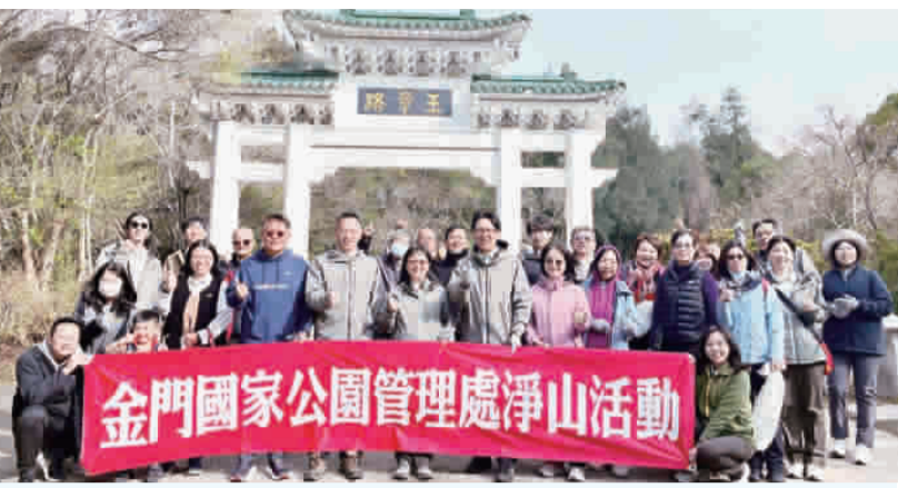
淨山成為金管處的新春傳統，以行動守護山林、迎接新年。