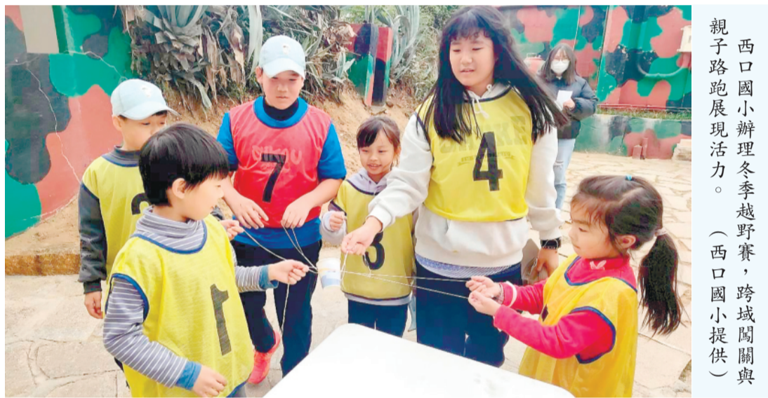
西口國小辦理冬季越野賽，跨越閩南與西口路跑展現活力。

榮民服務處處長劉信義強調，榮民前輩曾在國家發展歷程中奉獻青春、守護家園的責任，必須以更細緻、更貼近需求的方式回應。未來將持續秉持「服務、關懷、專業、熱忱」的核心價值，深化訪視制度、強化弱勢關懷網絡，並結合地方政府與民間資源，建構更完善的支持體系，讓榮民及眷屬在生活上、醫療、就業與就業等面向皆能獲得即時而溫暖的協助。 參與同仁表示，透過共同完成淨山任務，不僅對環境保護有更深刻認識，也在彼此扶持中感受到團隊凝聚的力量；而在寺院靜心祈福的過程，更讓人重新思考服務工作的初衷，提醒自己以同理心與責任感面對每一位服務對象。 榮服處表示，未來將持續以實際行動落實社會關懷與環境永續理念，讓服務不僅止於制度與措施，更能延伸至文化關懷與生活層面，打造更具溫度與深度的服務模式。新的一年，榮服處全體同仁將以嶄新的精神面貌，攜手守護榮民眷福祉，讓關懷持續、溫暖不斷。