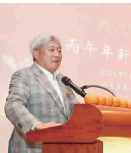
活動會場花絮。

〔新加坡訊、整理轉稿：僑訊小組〕 2月18日大年初二，洋溢著濃濃年味的坡新加坡金門會館張燈結綵、喜氣盈門，盛大舉行新春團拜活動。鄉親們扶老攜幼、攜眷而來，與鄉團代表、青年團成員及駐新加坡台北代表處官員齊聚一堂，共敘鄉誼、同賀新歲，場面溫馨熱鬧。