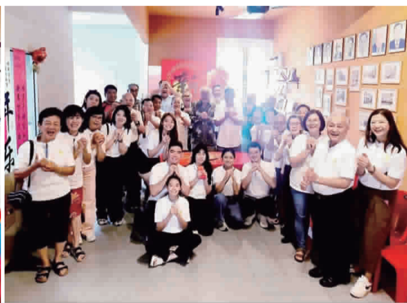
團拜花絮。

〔馬六甲報導、整理轉稿：僑訊小組〕 丙午年正月初三，春意盎然，喜氣滿堂。馬六甲金門會館舉行新春團拜活動，理事同仁與金門鄉親齊聚會館，互道新禧、共敘鄉誼，在溫馨融洽的氛圍中迎接新的一年。