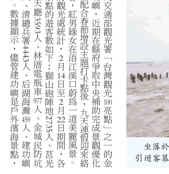
坐落於浯江溪口的建功嶼是金門主要的離岸景點，全年吸引遊客慕名絡繹來訪。

冬季海風凜冽，遊客數與其它季節相較銳減，但仍維持一定的水平，表現它在全島各主要景點中的吸引力和競爭力。坐落於浯江溪口，原為陸軍W026據點，距金門本島約50公尺，面積僅500平方公尺的建功嶼，舊名珠嶼、鰲嶼和重嶼，相傳早年百姓將瘋癲病患留置島上，任其自生自滅，因此又稱「瘋癲嶼」。國軍進駐後取「打第一仗，建第一功」之意，1960年更名為現名。隨著國軍「精實案」裁減兵力，在1975年交由縣府接管，闢建為離岸觀光景點。