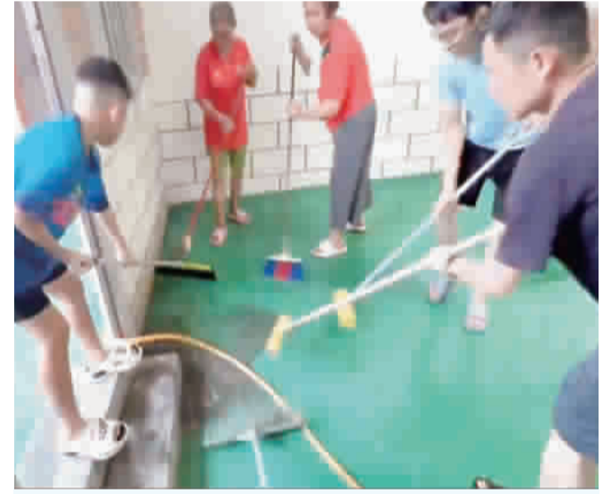
雪蘭莪金門會館的日常與團結。

新年的鐘聲尚未敲響，但團結與溫情早已在會館內悄然綻放。雪蘭莪金門會館在大家齊心協力下，以嶄新的面貌迎接新歲，也為僑社注入更多凝聚力與希望。