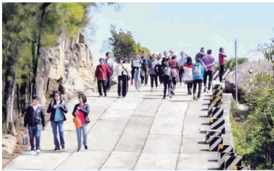
初九天公生，雖然是上班日，仍吸引不少民眾上山祈福。