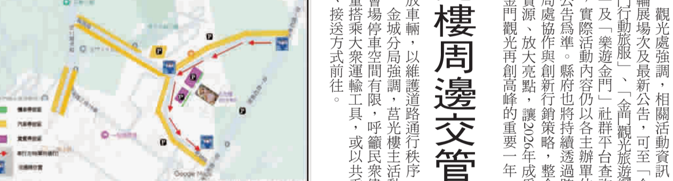
金門縣觀光處整合行銷年度活動，水獺阿特快閃：島嶼探險之旅，活動交通與停車空間圖。(27)

在停車規劃方面，民衆及工作人員可多加利用莒光樓停車場及周邊停車格、莒光共融公園停車場，以及西海路二段（水試所）順向單邊停車空間，另暨城路亦開放雙向路邊停車使用。若上述停車空間屆時已停滿，警方將視交通狀況，彈性開放暨城路莒光樓路段道路右側供車輛臨時停放。 此外，配合本次活動集章任務點，清金門鎮總兵署、朱子祠及後浦16藝文特區周邊之中興路、莒光路、渚江街及珠浦北路等路段，將嚴格禁止違規停車。參與活動的民衆如需前往上述地點，汽車可停放於民生路停車場、金城鎮公所後方停車場，以及民生停車場A區、C區等指定停車空間，金城分局亦將加強取締周邊違規停車。