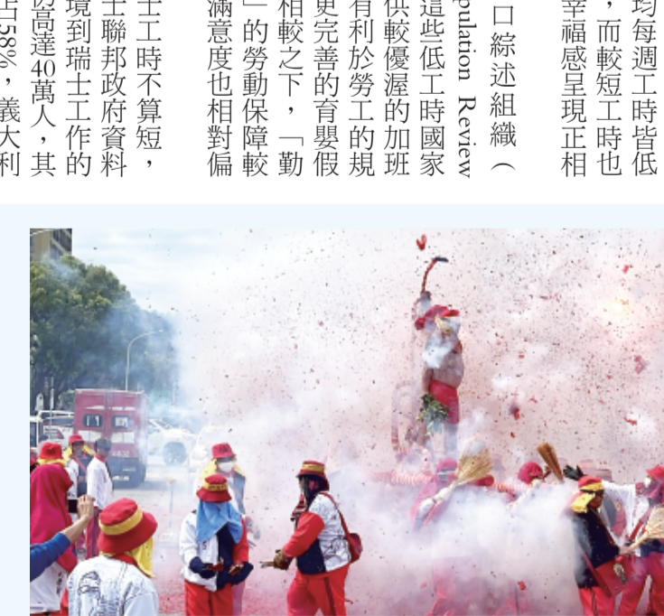
寒單爺首炸 台東元宵嘉年華揭開序幕 台東元宵節重頭戲炸肉身寒單(邯鄲)26日中午在台東市南京路首炸，也為台東市公所舉辦的元宵節嘉年華系列活動揭開序幕。

台東元宵節重頭戲炸肉身寒單(邯鄲)26日中午在台東市南京路首炸，也為台東市公所舉辦的元宵節嘉年華系列活動揭開序幕。 寒單爺首炸，是台東元宵節的重頭戲。今年首炸活動於26日中午在台東市南京路舉行。當晚，寒單爺神像被抬上花車，在震天的鞭炮聲中，由信眾抬著繞行市區。首炸活動揭開了台東元宵節嘉年華系列活動的序幕。