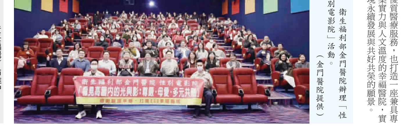
衛生福利部金門醫院辦理「性別電影院」活動。

記者呂掌中／綜合報導 為感謝全體醫護及行政同仁長期以來堅守崗位、守護鄉親健康的辛勞付出，同時持續深化性別平權與多元共融理念，衛生福利部金門醫院於25日晚間18時，在金門國賓戲院舉辦「性別電影院」活動，邀請院內同仁一同觀賞票房熱映電影《陽光女子合唱團》，透過溫暖動人的影像敘事，傳遞尊重差異與彼此扶持的價值，為平日高壓忙碌的醫療工作注入一股療癒與感動的力量。 本次活动以「看見高牆內的光與影：尊嚴、母愛、多元共融」為主題，結合電影所呈現的女性生命歷程與社會處境，引導同仁思考性別角色、家庭責任、社會標籤與人權價值等議題。影片透過音樂與情感鋪陳，描繪在困境中尋找希望與自我認同的過程，讓觀影者在感動之餘，也能反思日常工作與生活中，如何以更包容與理解的態度看待差異，實踐尊重與平等。 院長徐德福表示，醫療工作肩負高度專業與社會責任，醫護同仁長年站在第一線，不分晝夜守護民衆健康，是醫院最珍貴且不可或缺的資產。醫院在精進醫療技術與設備之餘，也持續關注同仁的身心健康與職場環境品質。此次舉辦性別電影院活動，除了向全體同仁表達誠摯感謝，更希望藉由集體觀影與交流，營造紓壓放鬆的氛圍，讓大家在忙碌之餘獲得心靈充電的時刻。 醫院將以更開放、多元與包容的