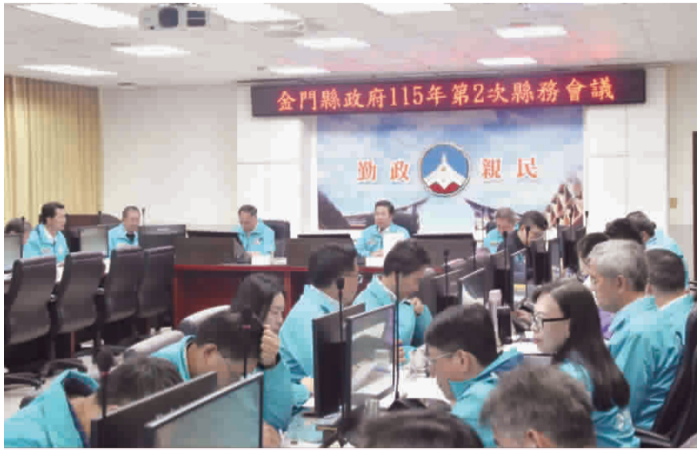
縣府召開115年第2次縣務會議。

陳福海指出，「禮貌金門」不是口號，而是金門人情味與傳統價值的延伸。他回憶選舉期間走訪各鄉鎮所感受到的溫暖互動，強調政府存在的意義，不只是完成行政程序，更要讓鄉親「有感」甚至「感動」。 人事處已擬定禮貌運動實施計畫，核心精神為「有禮貌、懂尊重、會溝通」，並提出具體「31313」行動規範：第一，「3秒微笑」，以真誠笑容迎接洽洽公民；第二，「3步距離溝通」，走出櫃檯、降低音量、清楚說明，提升服務品質；第三，「3次感謝」，養成主動表達感謝的習慣，營造正向職場文化。 計畫將自3月起展開宣導與教育訓練，