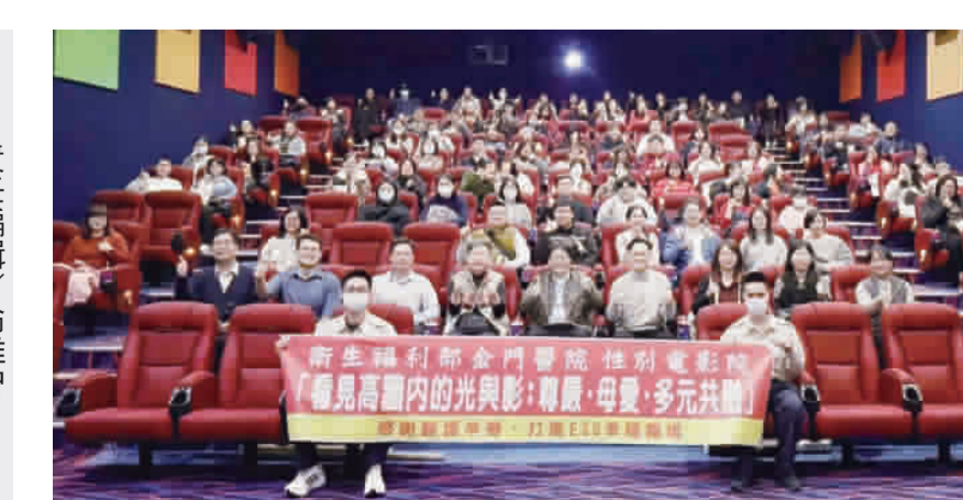
衛生福利部金門醫院辦理「性別電影院」活動。

來積極導入以「永續發展理念」，在環境保護（Environmental）、社會責任（Social）與公司治理（Governance）三大面向持續精進。其中，在「社會責任」層面上，包含推動性別平等、打造友善職場、強化員工關懷措施；在「治理」層面上，則透過制度化管理與透明化溝通，建立尊重差異、重視人權與公平對待的組織文化。此次活動正是落實「以人為本」的具體展現，彰顯醫院對多元共融價值的承諾。 活動當晚，現場氣氛溫馨熱絡，不少同仁在觀影後分享心得，表示透過電影看見不同生命處境中的堅韌與溫柔，也更深刻體會到理解與支持的重要性。對於長期處於高強度醫療工作環境的同仁而言，這樣的活動不僅是情緒抒發的出口，更是彼此交流與凝聚向心力的契機。 醫院強調，性別平權與多元共融並非口號，而是需要在日常管理制度設計與互動中持續實踐。未來將持續規劃相關教育訓練與人文關懷活動，結合專業醫療與文化素養，深化同仁對性別議題與人權價值的認識，讓尊重與平等成為組織文化的核心精神。 衛生福利部金門醫院辦理「性別電影院」活動。