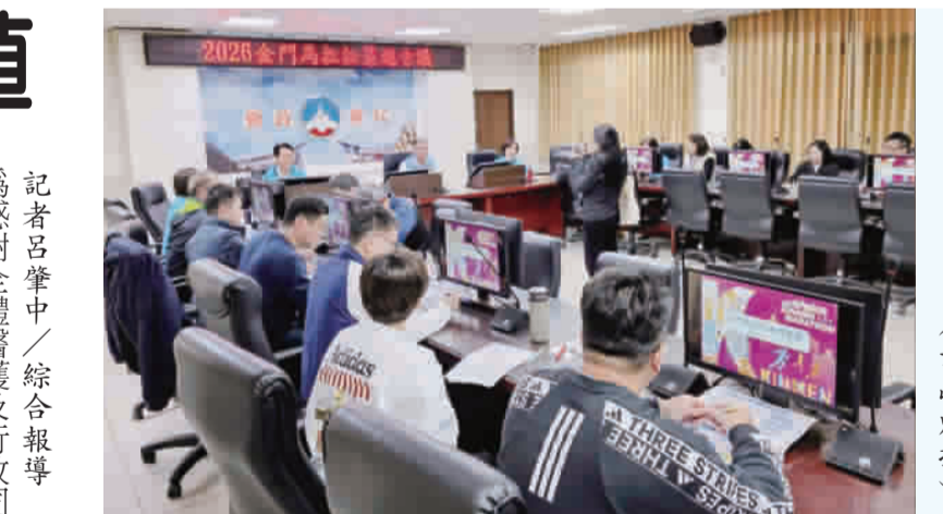
縣府召開馬拉松策進會議，針對今年度策進對策。

記者許峻魁／金城報導 一年一度的「二〇二六年金門馬拉松」已經在二月底正式落幕了，縣府縣府召開馬拉松策進會議，針對今年度策進對策。