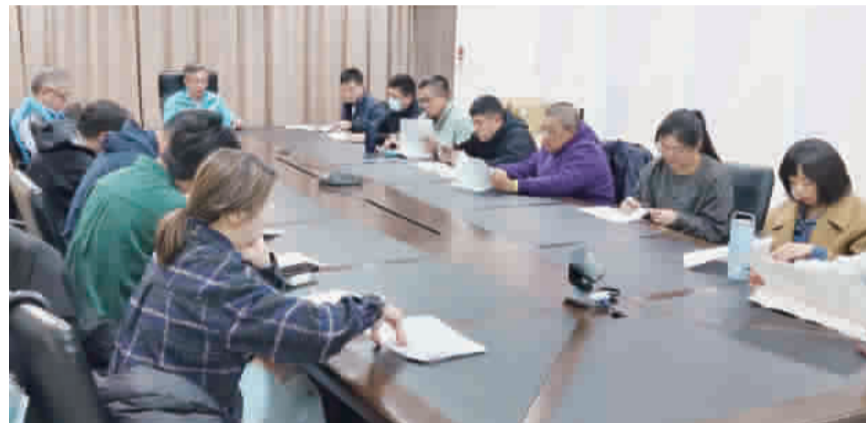
縣府邀集中央駐金單位及地方十多個機關召開「2026年金門縣觀光活動第二次研商會議」。

記者莊煥寧／縣府報導 為迎接新一波旅遊人潮，提升整體行銷效益與活動能见度，金門縣政府觀光處提前布局，繼去年（114）年10月20日盤點各單位年度活動後，於今（115）年2月24日再度邀集中央駐金單位及地方十多個機關，召開「2026年金門縣觀光活動第二次研商會議」。