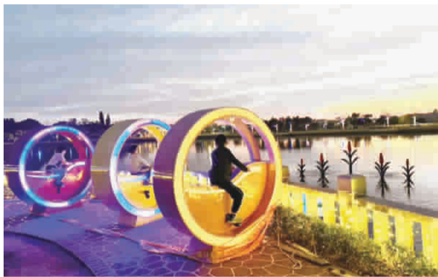
文化局邀請鄉親共賞金門元宵燈會。

文化局表示，本屆燈會以「樂園」與「馬年」為主軸，融合童趣元素、互動科技與在地文化特色，打造全齡共享的夜間節慶空間。主燈以金門酒廠玉璽酒系列為設計核心，象徵十二年釀造精神與時代傳承，將高粱文化轉化為巨型藝術作品，展現金門深厚的人文底蘊與創意能量。 主燈周邊由12座生肖小玉璽酒燈簇擁，形塑氣勢磅礴的迎賓主燈道。夜幕低垂後，整點燈光秀隨即展開，光影隨著主燈線條流動變化，靜態玉璽造型幻化為動態