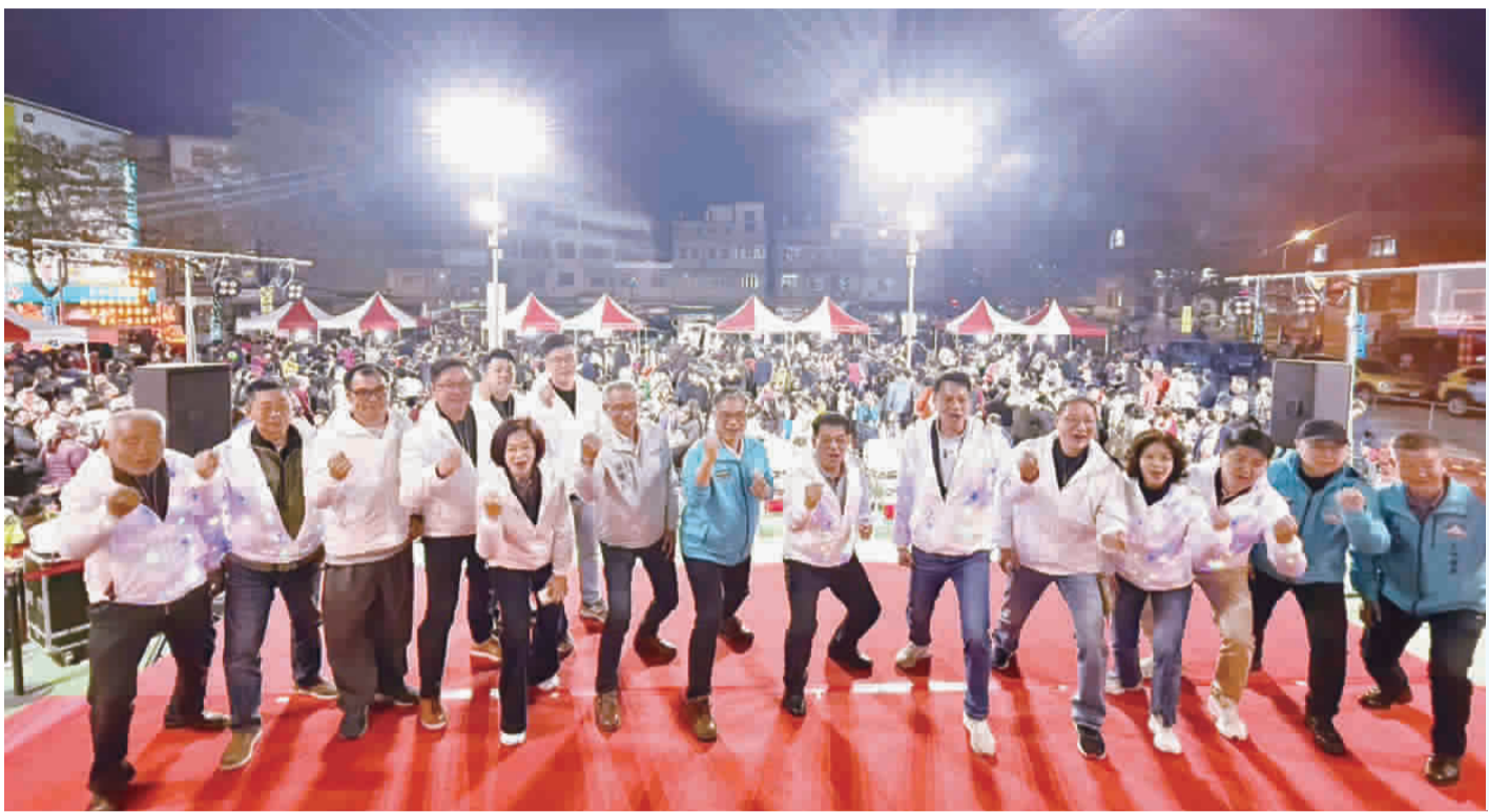
金湖舉辦元宵賀歲慶團圓系列活動。