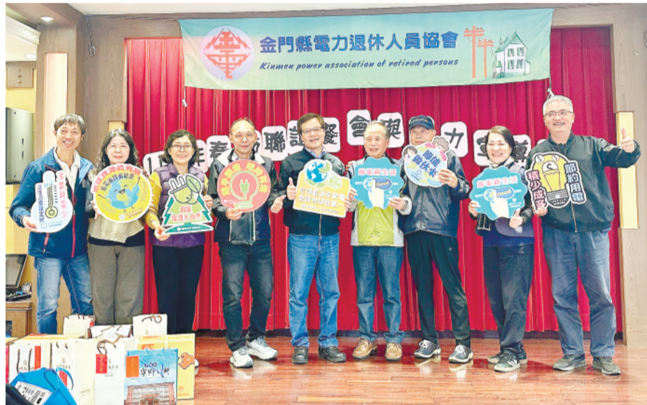
金門縣電力退休人員協會昨日舉辦「春節聯誼餐會與電力宣導活動」。