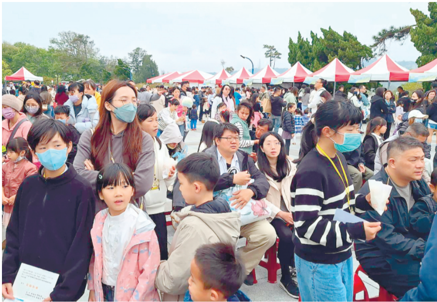
縣府昨在太湖畔中正公園表揚全縣優秀兒童。