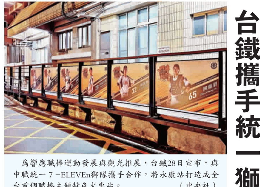
為響應職棒運動發展與觀光推廣，台鐵28日宣布，與中職統一7-ELEVEn獅隊攜手合作，將永康站打造成全台首個職棒主題特色火車站。

【中央社記者沈佩瑤台北28日電】「健康存摺」在COVID-19疫情期間曾是領口罩、買快篩小幫手，如今將轉型為健康管理工具，除推出生活型態量表與AI衛教，今年規劃結合「健康幣」，累計積分可兌換獎勵，促進落實健康行為。 根據衛生福利部中央健康保險署資料，全台灣3高慢性病患數高達850萬人，佔2022年健保點值支出的4成。各類慢性病患中，糖尿病患者約有30萬人，佔健保總額支出15%。 當台灣已經邁入超高齡社會，每5個人中就有1名65歲以上長者，慢性病成重要挑戰。「健康存摺」不只是收集預防保健、篩檢資料等紀錄的工具，更要進一步精進功能，守護國民健康。一衛福部長石崇良今天上午出席健保31週年慶活動前如此說道。 石崇良指出，健康存摺在COVID-19（2020）冠狀病毒疾病（疫情期間提供領口罩、買快篩及PCR查詢功能），下載量一度突破1200萬人，隨著疫情趨緩，使用的人「有一點冷掉」，目前常態性使用人數在100萬至300萬人之間。 健康存摺去年已上線「生活型態量表」，民眾可針對營養、睡眠、運動及壓力進行自我評估。石崇良表示，目前也推出糖尿病AI衛教功能，並針對心血管病（ASCVD）建立分級量表。 從石崇良在去年10月拋出「健康幣」構想至今，上路時程卻一延再延。他告訴媒體，目前正進行兩大規劃：第一是「健康積分」計算，已組成專家小組開發公式，依據各項健康行為對健康的實質貢獻換算為積分。第二則是積分兌換機制，即「健康幣」。 石崇良說，此功能將設計在國健署的「Health Call App」中，核心概念是「PPP」（公私夥伴關係），規劃與民間企業合作，提供民眾兌換優惠。 出席活動的台大醫院院長余忠仁指出，健康存摺查詢已突破6億次，顯示民眾愈來愈重視健康資訊。台灣就醫便利，民眾可透過健康存摺整理資料與醫師討論，有助長期健康管理。 不過他強調，影響健康與壽命的關鍵，仍在於飲食、運動與生活習慣，「對健康的重視，應該高於對醫療資源的使用」。 同台的台灣醫務管理學理事長、新光醫院副院長洪子仁說，將健康存摺內的「健康積分」轉型為「健康幣」，象徵民眾健康APP從「紀錄」邁向「價值化」的過程。這正是「醫療是投資」的具體實踐，讓健康行為產生實質價值，帶動預防醫學的普及，攜手全民邁向數位健康管理的里程碑。