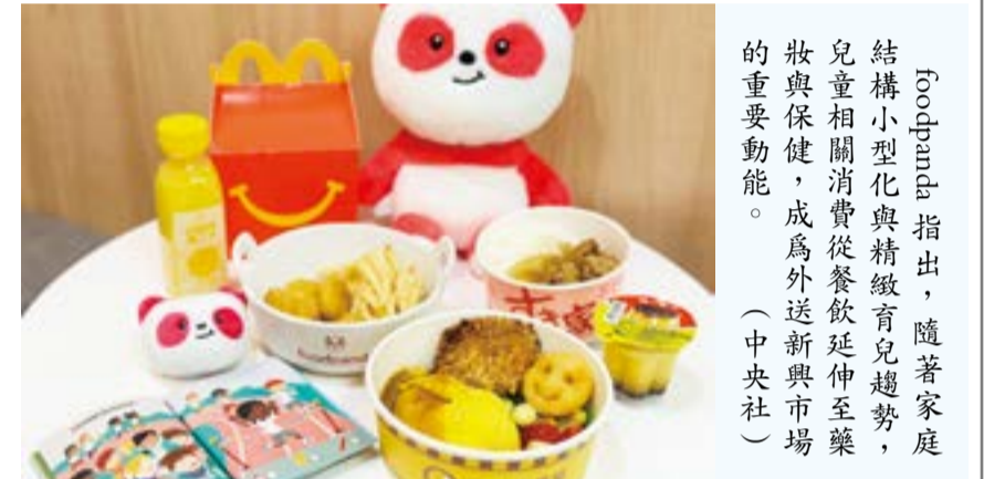
Foodpanda指出，隨著家庭結構小型化與精緻育兒趨勢，妝與保健，成為外送新市場的重要動能。(中央社)

【中央社記者江明晏台北30日電】外送市場「兒童經濟」升溫，Foodpanda觀察指出，提供兒童餐點的麥當勞、Sukiya與CoCo壹番屋咖啡，合計年度銷售近新台幣5,000萬元；愛點兒童餐點的城市由桃園奪冠，宜蘭年增4成，卡通IP授權商品買氣飆5成，寵物商機成兒童節新戰場。 兒童節與清明節連假將屆，兒童節也帶動外送市場「兒童經濟」升溫，Foodpanda今天發布觀察指出，隨著家庭結構小型化與精緻育兒趨勢，兒童相關消費從餐飲延伸至藥妝與保健，成外送新興市場的重要動能。 在美食方面，Foodpanda發現，提供兒童餐點的麥當勞、