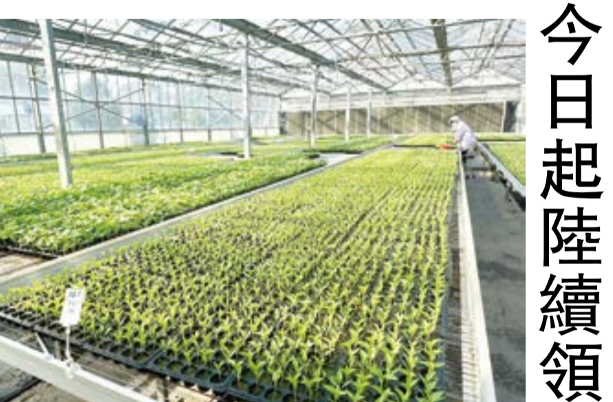
農試所115年春季蔬菜穴盤苗今日起受理已登記之民眾前往繳費及領苗。

記者陳麗好／綜合報導 金門縣農業試驗所二〇二五年春季蔬菜穴盤苗經受理民眾登記後，陸續培育完成，並訂於4月1日起至4月15日於農試所內受理民眾領苗，另訂於4月3日及4月11日兩日加碼服務鄉親，敬請已登記之民眾準時前往領取(假日為上午8:11時)前往所內洽行政課繳費及領苗。 金門縣農業試驗所指出，經於二〇二五年2月24日至3月6日開放民眾登記春季穴盤苗，計有富貴2號西瓜、黑盤苗、甜瓜、甜佳西瓜、銀輝西瓜、翠綠星甜瓜、百里香、甜椒、朱萆辣椒、麻糬茄子、達豐黃秋葵、阿嬌南瓜、吉樂