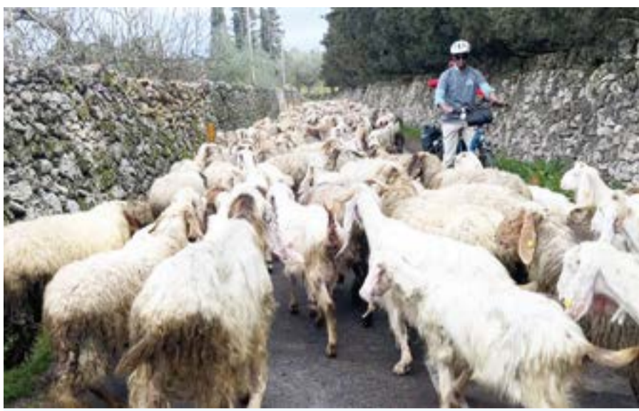
位於義大利靴型國土「鞋跟」位置的薩倫托區域，近期推出一條長達300公里的Ciclonica單車道，騎行可享受當地鄉村風光，偶爾還會遇到羊群散步。

【中央社記者黃雅詩薩倫托30日專電】位於義大利靴型國土「鞋跟」位置的薩倫托區域，近期推出一條長達300公里的Ciclonica單車道，騎行融入海天一色湛藍，穿梭古城巷弄，偶與羊群爭道，或停歇品嚐特產耳朶麵、野蘆筍，猶如以兩輪沿途譜一曲「世外桃源」詠嘆調。 薩倫托(Salento)在義大利普利亞大區(Puglia)南半部，擁有全義最優美海岸之一，此處新推出的300公里Ciclonica單車道，由6條50公里路段組成，又可分為5個環形路線，方便彈性規劃多日或單日自行車活動，成為全球熱愛單車旅遊者的新座標。 推動Ciclonica單車道，對薩倫托兼具環保、觀光、振興產業等複合性意義，獲該區10個市鎮共同支持納入當地「綠色社區」(Green Community)計畫，由政府「國家復甦暨韌性計畫」(PNRR)提供資金。 中央社等多國外媒記者日前應邀前往騎行體驗，感受南義特有「慢活方式」，及與台灣相似的濃厚人情味。