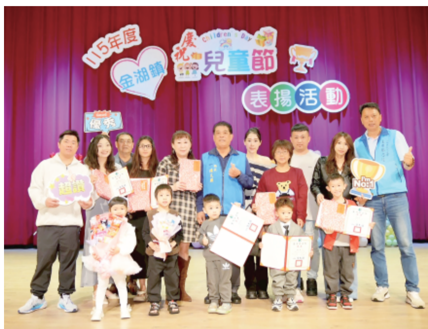
金湖鎮「115年度兒童節優秀兒童表揚活動」