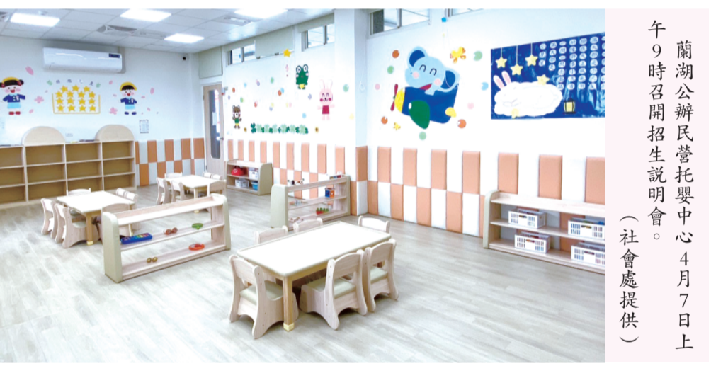
蘭湖公辦民營托嬰中心4月7日上午9時召開招生說明會。

蘭湖公辦民營托嬰中心4/7起受理報名 記者陳冠霖／綜合報導 金門縣政府委託社團法人金門縣嬰幼兒托育協會辦理本縣蘭湖公辦民營托嬰中心，該中心設置於金門縣社會福利館2樓（金湖鎮瓊徑路35號），訂於4月7日上午9時召開招生說明會，並於說明會結束後開始受理報名，該中心可招收30名0-2歲嬰幼兒，報名資訊如下： 一、報名資格：兒童需設籍金門縣，且其父或母（或監護人）其中一方於報名日前前推算連續設籍金門縣滿6個月以上。 二、報名時間：自15年4月7日（星期二）起至15年4月13日（星期一）止。（平日上午09:00-12:00，下午01:00-04:00，週六、日上午09:00-12:00時），家長於繳交應附資格證明文件後，始完成報名程序並具備抽籤資格。 三、收托順序：（一）第一序位：提供16%（5名）名額收托弱勢家庭幼兒，弱勢對象如下（應檢附證明）：1.弱勢家庭（含縣府列冊之低收入戶、中低收入戶或經機關核定之危機家庭、特殊境遇家庭身分資格之嬰幼兒）。2.發展遲緩或持有輕度身心障礙。 證明之嬰幼兒。3.嬰幼兒其「手足」或「父母或監護人」之一為中度以上身心障礙者。4.未成年父母家庭之子女。（二）第二序位：提供50%（15名）名額收托設籍於金湖鎮之一般家庭兒童。（三）第三序位：提供34%（10名）名額收托於其他鄉鎮之一般家庭兒童。 各身分分別申請收托嬰幼兒超過過收托名額時，採抽籤方式辦理，抽籤時間訂於15年4月14日（星期二）上午10時。由承辦單位以公正、公開、公平之原則抽出正取及備取名單，抽籤過程將全程錄影並於該中心FB開場現場直播。各身分分別抽籤及備取不混合，如未達收托名額，則依序位順位遞補。 蘭湖公辦民營托嬰中心採混齡收托，現場環境符合兒童適齡發展與安全健康，縣府團隊積極推動普及、優質的友善育兒環境，縣府持續建置公共托育設施服務鄉親，期望降低本縣家長養育育兒的各種負擔。該中心將於4月20日起正式收托，提供家長平價合宜之托育服務，該中心亦提供臨時托育服務，家長如有疑問，請於上班時間洽詢承辦單位：社團法人金門縣嬰幼兒托育協會，服務專線電話：082-330665。