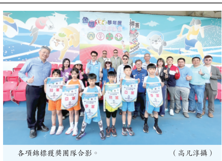
各項錦標獲獎團隊合影。

記者呂肇中／綜合報導 金湖鎮舉辦「115年度兒童節優秀兒童表揚活動」，於3月31日在金門縣社會福利館演藝廳隆重舉行，由鎮長陳文顯親自頒獎，表揚來自金湖學區各國小及幼兒園共86位優秀兒童。鎮長除對獲獎學童表達高度肯定外，也提前祝願全體學童兒童節快樂，現場氣氛溫馨喜悅。 活動由金湖國小舞蹈團精彩演出揭開序幕，為典禮增添熱鬧氛圍。當天由陳文顯鎮長主持，金門縣政府參議王登緯、金湖鎮民代表會主席蔡乃靖、副主席李秀華及多位代表與地方仕紳、各校校長及幼兒園園長等貴賓到場觀禮，另有眾多家長出席，共同見證孩子們的榮耀時刻。 參議員王登緯表示，代表縣長陳福海出席活動深感榮幸，並指出縣府長期重視兒童教育與學習環境，從托育品質提升、校園設施改善到多元活動推動，致力打造完善的成長環境。他除向獲獎學童與家長致賀外，也感謝教師與家長的辛勞付出，讓孩子們在關