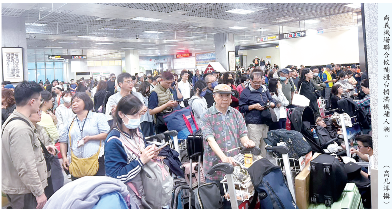
高義機場聯合候機櫃台擠滿候補人潮。