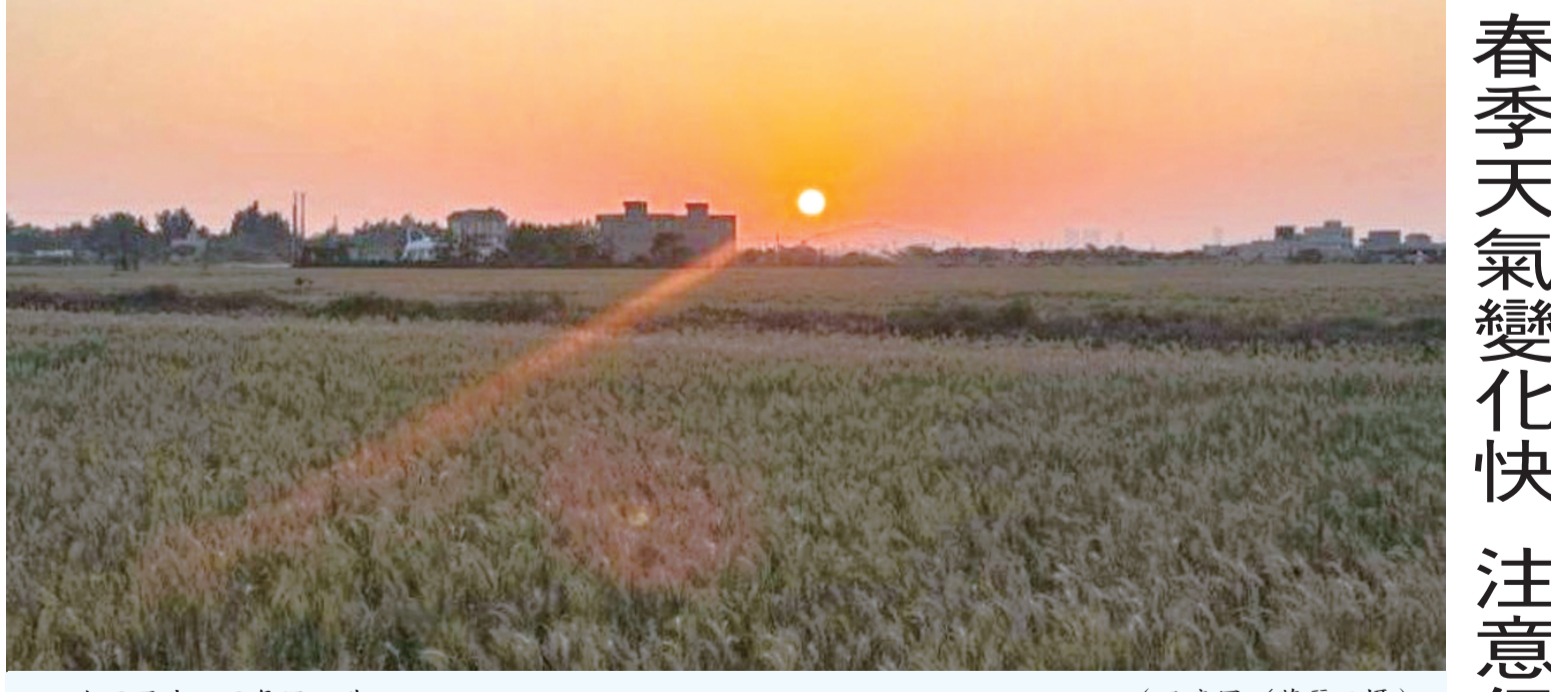
九日至十二日氣溫回升。(示意圖/蔡麗玉攝)

記者蔡麗玉／金城報導 金門地區本週天氣呈現先不穩後穩定的型態。根據金門氣象站官網顯示，受鋒面及東北季風影響，上半週各地易有短暫陣雨或雷雨，下半週天氣轉為晴到多雲。 氣象站指出，昨日鋒面通過並伴隨東北季風增強，今日東北季風逐漸減弱，天氣較不穩定，局部地區可能出現短暫陣雨或雷雨，氣溫約在攝氏17至24度之間，提醒民眾外出攜帶雨具。 隨著天氣系統遠離，九日至十二日金門地區將轉為晴到多雲，氣溫回升至18至26度，但早晚仍有涼意，民眾外出應適時增添衣物。 氣象站表示，春季天氣變化快速，日夜溫差較大，民眾應注意保暖與防風，並建議家中有長者及幼童者加強水分補充及維生素C攝取，以降低呼吸道疾病風險。 氣象站提醒，預報時間較長仍可能與實際天氣略有差異，建議持續關注最新氣象資訊。