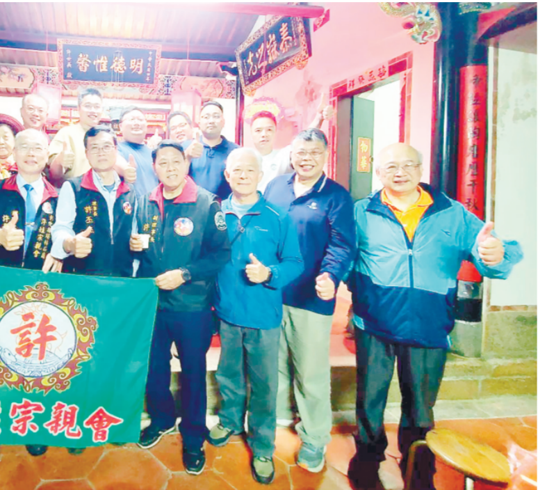
彰化、漳州、金門—兩岸三地許氏宗親會清明祭祖。

記者陳冠霖／縣府報導 為全面提升金門在地產業競爭力與市場吸引力，金門縣政府產業發展處推動「金門特色產業輔導及品質提升行銷計畫」，並舉辦「特色產業輔導及品質提升行銷計畫說明會」，邀請本縣餐飲、伴手禮及烘焙等相關業者踴躍報名參加。 產業發展處說明，本說明會屆時將由執行單位財團法人中衛發展中心專業團隊進行簡報，內容涵蓋申請資格、補助項目及執行方式，包括品牌行銷、通路拓展與空間優化等面向，協助業者掌握計畫資源並提升申請效益；同時亦介紹中央相關輔導資源與補助方案，協助業者了解可銜接之中央計畫，強化資源整合運用，擴大輔導效益與發展動能。 產業發展處強調，本計畫除協助個別業者升級外，更著重於打造完整產業發展生態系，透過系統性輔導機制，促進產業整體體質提升，強化市場競爭優勢。未來將持續整合中央與地方資源，引進專業輔導能量，深化對在地產業的支持，推動金門產業邁向永續發展。 產業發展處表示，本計畫受理申請報名至15年4月24日下午5時30分止，並訂於15年4月10日下午2時假縣府多媒體簡報室辦理計畫說明會，歡迎有