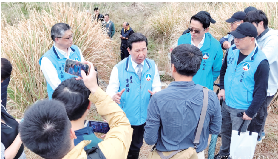
上、金門縣定古蹟「陳顯墓」傳出疑似遭人破壞，金門縣長陳福海親自到場現場地勘。 右、金門縣定古蹟「陳顯墓」墓體出現一處大洞。

記者陳冠霖／綜合報導 金門縣定古蹟「陳顯墓」傳出疑似遭人破壞，引發地方關注。金門縣長陳福海十分重視此案，7日下午親自到場現場地勘，對文化資產安全表達高度關切，並指示相關單位儘速釐清案情，強化古蹟保護作為，確保珍貴歷史文化資產不再受侵害。