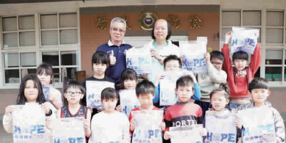
鎮長吳有家分別至各校（金沙、何浦、安瀾、述美、多年），將兒童節禮物送達學子手中。