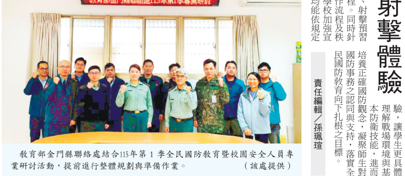
教育部金門縣聯絡處結合115年第1季全民國防教育暨校園安全人員專業研討活動，提前進行整體規劃與準備作業。

記者陳冠霖／綜合報導 教育部金門縣聯絡處為落實推動全民國防教育，深化高中職學生對國防的認識，持續協助金門高中及金門農工辦理多項全民國防教育課程。其中，學生實彈射擊體驗活動為重要教學環節之一，為確保活動順利進行，聯絡處於日前舉行暨校園安全人員第1季全民國防教育暨校園安全人員研討活動，提前進行整體規劃與準備作業。 本次研討活動特別邀請金門防衛指揮部派員備訓射擊專長之專業幹部協理擔任講師，針對「射擊預習」、「槍枝構造」及「安全規定」等重點內容進行系統性講授，並邀集金門高中及金門農工之軍職人員、校安人員及國防教師共同參與。課程透過結合靶場實務經驗與現場交流討論，使與會人員能更全面掌握射擊流程與安全要點，進一步提升協助學生實作時的專業度，確保學生於正式射擊當日能在安全無虞的環境下順利完成體驗任務。 會中亦由聯絡處處長暨督導進行教育部當前重要政策宣達及校園安全重點提醒，強調各校應落實精進相關專業知能，並依標準持續精進相關專業知能，透過實際操作與情境體驗，讓學生更具體理解解戰場環境與基本防衛技能，進而培養正確國防觀念，凝聚師生對國防事務之認同與支持，落實全民國防教育向下扎根之目標。 責任編輯／孫瑤璋