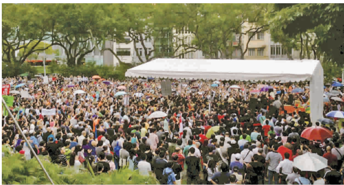
新加坡因應少子化，擴大邀請新公民。

在引進來人口時，能保有一定的調控彈性。然而，官方也強調，此一政策將審慎推動，特別是在族群比例上維持平衡，以避免人口結構劇烈變動對社會認同造成衝擊。 目前新加坡人口以華人爲主，約占總人口四分之三，其餘則爲馬來人、印度人等多元族群。如何在引入新移民的同時，維持既有社會的穩定與凝聚力，是政策推動的一大關鍵挑戰。過度依賴移民，可能引發文化摩擦與認同問題；但若完全不引入新血，則將面臨勞動力不足與經濟成長停滯的風險。 從新加坡的經驗來看，少子化已不再是單一國家的問題，而是一場席捲全球的結構性轉變。對於同樣面臨低生育率的台灣而言，這樣的發展更具參考價值。當補貼政策效果有限時，是否應進一步檢視職場環境、居住正義與生活壓力？當人口自然成長難以維持時，是否也需重新思考移民政策的角色？ 總體而言，新加坡正在兩條路徑之間尋求平衡：一方面努力讓人民「願意生」，另一方面務實地引入「外來人口」。這不僅是一項人口政策的調整，更是一場關於國家未來樣貌的選擇。在少子化成爲常態的時代，如何在人口、經濟與社會認同之間取得平衡，將是所有國家無可迴避的課題。