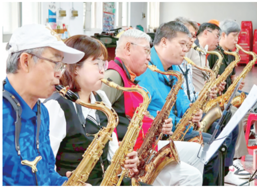
來自新北市的「樹林薩克斯風樂團」，將攜手金門在地「金響亮樂團」，於4月10日及11日舉辦兩場公益音樂會。

記者陳冠霖／綜合報導 一場跨越海峽、串聯城市與離島情誼的音樂交流活動，即將在金門溫暖登場。來自新北市的「樹林薩克斯風樂團」，將攜手金門在地「金響亮樂團」，於4月10日及11日舉辦兩場公益音樂會，以薩克斯風為媒介，傳遞音樂與關懷交織的動人力量。此次活動不僅象徵兩地音樂文化的交流，更展現民間自發推動公益、以樂服務社會的深厚能量。 「樹林薩克斯風樂團」自成立以來，長期於