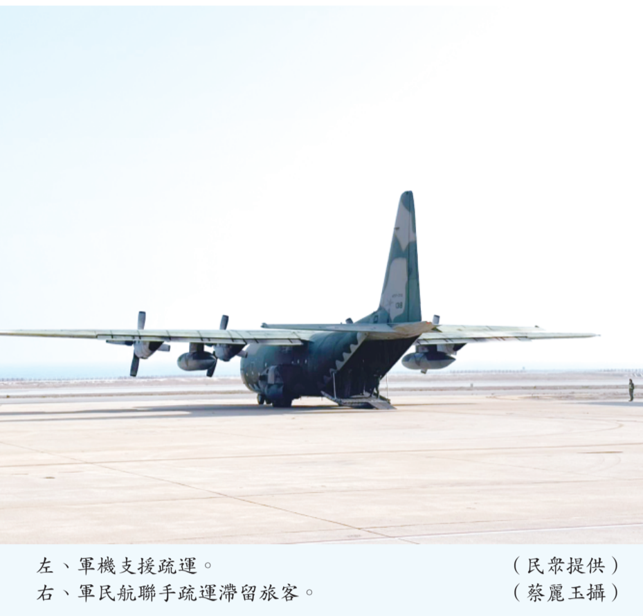
左、軍機支援疏運。 右、軍民航聯手疏運滯留旅客。