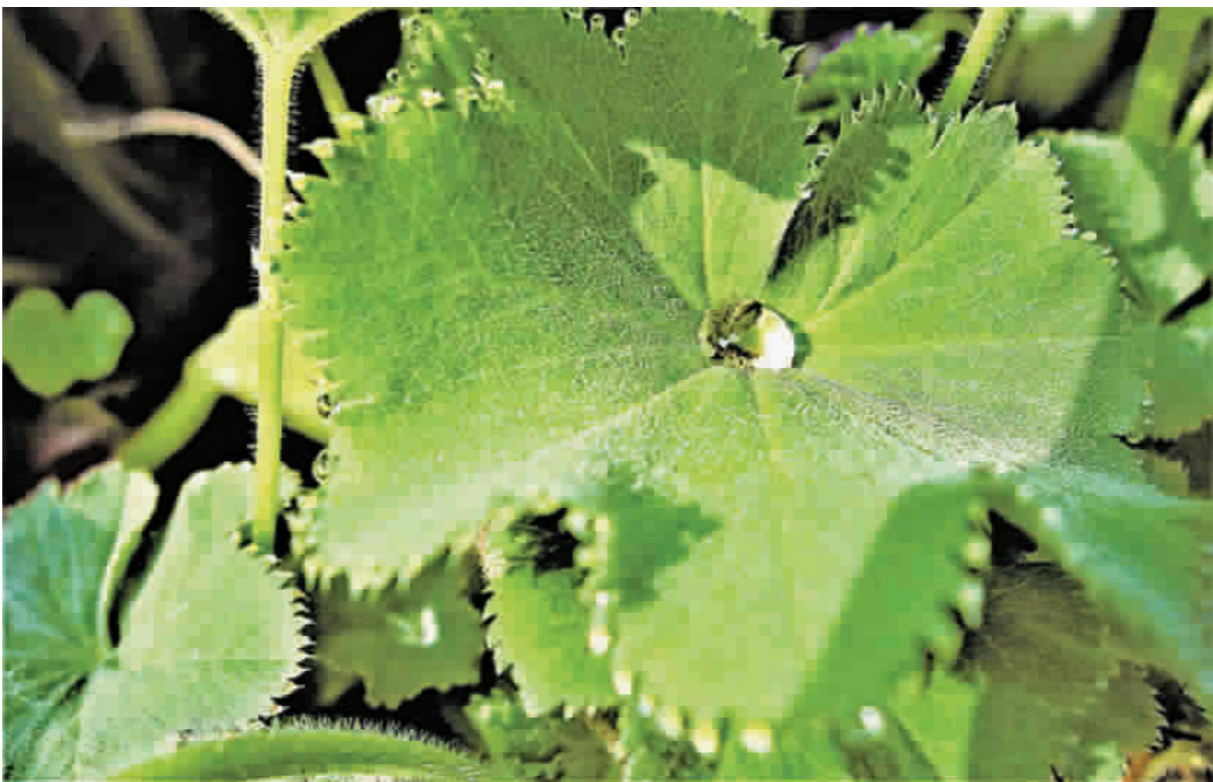
頗有侘寂美的晨露，圓潤欲滴。