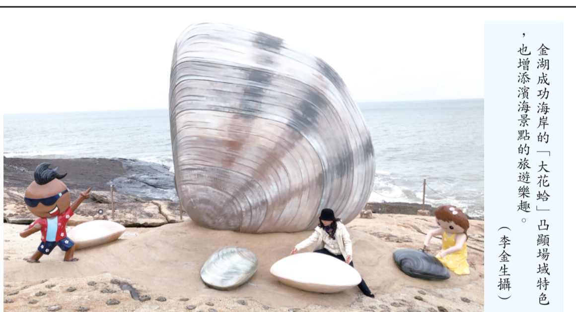
金湖成功海岸的「大花蛤」凸顯場域特色，也增添濱海景點的旅遊樂趣。