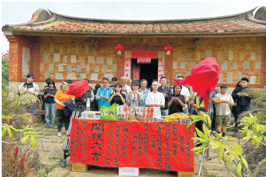
公視人生劇場最新作品《白鷺鷥其實是黑色怪物》在金城鎮後豐港「洪喧古厝」舉行金門開鏡儀式。