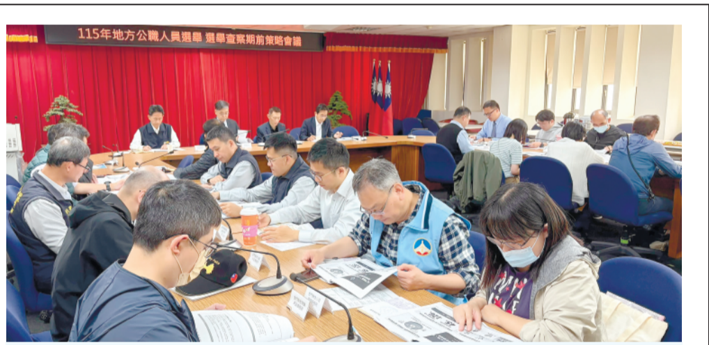
金門地檢署召開115年地方公職人員選舉查察期前策略會議。

記者莊煥寧／金城報導 為維護選舉公平公正、打造乾淨選風，金門地區已提前啟動查察期前策略會議。金門地檢署昨(10)日上午在該署大禮堂召開「115年地方公職人員選舉查察期前策略會議」，廣邀各查察機關齊聚一堂，透過整合資源與偵查部署，確立「情資共享、即時反應、同步偵辦」三大核心目標，全面強化選舉查察能力。 金門地區因地理環境相對封閉，人口結構緊密，地方人際關係及宗族網絡深厚，使得選舉期間查察工作更具挑戰性。為因應此一特殊情勢，金門地檢署提前規劃，整合地檢署、調查局、警察局、憲兵隊及移民署專勤隊，並結合金門縣政府政風處、民政處及各鄉鎮戶政事務所等單位，建立橫向聯繫與縱向指揮並行之合作機制，力求在選舉關鍵時刻發揮整體查察效益。 趙燕利於會中指示地檢署統籌檢 該會議由金門地檢署檢察長趙燕利主持，福建高等檢察署金門檢察分署檢察長毛有增列席指導，以及金門縣警察局副局長蘇有義、法務部調查局福建省調查處簡任秘書蔡鑫魁等人出席。另包括移民署金門縣專勤隊、金門憲兵隊、金門縣警察局刑事警察大隊及各分局、縣府相關單位與各戶政事務所派員與會，展現跨機關通力合作的決心。 會中，各單位針對轄內選情分析、地方民情動態及潛在賄選風險區域進行專題報告，並就查察策略進行深入討論。會議重點涵蓋多元作法，包括金錢賄買、招待旅遊與餐館、補助機票、暴力介入、地下賭盤監控、幽靈人口設籍、假訊息散布，以及境外敵對勢力干預選舉等議題，藉由事前盤點與情資整合，提升整體查察進度與應變能力。 此外，針對投票日前後可能出現之各類突發狀況，會中亦就選舉維安工作進行預為想定與分工，確保選舉期間社會秩序穩定，防杜暴力與不法介入，讓選舉在安全無虞的環境下順利進行。 金門地檢署強調，選舉查察不僅是執法機關的職責，更是守護民主制度的重要防線。未來將持續結合各機關力量，秉持專業、積極與合作精神，落實各項查察與宣導措施，共同維護金門地區良善選風，確保選舉過程公平、公正，讓民主價值得以穩健深化。