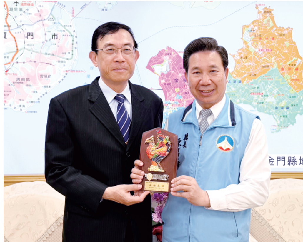
最高檢察署檢察總長邢泰釗拜會縣長陳福海，強化司法與治理交流。

此外，對於獲選卻無故未參與賽事之球員，亦訂有相關規範，除須檢附醫療或正當證明文件外，若無故缺席，將處以兩年內不得參加本會主辦、承辦賽事之處分，以維護團隊紀律與賽事公平性。 本次遴選委員會由主任委員、教練團、執行副主委、總幹事及技術顧問等推派五人組成，負責整體選才作業，任期至當年度賽事結束為止。監委會強調，委員會當年度將將秉著專業性與公正性，並由主任委員召集相關幹部及專家學者共同推舉，以確保甄選程序周延嚴謹。 金門體育會表示，本辦法已完成內部會議審議，並送交金門縣政府及體育會備查後實施。公告後一週內如有相關建議或不同意見，歡迎向金門體育會反映，逾期將視同無異議。期盼透過公開透明的選拔制度，廣納優秀籃球人才，共同為金門在全國及離島賽事中再創佳績。