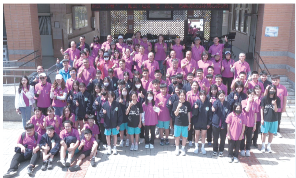
「重返上林」走讀。

記者許加泰／綜合報導 烈嶼國中在六十週年校慶前夕舉辦「重返上林」走讀巡迴，由第一屆畢業生學長姐親自帶領學弟妹一同走回創校初期的上林舊址，跨世代對話。 一甲子歲月的跨世代對話：烈嶼國中「重返上林」走讀巡迴，由第一屆畢業生學長姐親自帶領學弟妹一同走回創校初期的上林舊址，跨世代對話。 烈嶼國中在六十週年校慶前夕舉辦「重返上林」走讀巡迴，由第一屆畢業生學長姐親自帶領學弟妹一同走回創校初期的上林舊址，跨世代對話。 烈嶼國中在六十週年校慶前夕舉辦「重返上林」走讀巡迴，由第一屆畢業生學長姐親自帶領學弟妹一同走回創校初期的上林舊址，跨世代對話。