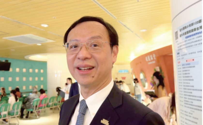
寵物用人藥新制因爭議多暫緩，衛福部長石崇良11日說，主要考量基層獸醫院普遍缺乏24小時藥局支援，不宜貿然上路。(中央社)

【中央社記者沈佩瑤台北11日電】尚未上路的寵物用人藥新制因爭議多暫緩，衛福部部長石崇良11日說，主要考量基層獸醫院普遍缺乏24小時藥局支援，不宜貿然上路。 這項新制引起反彈聲浪，包括登錄進度落後、變通方式沒有考慮夜間及緊急需求等，昨天在農委會召開的研商會議中，面對與會者要明確確結果，農委會次長杜文珍喊出「舉手表決吧！」通過新制暫緩。 對於新制暫緩，石崇良上午出席「台大醫院小兒部120周年演講暨健康台灣論壇」活動時表示，主要是考量基層獸醫院普遍缺乏24小時藥局支援，會持續跟農委會合作，討論如何儘快完善。 石崇良解釋，相較於人用藥品有健保系統可完整追蹤藥品流向，目前動物用人藥新制因爭議多暫緩，衛福部長石崇良11日說，主要考量基層獸醫院普遍缺乏24小時藥局支援，不宜貿然上路。(中央社) 前動物使用端尚缺乏這樣的系統，雖然管理辦法的初衷，是依據動物法授權來彌補流向管理不足，不是為了所謂的醫藥體系，但現行獸醫醫療體系並不像人類醫院擁有完善的24小時急診與藥劑部門，藥品可近性相對不足，若新制上路，恐讓半夜急需的寵物面臨無藥可用的困境。 至於暫緩期間會不會產生「流向黑洞」，石崇良表示，衛福部正與農委會積極溝通。昨天藥界提出方案之一，是參考人類醫院的一病房常備藥「模式」，醫院急診或加護病房內，皆有常備急救藥品，未來獸醫診所或可採類似配套，在兼顧藥品流向透明度的同時，確保動物生命權優先。 針對動物相關團體提出將「正面表列」(僅限清單內加種人藥可用於寵物)改為「負面表列」(除了禁用藥外皆可可用)的訴求，石崇良認為「也不是不行」，只是現行「動物保護法」精神是以正面表列補足動物用藥不足，若全面放寬為負面表列，涉及及法規的調整之外，恐排擠廠商開發「動物專用藥品」的意願，必須衡平討論。