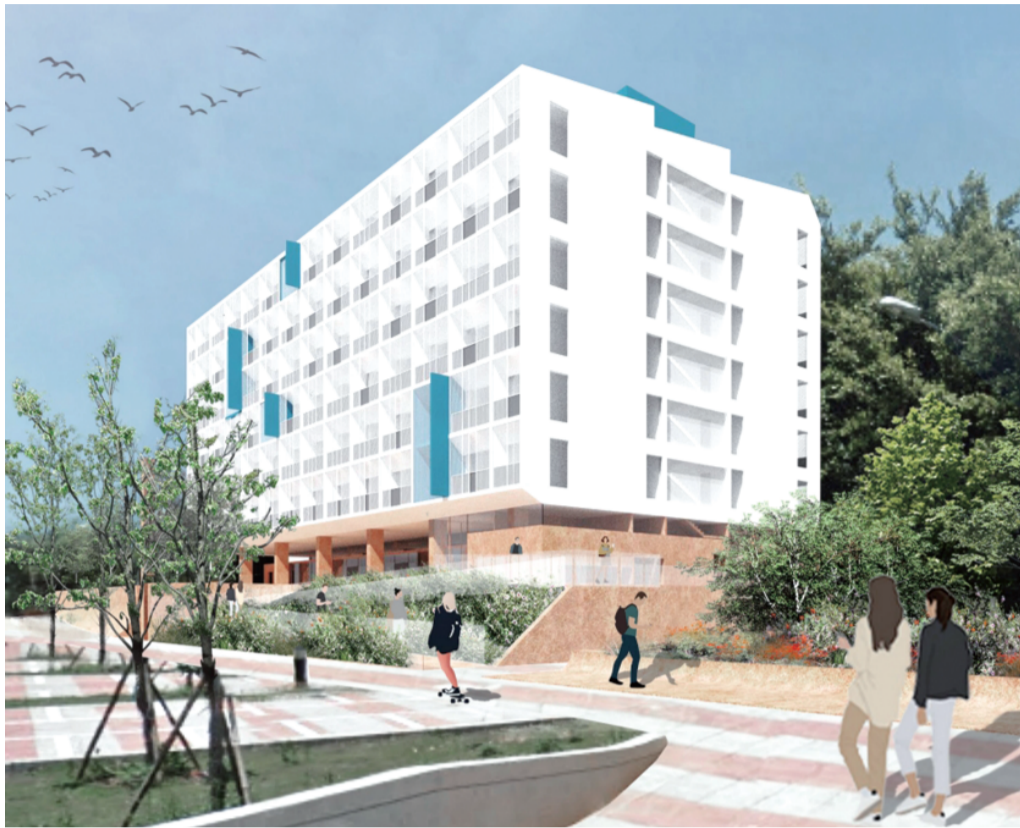
「黃金級綠建築」學生宿舍設計圖。

以黃金級綠建築標章為目標規劃學生三舍 金大由財政部代為發行綠色中央政府公債 金額4億元