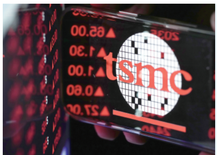
為滿足AI應用強勁需求，台積電加速投資、提升3奈米產能，董事長暨總裁魏哲家16日指出，將在南科、美國及日本新增3奈米製程產線，並將台灣5奈米設備轉換生產3奈米。

這名美方官員說：「他們一直在通話，透過秘密管道與各相關國家聯繫，距離達成協議愈來愈近。」 美方官員與熟悉調停過程的消息人士透露，若達成協議，就必須延長停火，以便談判完整協議的細節。 華盛頓郵報則指出，五角大廈向中東增援的部隊將在4月底前陸續抵中，如果美伊間脆弱的停火破裂，美軍有可能重新展開更多空襲甚至地面行動。 美方現、前任官員們表示，派赴波斯灣的增援部隊包括布希號（USS George H.W. Bush）、航艦打擊艦隊（600名官兵）；另外，由兩艘攻擊艦「拳師號」（USS Boxer）及「塔拉西姆號」（USS Tarasim）搭載第11陸戰隊遠征隊組成的兩棲待命支援隊約500名官兵預計月底抵中。 美軍當前正在執行對荷莫茲海峽（Strait of Hormuz）的海上封鎖。預計兩支援隊抵達後，美軍對付伊朗的兵力將超過5萬。 2名知情官員表示，布希號航艦14日已接近南非的好望角，別於以往改採繞過非洲大陸南端航線前往中東；而由3艘艦艇組成的拳師號兩棲待命支援隊，上週已自夏威夷出發，目前距離中東還有約2週航程。 拳師號兩棲待命支援隊第11陸戰隊遠征隊一個約800人的步兵營，以及直升機與登陸艇。之前第31陸戰隊遠征隊已於3月底自沖繩抵達中東。 官員表示，美方討論過多種情境，包括發動複雜的特种作戰奪取伊朗濃縮鈾、派遣海軍陸戰隊沿沿海地區和島嶼以保護海峽，以及奪取位於波斯灣的伊朗石油出口樞紐哈格島（Kang Island）。 曾於川普第一任時任職五角大廈的退役陸戰隊中情局官員穆羅伊（Mark Mulroy）表示，對美軍而言，執行長期封鎖是「極其艱鉅的任務」，但風險都不及任何地面行動。