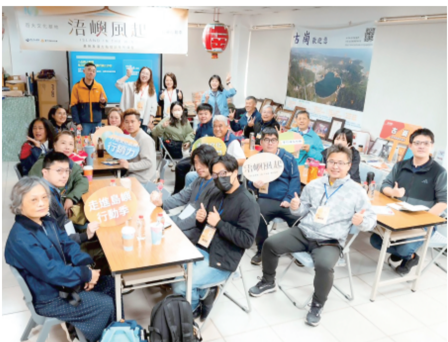
文化局辦理金門文化基地潛力點培力課程，現場交流熱絡。

記者蔡麗玉／金城報導 「以運算思維跨越海峽，用創意程式驚豔全國！」114學年度全國貓咪盃競賽日前於臺東盛大登場，來自全國各地的資訊菁英齊聚一堂，展開一場融合邏輯思維與創意應用的精彩對決。金門代表隊不畏長途跋涉，跨海參賽，在高手雲集的競技舞台上穩健發揮，最終傳來捷報，為家鄉再添榮耀。這回榮獲銀牌，寫下金門盃開辦以來，金門縣代表隊在國中組的最佳成績紀錄，展現出學生卓越的資訊素養與團隊實力。