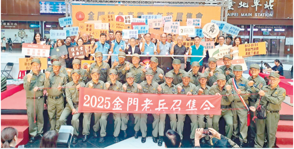
2025年活動人潮不斷，金門品牌成功打入臺北市場。(產業發展處提供)

記者陳冠霖／縣府報導 由金門縣政府產業發展處主辦的「金門特色產業嘉年華」，將於15年7月2日至7月5日於臺北車站活動多功場展區盛大登場。這將是該活動第4度進駐臺北車站。現場將集結金門在地最具代表性的創意生活商品、文化工藝、在地美食及特色食品，展現金門多元且豐富的產業能量，預計吸引來自全島及海外旅客共襄盛舉。 產業發展處表示，臺北車站為全台灣重要交通樞紐，每日人流量高達60萬人次，是推廣地方特色產業的黃金據點。透過此次展售活動，除可有效提升金門品牌能見度，更有助於拓展市場通路、創造實質商機，進一步提升在地產業競爭力，讓金門優質商品走向更廣大的市場。 此次活動預計招募30個特色攤位，即日起開放報名至4月24日下午4時截止，招商對象不限於曾參與縣府輔導計畫之業者，凡具公司、商業或稅籍登記，且產品具在地特色者皆可報名參加，展出類型包含特色食品、文創商品、文化工藝、在地美食及休憩服務等多元項目。 產業發展處說明，此次參展免收攤位費用，惟入選業者須提供等值新臺幣2000元以上商品，配合主辦單位整體行銷活動使用，並須參與現場統一促銷機制。報名方式請至該計畫官方網站「金門美食讚」(https://www.kinmengourmet.com.tw/)下載招商簡章(路徑：首頁/資料下載)，並於期限內填妥報名資料，至「金門美食讚」送件申請專區完成線上報名。 入選名單將公告於官網，並以信件通知入選廠商，實際攤位位置將由主辦單位統一規劃安排。產業發展處誠摯邀請金門在地業者把握機會，將最具特色與創意的產品帶進人潮匯聚的臺北車站，直接面對全台灣甚至國際旅客，拓展品牌影響力。 相關資訊請至金門縣政府產業發展處及金門美食讚網站查詢，若有相關疑問請於上班時間(週一至週五上午8時至12時、下午1時30分至5時30分)來電，聯絡人為財團法人中衛發展中心陳先生，電話：02-2391-1368分機829、0922-167293。