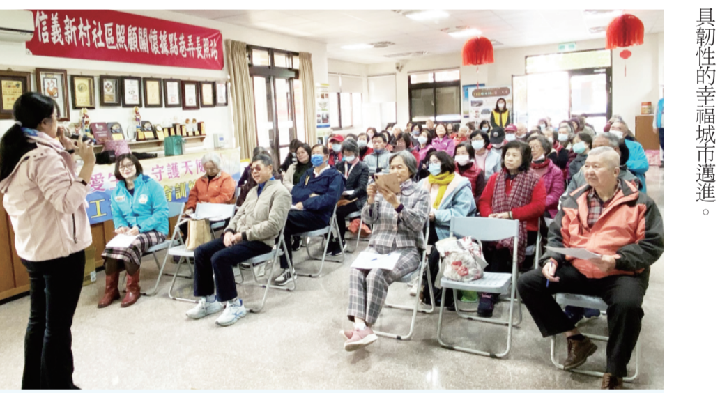
金門縣政府舉辦「珍愛生命 守護天使」志工在職教育訓練。

記者陳冠霖／縣府報導 金門縣政府為健全社區支持系統，強化心理康復功能，持續推動自殺防治與生命教育工作，透過系統化培訓與跨單位合作，建構更具韌性的在地關懷網絡。其中，「珍愛生命 守護天使」志工在職教育訓練，即為重要推動措施之一。期望藉由專業課程的導入，培養志工成為具備觀察力與即時應對能力的守護天使，在第一線協助發現與關懷潛在風險個案，落實預防重於治療的核心理念。 該項訓練由金門縣志願服務推廣中心辦理，於金湖社會福利大樓舉行，課程以「自殺防治與憂鬱認識」為主軸，邀請專業人員擔任講師，針對本縣社會福利、志願服務、公所、公辦、公營、承辦人及主管等進行培訓，吸引眾多第一線服務人員參與。透過集中授課與互動交流方式，強化志工對心理健康議題的認識，提升整體志願服務體系在自殺防治工作上的專業能量與實務應用能力。 課程內容從整體社會心理健康現況切入，深入解析憂鬱情緒的多元表現與常見心理困擾型態，並強調情緒察覺與自我理解的重要性。講師透過案例分享與實務經驗，說明在日常生活及志願服務過程中，如何辨識潛在的高風險訊號，包括情緒低落、行為改變或言語暗示等，協助學員建立早期發現的能力。同時引導志工以同理心與正向態度進行關懷，透過傾聽與陪伴，提供穩定的情緒支持，讓服務對象在關鍵時刻能感受到被理解與接納。 在實務操作層面，課程特別強調「一問、二應、三轉介」的守門人三步驟，協助志工在面對疑似高風險個案時，有明確且可行的應對方向。「一問」即主動關懷並適切詢問對方狀況；「二應」則是在必要時，協助連結專業醫療或社福資源，確保個案獲得持續且適當的協助。透過這樣的系統化學習，使志工在第一線服務時更具信心與能力，進一步強化社區安全網的即時反應機制。 金門縣政府社會處處長王茲總表示，志工長期深耕各鄉鎮社區，是縣府推動各項社會福利與心理健康工作的關鍵力量，尤其在自殺防治體系中，更扮演著最貼近民衆的重要角色。透過持續辦理專業訓練，能協助志工提升觀察與判斷能力，