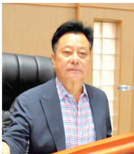
記者許峻魁／議會報導