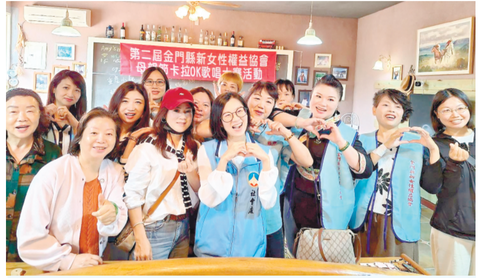
新女性權益協會母親節歌唱聯誼活動。

記者蔡麗玉／金城報導 在母親節即將到來之際，金門縣新女性權益協會舉辦第二屆母親節卡拉OK聯誼餐會，讓來自各地的女性會員齊聚一堂，在歌聲與笑聲中交流情感，也共同見證彼此在金門落地生根的生命故事。