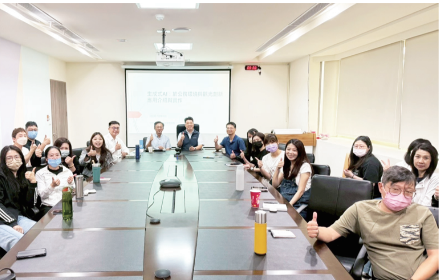
金門縣政府辦理「推動『禮貌金門』暨『生成式AI公部門實務應用』研習」。

記者莊煥寧／金城報導 為提升油品貯存系統管理品質，降低土壤及地下水污染風險，金門縣環保局日前舉辦「貯存系統法規宣講說明會」暨「114年度貯存系統評鑑分級評比頒獎活動」，由環保局長楊建立頒發獎狀表揚在自主管理與污染防治工作表現優異的業者，肯定其長期投入環境保護與永續經營的努力。 環保局指出，油品貯存系統因涉及燃油、柴油等高污染潛勢物質，一旦設備老舊、管線滲漏或管理不當，容易造成土壤及地下水污染，不僅危害自然環境，還可能衝擊民眾生活與公共健康。因此，環保局持續推動貯存系統管理與查核機制，除定期稽查業者申報資料、辦理現場設施檢查外，同時透過「分級評鑑制度」鼓勵業者落實自主管理，提升設備維護與污染預防能力。 今年度評鑑結果，共有23家業者榮獲「特優級」肯定，另有5家業者獲評「優良級」，展現金門地區業者對環境保護與法規遵循的高度重視。 在「地下貯存系統組」方面，獲得特優級的共有9家，包括小金加油站、金寧加油站、金民加油站、沙美加油站、金門加油站、大立鴻福加油站、統一精工金門加油站及烈嶼加油站等業者，均在設備維護、巡檢管理與污染防治措施上表現優異。 「地上貯存系統組」部分，榮獲特優級的14家單位包括金門縣動植物防疫所、台灣中油股份有限公司油品行銷事業部高雄營業處金馬行銷中心、台灣電力股份有限公司塔山發電廠(含復興分廠)、金湖大飯店、敬富企業社、金門酒廠實業股份有限公司(金城廠、金寧廠)、風獅爺購物廣場、昇恆昌免稅廣場、金門區漁會，以及中華電信股份有限公司金中、金湖與烈嶼機房等。 另外，獲評優良級的5家業者，則包括金門皇家酒廠股份有限公司、台灣電力股份有限公司塔山發電廠、陸軍金門防衛指揮部夏興D營區，以及中華電信股份有限公司金中與金城機房。 楊建立表示，土壤與地下水是珍貴且難以復原的重要環境資源，污染防治工作必須從源頭管理做起。透過貯存系統評鑑制度，不僅能提升業者自主巡檢與設備管理意識，也能有效降低污染事件發生風險，避免後續高成本與環境破壞。 環保局強調，未來將持續透過宣講、技術輔導及查核管理等方式，協助業者精進污染防治能力，並鼓勵更多事業單位共同投入環境保護工作，攜手守護金門珍貴的土壤與地下水資源，打造兼顧經濟發展與環境永續的宜居島嶼。