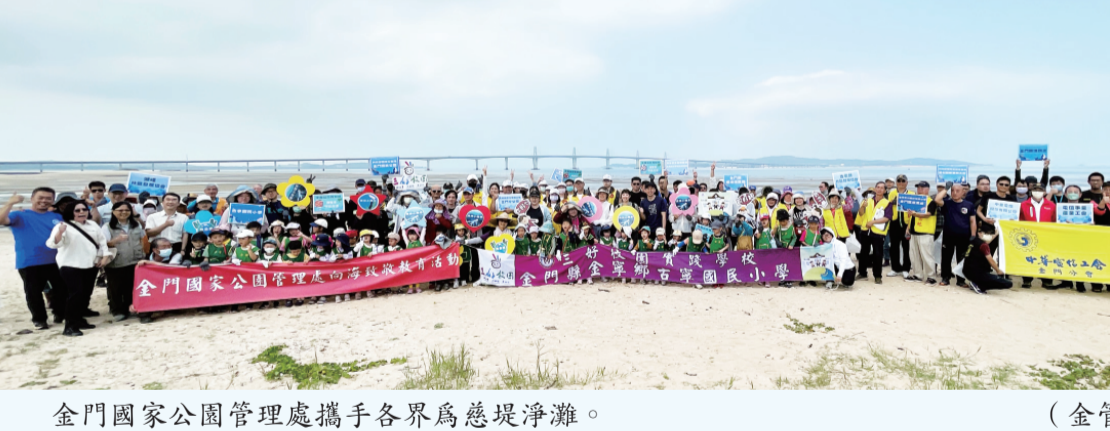
金門國家公園管理處攜手各界為慈堤淨灘。