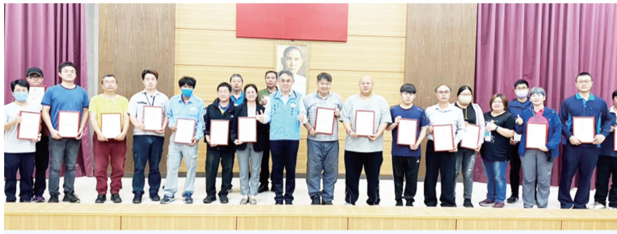
環保局長楊建立頒發獎狀給優良貯存系統業者。

記者莊煥寧／金城報導 為提升油品貯存系統管理品質，降低土壤及地下水污染風險，金門縣環保局日前舉辦「貯存系統法規宣講說明會」暨「114年度貯存系統評鑑分級評比頒獎活動」，由環保局長楊建立頒發獎狀表揚在自主管理與污染防治工作表現優異的業者，肯定其長期投入環境保護與永續經營的努力。 環保局指出，油品貯存系統因涉及燃油、柴油等高污染潛勢物質，一旦設備老舊、管線滲漏或管理不當，容易造成土壤及地下水污染，不僅危害自然環境，還可能衝擊民眾生活與公共健康。因此，環保局持續推動貯存系統管理與查核機制，除定期稽查業者申報資料、辦理現場設施檢查外，同時透過「分級評鑑制度」鼓勵業者落實自主管理，提升設備維護與污染預防能力。 今年度評鑑結果，共有23家業者榮獲「特優級」肯定，另有5家業者獲評「優良級」，展現金門地區業者對環境保護與法規遵循的高度重視。 在「地下貯存系統組」方面，獲得特優級的共有9家，包括小金加油站、金寧加油站、金民加油站、沙美加油站、金門加油站、大立鴻福加油站、統一精工金門加油站及烈嶼加油站等業者，均在設備維護、巡檢管理與污染防治措施上表現優異。 「地上貯存系統組」部分，榮獲特優級的14家單位包括金門縣動植物防疫所、台灣中油股份有限公司油品行銷事業部高雄營業處金馬行銷中心、台灣電力股份有限公司塔山發電廠(含復興分廠)、金湖大飯店、敬富企業社、金門酒廠實業股份有限公司(金城廠、金寧廠)、風獅爺購物廣場、昇恆昌免稅廣場、金門區漁會，以及中華電信股份有限公司金中、金湖與烈嶼機房等。 另外，獲評優良級的5家業者，則包括金門皇家酒廠股份有限公司、台灣電力股份有限公司塔山發電廠、陸軍金門防衛指揮部夏興D營區，以及中華電信股份有限公司金中與金城機房。 楊建立表示，土壤與地下水是珍貴且難以復原的重要環境資源，污染防治工作必須從源頭管理做起。透過貯存系統評鑑制度，不僅能提升業者自主巡檢與設備管理意識，也能有效降低污染事件發生風險，避免後續高成本與環境破壞。 環保局強調，未來將持續透過宣講、技術輔導及查核管理等方式，協助業者精進污染防治能力，並鼓勵更多事業單位共同投入環境保護工作，攜手守護金門珍貴的土壤與地下水資源，打造兼顧經濟發展與環境永續的宜居島嶼。