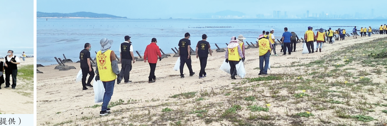
金門國家公園管理處攜手各界為慈堤淨灘。

金門管處承諾未來將持續推動相關環境教育及海洋保育行動，攜手各界共同邁向聯合國永續發展目標(SDG)第14項「保育海洋生態」及第17項「多元夥伴關係」，為下一代留下潔淨且永續的自然環境。