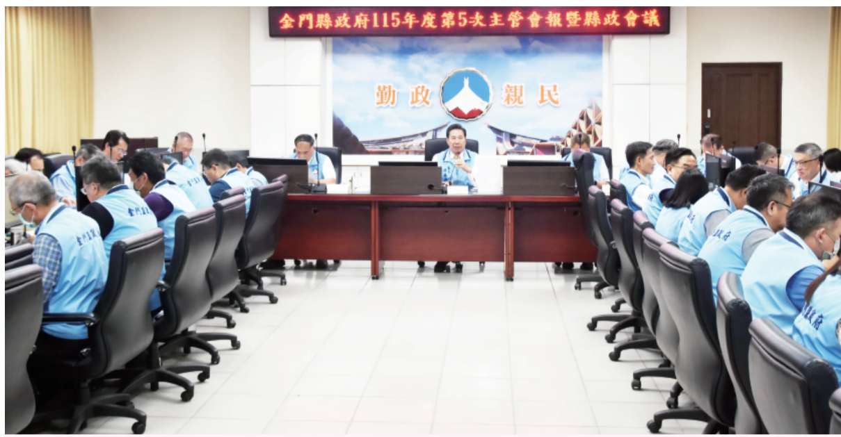
金門縣政府召開115年第5次主管會報暨縣政會議，由縣長陳福海主持。

縣府團隊必須突破既有思維，提升行政效率與治理格局。他強調，「越怕麻煩，麻煩越大」，所有政策都應從長遠角度出發，思考如何為金門奠定可持續發展至100年的發展基礎。他提醒同仁，工作繁忙之餘仍須重視健康，「唯有照顧好自己，才能照顧鄉親」，期盼打造兼具效率與溫度的行政團隊。 建立完整微電車管理機制 隨著小三通旅客增加，微電車二輪車衍生的交通問題成為會議焦點。觀光處指出，今年五一連假期間，已針對入境的6,500名陸客加強交通安全宣導，並在水頭碼頭設置一站式服務櫃檯，透過發放指引卡與播放宣