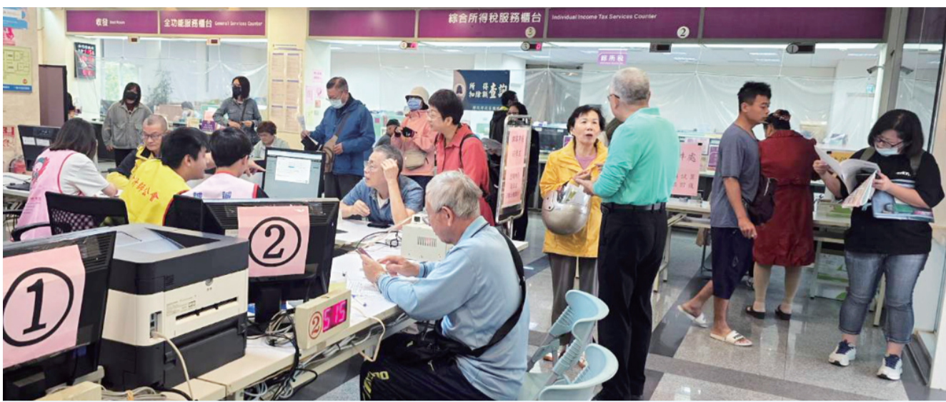
今年報稅時間到六月一日為止。