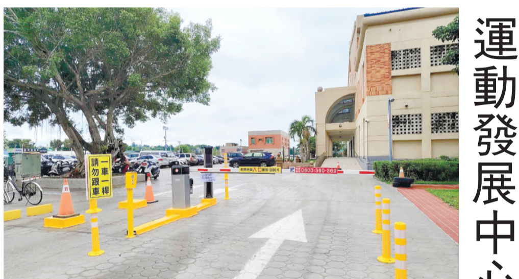
停車場規劃有入口、出口、自動繳費機等，提醒車主依規定使用。

記者莊煥寧／綜合報導 為提升民眾停車便利性，金門縣運動發展中心停車場自6月1日起正式收費後，將採平日與假日一致收費標準，車輛停放前1小時免費，第2小時起每小時收費20元，單日最高收費上限為150元，兼顧民眾短時停車與長時使用需求。 此外，停車場也提供月租方案，一般月租費為每月1,200元；若採季繳方式，則可享受惠價格每季3,600元，提供更完善的運動與休閒空間，提供鄉親更優質、安全且便利的公共服務環境。 運動發展中心表示，未來將持續優化場館設施與服務品質，打造更完善的運動與休閒空間，提供鄉親更優質、安全且便利的公共服務環境。