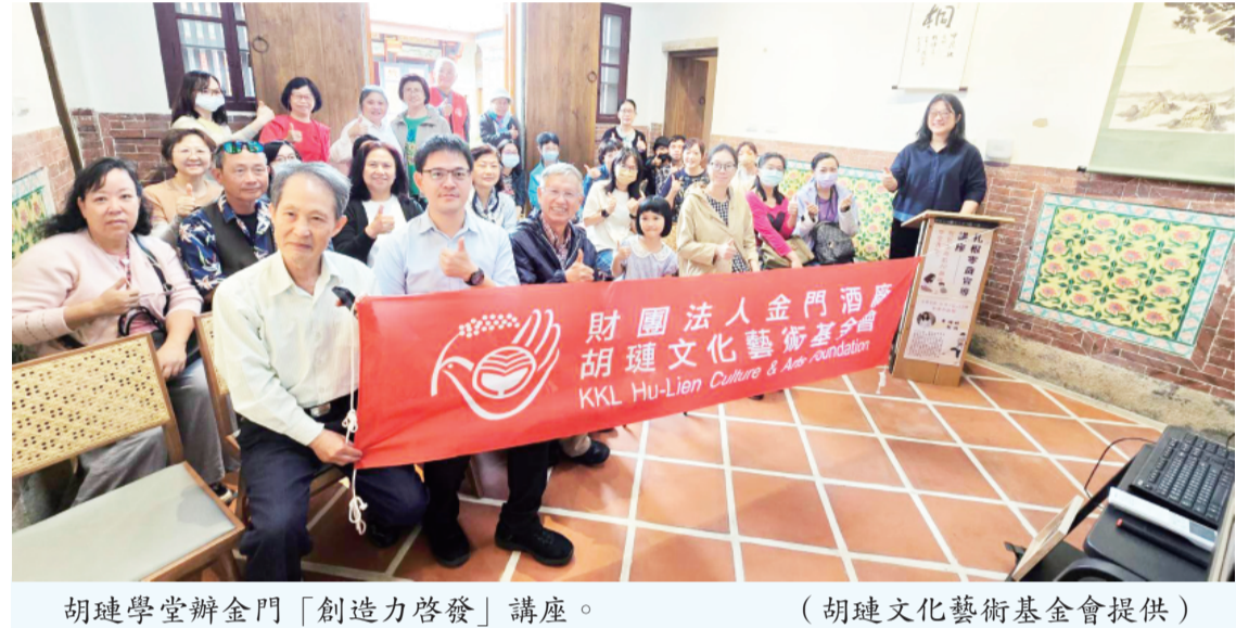
胡璉學堂辦金門「創造力啟發」講座。

記者蔡麗玉/綜合報導 財團法人金門酒樓文化藝術基金會日前於金湖鎮塔后22「胡璉學堂」舉辦「創造力啟發」專題講座，邀請黃揚婷教授親臨分享，吸引不少家長、教育工作者及關心幼兒教育民衆到場參與；講座內容從腦科學、幼兒發展、創造思考教育，一路延伸至AI時代的人才能力需求，帶領與會者重新思考未來教育方向。 在AI快速改變世界的今日，「未來孩子最需具備什麼能力？」成爲教育界與家長共同關注的重要課題，長期投入幼兒教育研究的黃揚婷教授，日前分享其於北京大學幼兒園進行的「問想做評(AIDE)」創造力教學實驗成果，顯示透過系統化教學，幼兒創造力可被有效培養，引發教育界高度關注。 研究採實驗組與對照組方式進行，實驗組幼兒接受金門「扎根零歲創造力教育」所推動的AIDE教學模式，即「問(Ask)、想(Think)、做(Do)、評(Evaluate)」四步驟創造力啟發課程，並持續進行12週；對照組則維持一般幼兒園傳統教學。研究結果顯示，接受AIDE教學的幼兒，在「創造性思維圖形測驗」中的表現明顯提升，創造力分數從9.32大幅提升至12.8179，展現創造力教育並非抽象概念，而是可透過有系統的方法逐步培養的重要能力。 胡璉文化藝術基金會董事長陳龍安表示：AI時代最不容易被取代的能力，不再只是背誦知識，而是創造力、提問力、判斷力與解決問題能力，若能從0歲開始，透過家庭與教育環境持續培養孩子的創造力，將成爲面對未來世界的重要基礎。 陳龍安進一步表示，基金會近年積極配合金門縣政府推動「扎根零歲教育」，並結合其長年倡導的創造思考教育理念，希望讓創造力教育從幼兒階段開始扎根。他認爲，創造力並非少數天才的專利，而是每一位孩子都值得被啟發的重要能力；教育真正的責任，也不只是