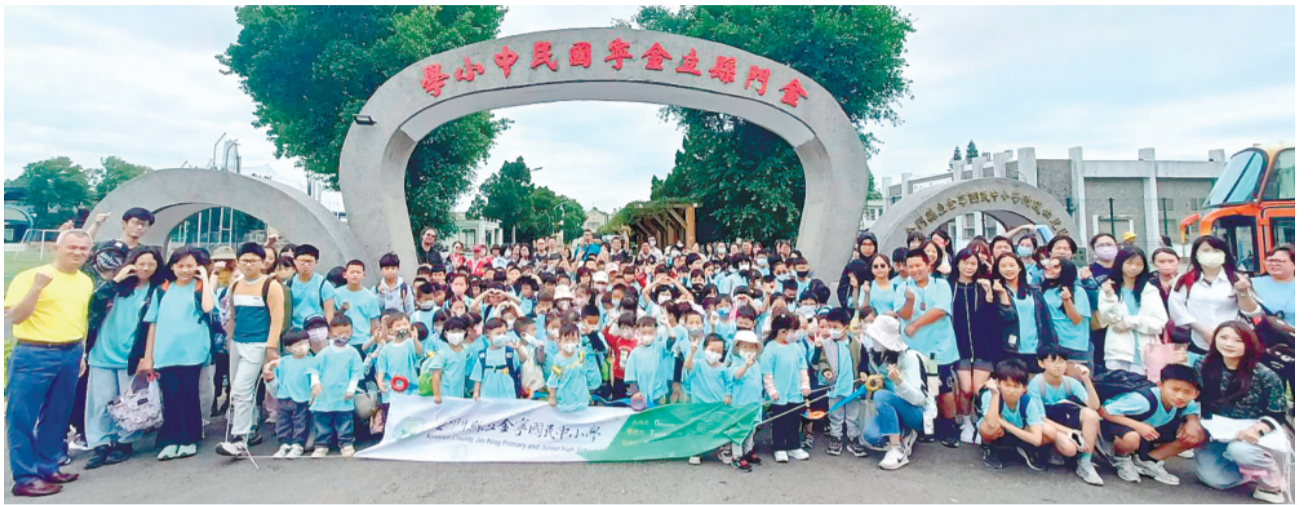
金寧中小學辦理親子共學春遊趣活動，親師生合計約300人參與，展現家長對學校活動的大力支持。