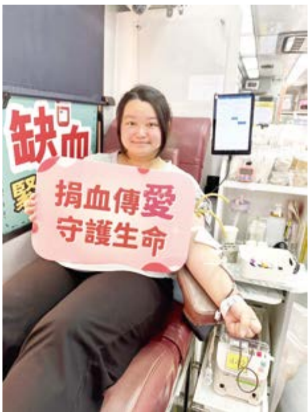
金大師生熱情響應「捐血傳愛金門之愛」巡迴捐血活動。

國立金門大學響應金門縣政府與臺北捐血中心合作辦理「捐血傳愛金門之愛」巡迴捐血活動，於學生會堂舉辦「我年輕，我捐血」公益捐血活動，校園內充滿熱血與愛心的師生踴躍參與，熱情擁護，以實際行動支援醫療體系，為血庫注入一股暖流。此次捐血活動為確保每一位捐血者的身體狀況及受贈者的用血安全，臺北捐血中心專業醫護團隊全程在場，提供精準的健康評估與衛教宣導，讓整個流程在專業且順暢的環境下進行。