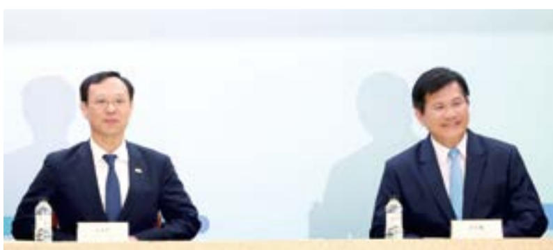
第79屆世界衛生大會(WHA)將於瑞士日內瓦登場，外交部規劃於WHA期間在日內瓦辦理首屆「WHA台灣智慧醫療與健康產業展」，衛福部長石崇良(左)、外交部長林佳龍(右)11日出席行前記者會說明。(中央社)

【中央社記者游凱翔台北11日電】世界衛生大會(WHA)18日登場，衛福部長石崇良今天表示，雖然台灣至今尚未收到正式邀請函，但面對人口老化、新型傳染病及抗藥性等全球挑戰，台灣不應缺席且更要積極參與，因此他將率團赴日內瓦舉辦4場論壇，具體呈現 Taiwan can help 的重要角色。 至於外交部長林佳龍是否會隨團前往日內瓦，林佳龍說，有在規劃中，確定後再向外界報告。 外交部下午舉行「2023年世界衛生大會(WHA)推展及「台灣智慧醫療與健康產業展」雙部長行前記者會」，外交部長林佳龍、衛福部長石崇良、產業部長暨馬偕紀念醫院院長張文瀚等人出席。 石崇良致詞表示，很可惜，到目前為止台灣仍未收到正式邀請函；當全球面臨這麼多的威脅挑戰，包括人口老化、慢性傳染病、新型傳染病威脅、抗生素抗藥性等情況下，台灣不應該缺席且更要積極參與，因此他會率領重要角色。