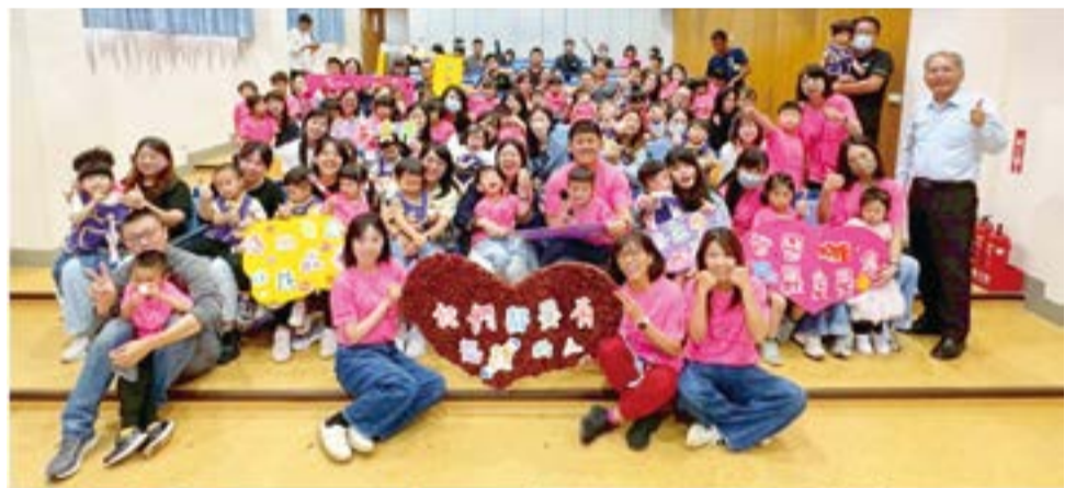
述美國小幼兒園辦理「慶祝母親節活動—向母親表達敬意」活動。