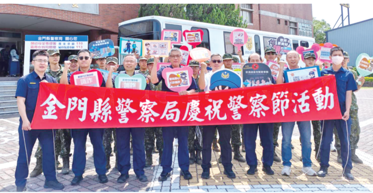
金門縣警察局響應捐血活動。