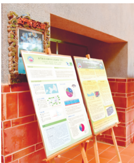
金門國家公園管理處辦理「114年度保育研究成果發表會」。

記者蔡麗玉／金寧報導 金門國家公園管理處昨(12)日於中山林遊客中心舉辦「114年度保育研究會」，邀請約百位地方民眾、志工及相關人員參與，並同步透過YouTube直播，展示年度保育調查與研究結果。此次共發表四項重要研究，包括關於水獺與棲地生態服務給付、中山林生態資源調查、植物物候調查，以及歐亞水獺食性生態調查，展現金門國家公園在生態保育與永續經營上的豐碩成果。 金管處表示，透過長期調查與跨領域研究，有助於掌握金門生態環境變化，也能作為未來保育政策與棲地管理的重要依據，進一步提升地方居民對自然環境的認識與參與。其中，「金門國家公園關注物種及棲地生態服務給付策略規劃」研究，以慈湖濕地周邊私有魚塢為示範區，導入在地可行的生態服務給付策略。研究指出，慈湖是金門重要的水鳥中繼站，同時也是歐亞水獺、鸕鶿及栗喉蜂虎的重要棲地，周邊低度利用魚塢具高度自然修復潛力。研究團隊建議透過地主自主經營或長期承租委託管理方式，結合公私協力與專業團隊投入，提升棲地功能並兼顧地方產業與保育需求，達成雙贏目標。 在「中山林生態資源調查」部分，研究團隊針對園區生物多樣性進行盤點，發現臭鼩、白頭翁、梅氏壁虎、黑眶蟾蜍、藍點紫斑蝶與薄翅蜻蜓等物種為區內常見生物。其中乳山水池周邊為兩棲類與蜻蜓的重要棲地，經國紀念館一帶則是蝴蝶活動熱區。植物調查則顯示，中山林植物種類較過去增加，金門原生植物孑遺木薑子在濕地移除後逐漸擴散、生長良好。研究建議未來依不同區域特性進行分區管理，並優先種植金門原生植物，以維護當地生態與生物多樣性。 「金門國家公園植物物候調查」(1/2)一則聚焦氣候變遷與植物生長關係。研究發現，鳳梨、苦楝等植物的物候變化與月均溫、濕度及降雨量具有顯著相關性，可作為潛在氣候指標物種。研究團隊並透過縮時攝影觀察到，食蟲植物寬葉毛氈苔與長葉茅膏菜多在日出後開花，推測日照與溫度是影響開花的重要因素。研究目前已建立金門地區初步植物物候資料庫，未來將結合線上回報系統推廣至社區，建立長期監測機制，深化民眾參與。 此外，備受關注的「金門歐亞水獺食性生態調查」(2/3)為三年期研究計畫的一部分。114年度共採集49件新鮮排遺樣本，經個體鑑定後確認金門地區共有52隻歐亞水獺，包括25隻雄性、27隻雌性，其中