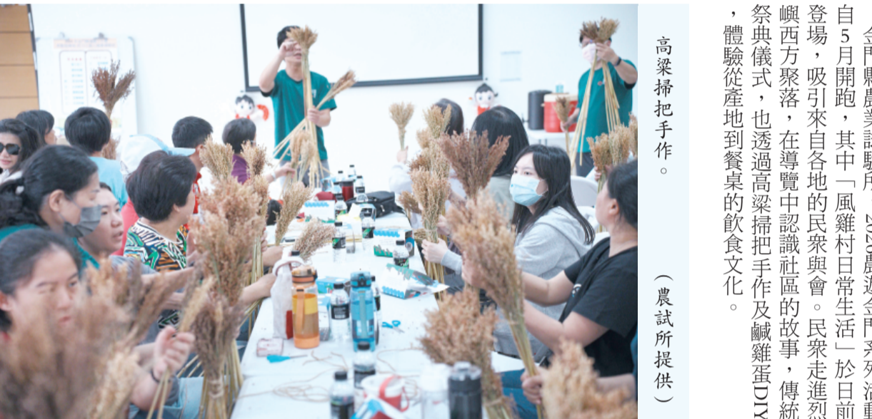
高粱掃把手作。

參與民眾看到警察與國軍官兵齊聚捐血，紛紛表達感動與肯定。有民眾表示，警察平時給人剛毅、嚴肅的印象，但透過這場活動，讓大家看見警察鐵血外表下溫暖柔軟的一面；也有民眾稱讚，「警察不只守護治安，更用熱血守護生命」，令人深受感動。 台北捐血中心也感謝金門各界熱情支持此次巡迴捐血活動，尤其警察、國軍與民眾共同投入，不僅有效補充血庫存量，也展現地方濃厚的人情味與公益精神。捐血中心呼籲民眾持續踴躍參與定期捐血，以穩定醫療用血供應，共同守護病患生命安全與醫療量能。 縣警局表示，適逢115年度警察節前夕，希望透過此次公益捐血活動，展現警察除維護治安外，更積極投入公益、關懷社會的一面，也期盼藉由警察與民眾共同參與，凝聚更多善的力量，讓愛與希望持續在金門傳遞。