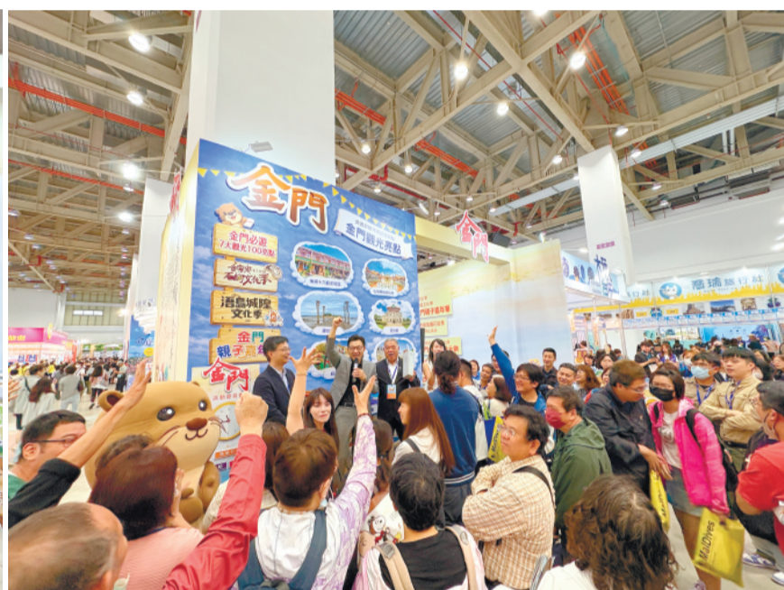
金門縣政府將於5月15日至18日參與「高雄旅行社公會國際旅展」。(資料照片)

客喜愛、可體驗「摩西分海」奇景的建功嶼，適合親子同遊的碧山湖公園，以及充滿藝術氣息的新十六藝文特區，皆已成為來訪金門不可錯過的景點。初夏的金門氣候清新舒適，是規劃旅遊行程的絕佳時機！五月登場的「頭頭戲」為擁有34年歷史的遊城隍盛事，「浩島城隍文化季」以及買翻金門島一路抽好禮的「購物嘉年華」(5/1-5/30)，緊接著暑假期間還有熱鬧登場的「親子嘉年華」(7/1-8/31)；入秋後則有傳承三百多年的特色民俗活動「中秋博餅元餅」(9/1-9/25)，以及深受老兵族群喜愛的「老兵召集令」(10/1-12/15)。此外，烈嶼鄉公所所定於現場現場同步推廣季節限定的夢幻景觀綠石槽「綠色歧蹟」寫生徵圖比賽」資訊，讓金門四季皆有不同亮點。