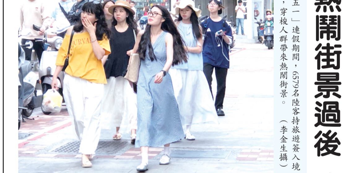
「五一」連假期間，SOS名陸客持旅遊券入境金門，穿梭人群帶來熱鬧街景。

金門「小三通」今年往來最新統計，迄五月十一日止達75萬5300人次，較去年同期61萬5300人次成長20%，這是一個可喜，也有點夢幻的數字。因為，在一連串的數字和熱鬧背後，存在一個個普遍受到關注的議題，即能否真正為地方產業迎來蓬勃生機，成為帶動經濟起飛的活水泉源。 今年大陸「五一」連假，金門迎來6.5萬名持旅遊券入境，幾乎是自由行的陸客，主要景點和街頭巷尾車水馬龍，歡聲笑語此起彼落。但與去年「五一」持旅遊券的6.5萬人次相較，有逾千人的落差。也許，這樣的差距沒有太大意義，可以逕予忽略，但持旅遊券入境的陸客才是真正遊客，旅遊模式和消費能力都反映金門的旅遊本質，值得縣府就相關的面向進行評析，並研擬針對性的因應措施。 另讓人注意的是，「五一」本地旅遊市場表現穩定，5月1日至5月2日住房預約率約為5至6成，實際住房率均達6成以上；5月3日以後預約情形趨緩，但實際住房率仍接近4成；整體住房率表現較去年同期平均增長約10%，顯示連假帶動旅遊人潮。這可從「五一」兩岸各有5天、3天連假，大陸遊客不少是攜家帶眷來到外，也有一些台灣本島遊客跨海觀光，在住宿方面也有它的剛性需求，是住房率出現小成長的主因。