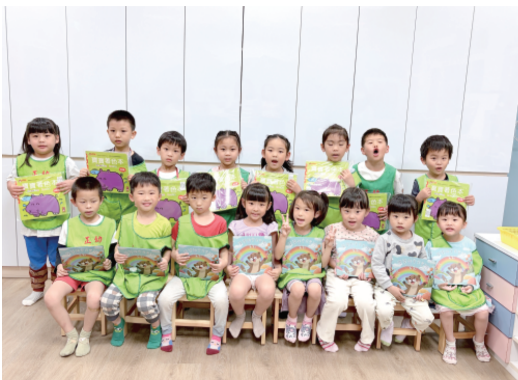
兒童事故安全宣導活動。

生活中的安全觀念，期盼從小建立正確防護意識，共同守護孩子健康平安成長。活動現場氣氛熱鬧溫馨，孩子們在寓教於樂的課程中學習重要安全知識，也讓校園充滿歡笑聲。 此次宣導活動由衛生局專業人員進入校園，以幼兒容易理解的方式進行教學，透過故事繪本、圖卡解說、情境互動及有獎問答等方式，引導孩子認識生活中潛藏的危險因子。為提升學習興趣，衛生局也特別準備繪本及著色本作為小禮物，讓孩子們在遊