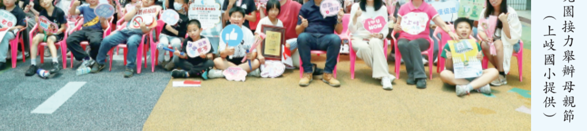
上岐國小暨附設幼兒園接辦母親節系列慶祝活動。

記者許加泰／綜合報導 五月是感恩與愛慶祝的季節，上岐國小暨附設幼兒園接辦母親節系列慶祝活動。校方今年特別以「岐」遇美好用「艾」相伴為主題，精心規劃了音樂展演、體能闖關、手