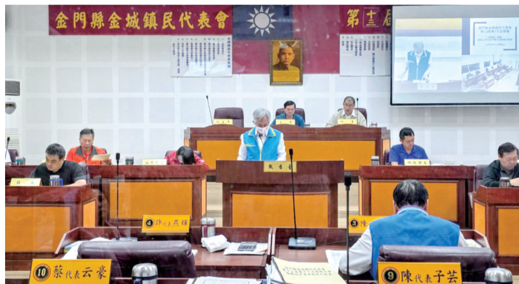
金城鎮代表會進行二讀議案第一讀會。

記者許峻魁／金城報導 金城鎮民代表會第十三屆第七次定期會，於五月四日(星期三)起正式召開，昨(13)日審議二讀案「一四年度金城鎮總決算案」，經代表一讀決議「通過」。 金城鎮民代表會第十三屆第七次定期會，從五月四日起召開，將持續至五月十五日，為期十二天。昨日的議程於早上十點起，在金城鎮公所四樓代表會議事廳