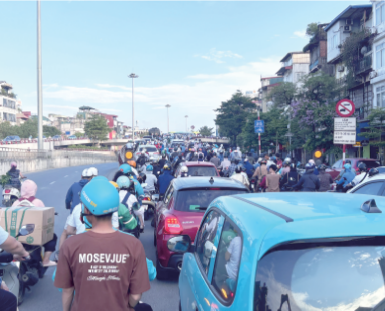
河內感受強烈人口壓力，甫公布的百年規畫將以紅河為軸心，水平和垂直拓展都會空間。交通為焦點之一，以解決熱點壅塞的長期問題。(中央社)

【中央社記者曾煒瑄河內16日專電】越南首都河內市近日公布以百年為單位的新總體規畫，改善千年古都面臨的建設老化、交通壅塞、淹水等長期問題，同時應對漸增的人口壓力。計畫以紅河為軸心水平和垂直拓展，並強化治水、綠化和交通。