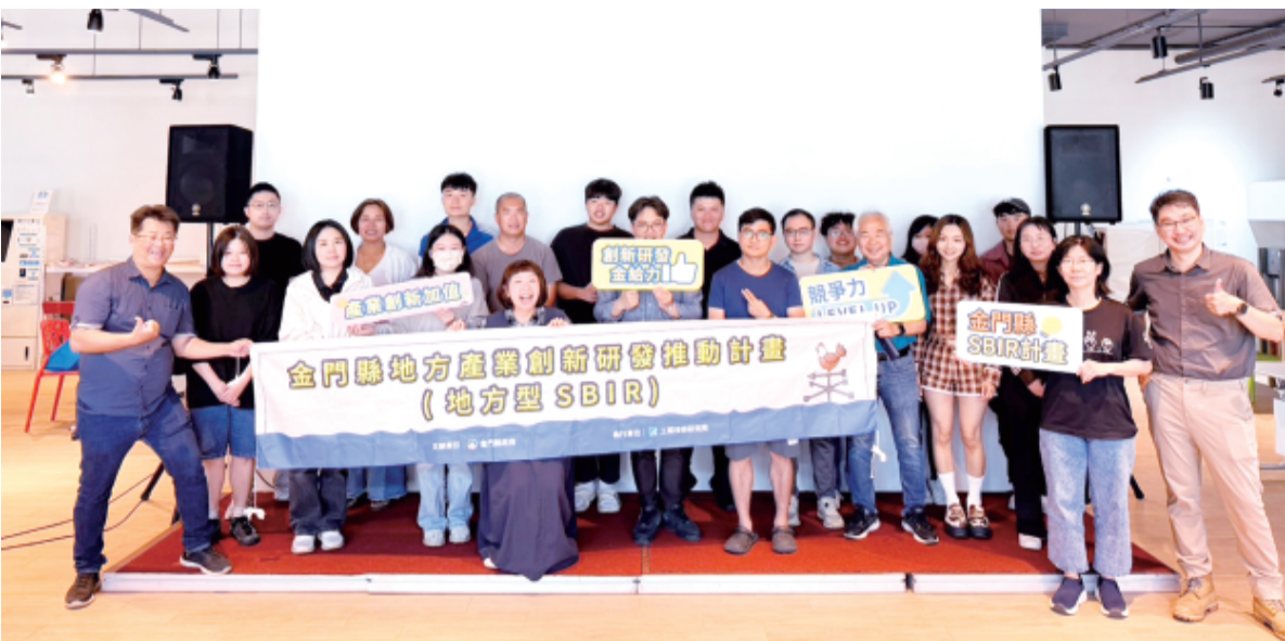
左、金門縣政府舉辦「115年地方產業創新研發推動計畫(地方型SBIR)」計畫說明會暨計畫書撰寫課程。 右、縣長陳福海關心地方在地產業發展。