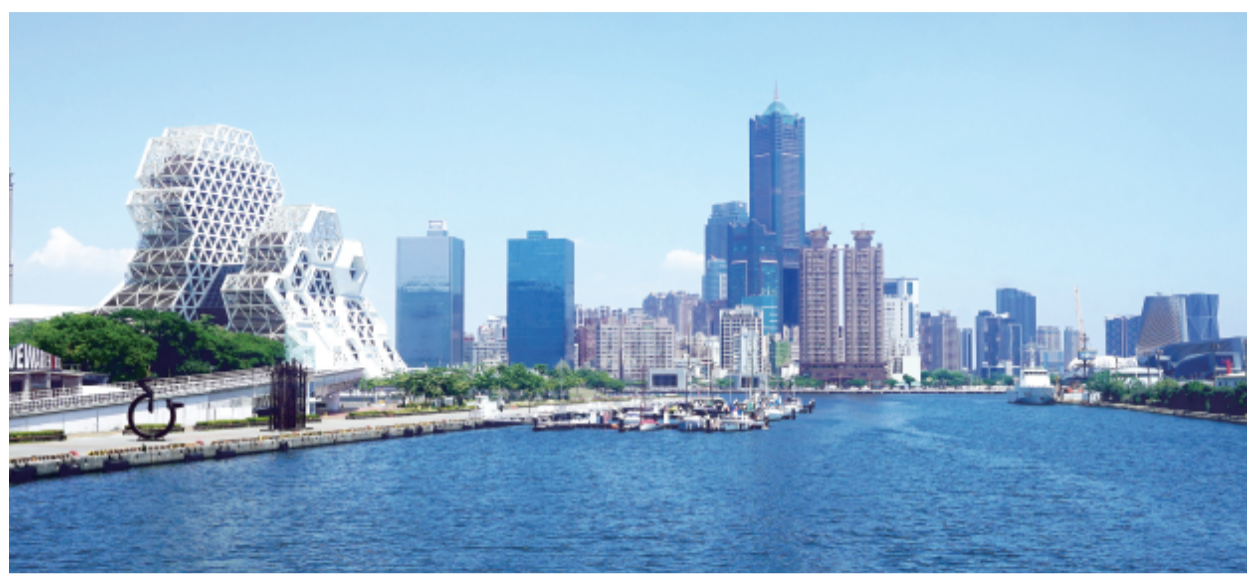
全台灣首座金融特區「高雄專區」於2025年中正式啟動，納入昔日「金融街」銀行林立的街區與亞灣區，這塊曾以「港區」聞名的街廓，隨著專區啟動與金融活水注入，正悄悄變身為台灣頂級富豪戶的新興聚落。(中央社)

【中央社記者蘇思云台北16日電】「如果到高雄就可以提供服務，何必飛一趟新加坡呢？」金管會主委彭金隆一語道盡為何他想推動亞洲資產管理中心核心願景，如今，亞資中心高雄專區運作將邁入第三年，當專區內試辦業務逐步成熟，金管會規劃將成功經驗擴大至全台灣。至於專區下階段定位與工作，彭金隆透露，跨境金融將是未來重要推進方向，持續成就亞資中心應具備的條件與競爭力。