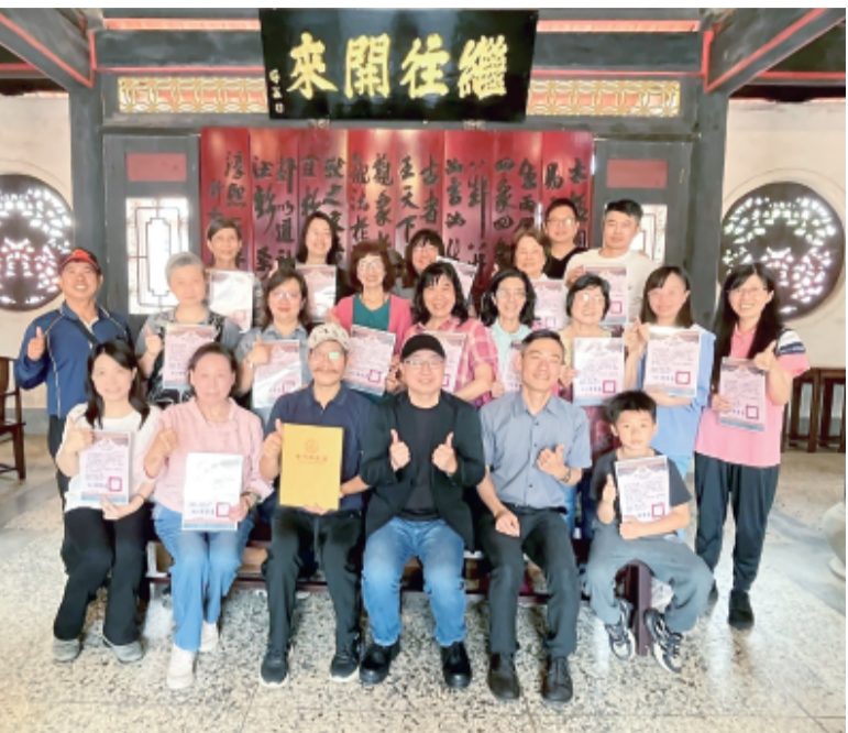
文化局朱子祠寫作班圓滿結業。

記者蔡麗玉／金城報導 五月海風輕拂活島，一場融合音樂、情感與文化交流的合唱盛會，昨(16)日下午3時於金門縣文化局演藝廳溫暖登場。「活島情·知音聚」跨海和鳴聯誼音樂會，邀集金門與台灣本島四組優秀合唱團同台演出，以歌聲跨越海峽，以旋律串聯人心，吸引眾多鄉親與愛樂人士到場欣賞，共度充滿藝術氣息的五月午後。 本次音樂會由金門縣政府、行政院金馬聯合服務中心指導，金門縣文化局與財團法人金門酒廠胡璉文化藝術基金會共同主辦，展現地方對藝術扎根與跨域文化交流的重視。現場貴賓雲集，包括副縣長李文良、行政院金馬聯合服務中心執行長吳煥堉、縣議員王國代、金湖鎮長陳文顯、立委陳玉珍辦公室主任董志謙、文化局長陳榮昌，以及胡璉文化藝術基金會董事長陳龍安等人士皆親臨會場，共同聆聽欣賞這場別具意義的音樂交流盛會。