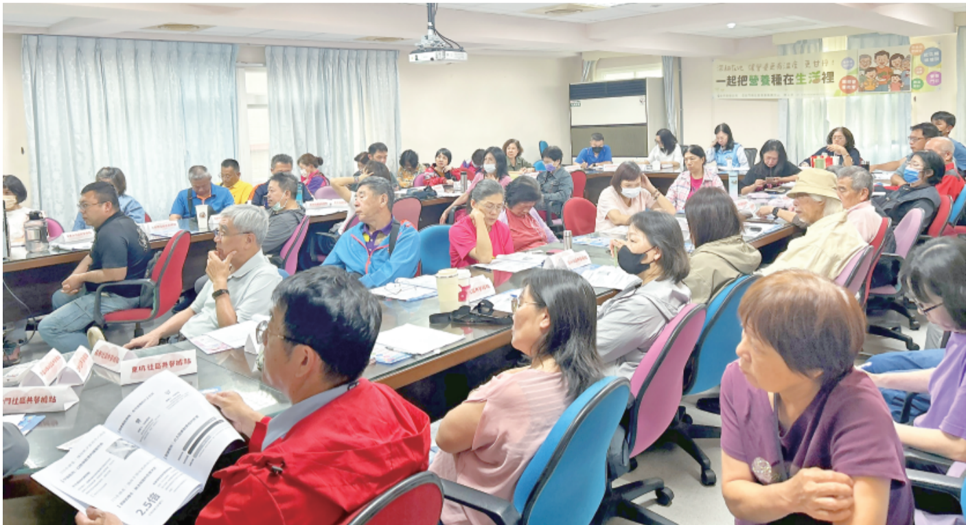
整合性長者健康促進計畫——社區營養推動小組會議 (衛生局提供)

記者呂肇中／綜合報導 隨著高齡化浪潮加速來臨，金門縣正逐步邁向超高齡社會。為提升社區長者營養照護品質，建立更完善的健康支持系統，金門縣衛生局於14日召開「115年度整合性長者健康促進計畫——社區營養推動小組會議」，由衛生局長李金治主持，邀集全縣各社區共餐據點負責人、營養專業人員及相關領域專家學者共同與會，針對長者營養照護、健康飲食推廣及社區營養策略進行深入交流與討論。 衛生局指出，依據最新統計資料顯示，截至115年3月底，金門縣65歲以上人口比例已達29.5%，意味著每五位居民中就有一位是高齢長者，社會結構已快速接近超高齡社會標準。隨著年齡增長，長者容易因胃口退化、吞嚥能力下降、肌肉不足或情緒低落等因素，導致進食量減少、營養攝取不足，進一步增加衰弱、跌倒甚至失能風險，因此如何維持長者營養推動重點，強調供餐服務