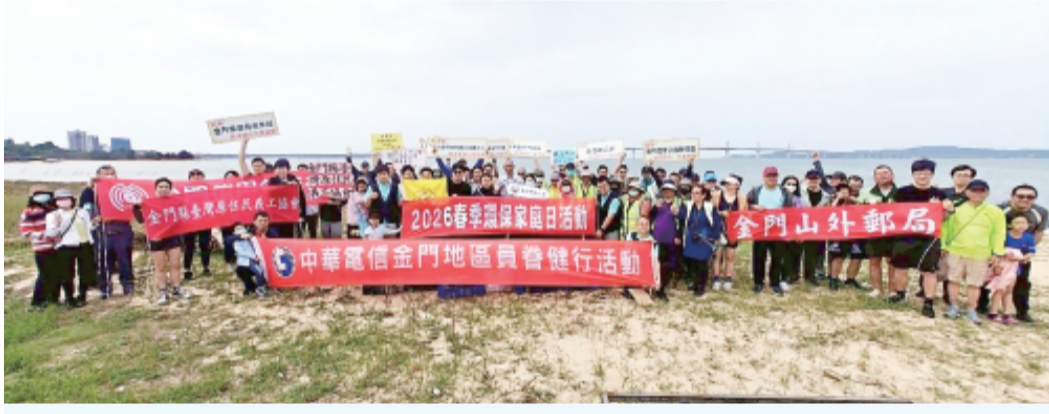
電信團隊聚聚慈湖海岸淨灘。

良好的飲食與營養狀況，已成為高齡照護的重要課題。衛生局長李金治表示，營養是健康老化的重要基礎，也是延緩失能與維持生活品質的關鍵因素。為強化長者營養照護，金門縣衛生局自108年成立「社區營養推廣中心」以來，持續推動各項營養健康服務，並陸續於金寧鄉衛生所及金城鎮衛生所設立分中心，透過專業營養師深入社區，提供居民營養問題分析、營養教育、長者營養風險篩檢、健康餐飲輔導及營養照護培訓等服務，逐步建構預防、篩檢到介入的完整照護體系。 衛生局進一步指出，在各項營養推動措施持續努力下，本縣長者營養不良風險率已由推廣中心成立初期的15%，下降至目前的9%，顯示相關政策與社區介入措施已逐步展現具體成效，也反映出社區共餐據點及第一線工作人員對長者健康照護的重要貢獻。 此次會議中，衛生局也特別向各共餐據點說明今年度社區營養推動重點，強調供餐服務應全面落實「三好一巧」原則，也就是「吃得下、吃得夠、吃得好、吃得巧」。希望透過均衡飲食與妥善備餐方式，提升長者進食意願與營養攝取品質。其中，「吃得下」是指餐點應兼顧軟硬適中與口感；「吃得夠」則強調足夠熱量與蛋白質攝取；「吃得好」為均衡營養與天然原味食材使用；而「吃得巧」則是透過少量多餐、食材搭配與烹調技巧，讓長者更容易吸收營養。 為鼓勵第一線共餐據點持續精進供餐品質，衛生局今年也推出一項營養滿分，均衡開菜單獎勵活動，希望藉由正向鼓勵方式，提升社區供餐健康化與營養化。衛生局表示，參與據點在設計每日菜單時，應優先採用蒸、煮、炒、燉等較健康的非油炸烹調方式，並盡量使用天然原型食物，減少加工食品使用，同時增加蔬菜攝取量及未精製全穀雜糧比例，讓長者能夠從日常飲食中獲得完整且均衡的營養。 活動期間，各據點只要定期分享每日供餐菜色紀錄，即可參與評選。表現優異者可獲頒「每月健康達人獎」3,000元獎金，以及年度「金廚榮譽獎」5,000元獎金，藉此提升第一線備餐人員參與感與榮譽感，同時帶動社區健康飲食風氣。 此外，會中也針對即將於今年度啟動的「長者飲食營養行為與健康風險追蹤調查計畫」進行說明，並邀請專家學者進行專業解析。衛生局表示，未來將透過科學化評估工具與系統性調查方式，深入各社區據點進行大規模問卷調查及迷你營養評估篩檢，全面掌握社區長者營養現況與健康風險，作為後續政策規劃與服務精進的重要依據，期望透過早期發現、早期介入方式，降低長者營養不良與失能風險。 衛生局長李金治強調，社區共餐據點不只是提供餐飲的場所，更是長者交流互動、建立社會支持與提升心理健康的重要據點。透過共餐服務，不僅能促進長者均衡飲食，也能減少孤獨感，增加社會參與機會，對身心健康都有正面幫助。 衛生局長李金治表示，未來衛生局將持續結合社政、醫療及社區資源，透過定期輔導、營養教育及食品安全管理等措施，協助社區提升供餐品質，同時也將研發符合金門在地特色的示範循環菜單，讓長者能在熟悉的飲食文化中吃得健康、吃得安心，共同打造完善的社區照護網絡，朝向「歡喜動、健康吃、安心住」的高齡友善幸福島嶼願景邁進。