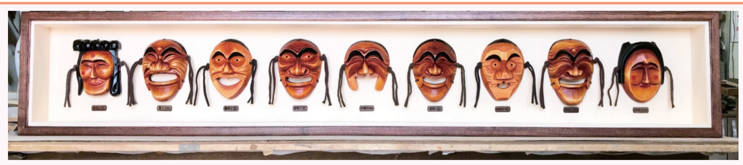
高市早苗訪韓國安東 李在明準備傳統禮物 日本首相高市早苗19日搭乘專機抵達大邱機場，前往韓國總統李在明的故鄉慶尚北道安東。李在明為高市早苗準備具有安東特色，並蘊含韓日關係意義的禮物，包括由9種河回假面構成的「安東河回假面木雕畫框」。

密社區帶來巨大震撼，對2006年離開加薩（Gaza）前往美國的夏納母親而言，勢必格外受到衝擊。以色列軍隊和巴勒斯坦武裝分子當年在加薩激戰數月。夏納的父親則於2015年從約旦移民美國。