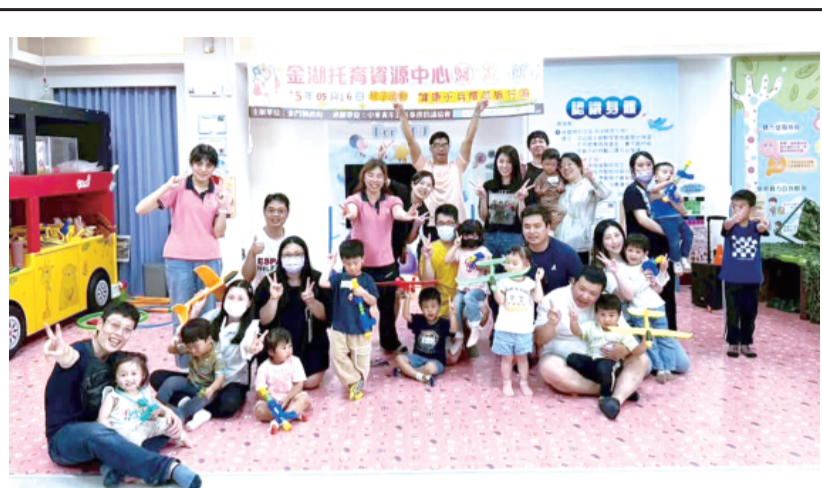
醫遊館《健康小兵體能旅行團》親子活動。