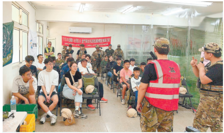
金門縣生存遊戲運動協會辦理推廣活動，透過專業引導，讓大小朋友體驗到一場安全且刺激的生存之戰。

記者許加泰／烈嶼報導 烈嶼國中將於5月29日舉行創校六十週年校慶系列活動，以「烈嶼國中、六十榮耀、精緻卓越、創新致遠」為主題，邀請歷屆校友、退休教職員工、家長、地方鄉親及關心烈嶼教育的各界朋友，一同回到烈嶼，見證這所離島學校走過一甲子的教育成果與校園情感。