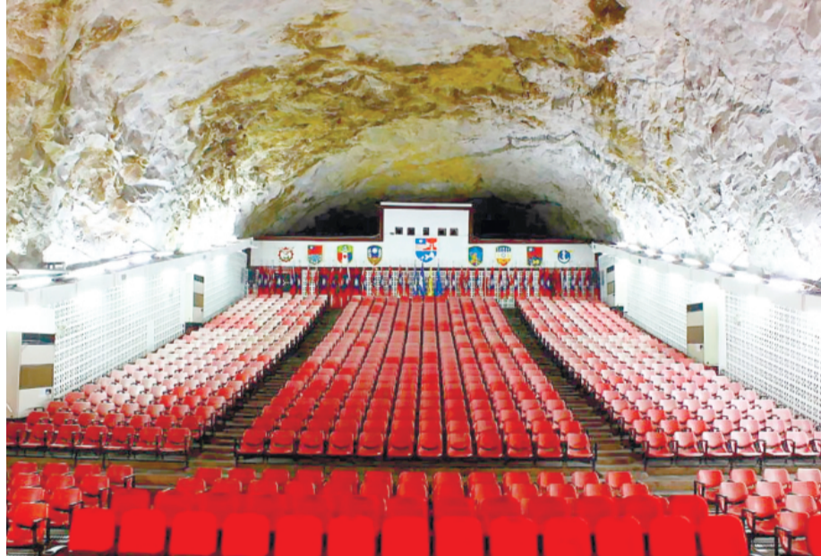
「擎天廳參訪申請」自15年6月1日起將導入線上報名系統。

記者陳冠霖／縣府報導 為提升民衆申辦便利性與參訪服務品質，金門縣政府觀光處宣布自15年6月1日起，「擎天廳參訪申請」將導入線上報名系統，提供即時、更便利、更透明的申請服務。未來不論是團體或個人旅客，只需透過網路即可快速完成報名程序，讓參訪安排更加快速順暢。 觀光處表示，擎天廳為金門極具代表性的戰地文化景點，每年吸引遊客慕名而來。為因應數位化服務趨勢，並優化既有申請作業流程，觀光處積極推動「擎天廳線上申請系統建置」，整合報名、資料填報及流程管理功能，打造更友善的智慧觀光服務平台。 新系統上線後，將正式取代現行電話、紙本、傳真及Email等申請方式，全面採行線上作業。民衆可隨時透過網頁完成報名，不受時間與地點限制，除可減少重複填寫與文件往返，並有助提升整體行政效率與申請透明度。 觀光處指出，為利遊客提前規劃行程，無論個人或團體申請案件，皆應於預定參訪日前7日至60日間完成線上申請(以日曆計算，包含例假日及國定假日)，減少旅客安排行程之不確定性，以利安排金門深度旅遊行程。 為協助民衆及旅遊業者提前熟悉操作程序，觀光處已同步開放測試網站供外界預先體驗，民衆可至 http://www.gm.gov.tw 、 aznwebtest.net 搶先熟悉操作介面及索擎天廳戰地文化魅力。 觀光處提醒，15年5月31日(含)以前已提出之申請案件，仍將依原規定辦理；15年6月1日起，所有擎天廳參訪申請案件皆須透過線上系統辦理。誠摯邀請民衆一起體驗智慧觀光服務新樣式，輕鬆探索擎天廳戰地文化魅力。 觀光處指出，此次系統升級不僅是行政數位化轉型的重要一步，更展現縣府持續推動智慧觀光與便民服務的決心。未來將持續蒐集使用者意見，滾動優化系統功能，提供更完善的觀光服務體驗。 報名流程。相關資訊亦同步公告於金門觀光旅遊網及官方社群平台，方便民衆查詢使用。為配合系統升級與業務調整，觀光處特別提醒，民衆如有操作或參訪疑問，請撥打電話082-12823分機6713，由專人提供諮詢；原服務專線即日起停止服務，請撥打新專線以免資訊落差。 此外，觀光處將主動函請旅行社與業公會協助轉知所屬會員，提醒旅行社業者及早因應團體報名系統調整，降低制度轉換期間可能產生的不便。 觀光處呼籲，擎天廳位處軍事管制區，參訪申請對象以本國國民為限，申請人須具備中華民國國民身分證。外籍人士(含大陸籍)、身分證別不符(含車輛資料)及拒絕提供身分證明文件者，皆不得入營參訪。入營時將以國民身分證進行身分查核，不受時間與地點限制，除可減少重複填寫與文件往返，並有助提升整體行政效率與申請透明度。 觀光處提醒，15年5月31日(含)以前已提出之申請案件，仍將依原規定辦理；15年6月1日起，所有擎天廳參訪申請案件皆須透過線上系統辦理。誠摯邀請民衆一起體驗智慧觀光服務新樣式，輕鬆探索擎天廳戰地文化魅力。