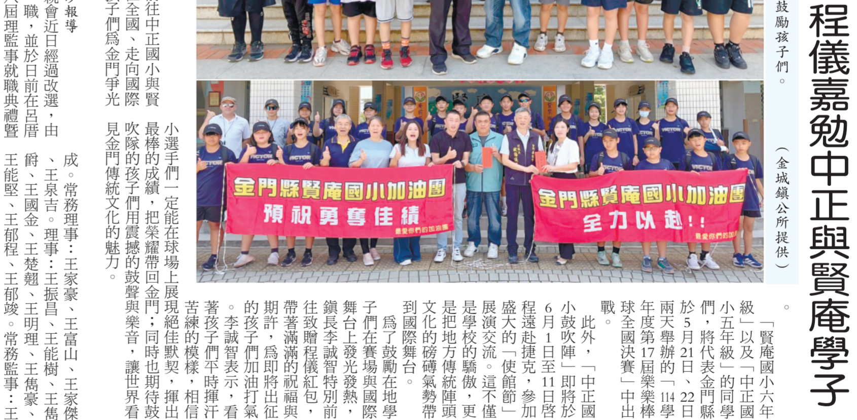
金門縣賢庵國小加油團預祝勇奪佳績，全力以越。

記者許峻魁／金城報導 小選手們一定能在球場上展現絕佳默契，揮出最棒的成績，把榮耀帶回金門；同時也期待鼓吹隊的孩子們用震撼的鼓聲與樂音，讓世界看見金門傳統文化的魅力。 此外，「中正國小鼓吹陣」即將於6月1日至11日啟程遠赴捷克，參加盛大的「使館節」展演交流。這不僅是學校的驕傲，更是把地方傳統陣頭文化的磅礴氣勢帶到國際舞台。 為了鼓勵在地學子們在賽場與國際舞台上發光發熱，鎮長李誠智特別前往致贈禮儀紅包，帶著滿滿的祝福與期許，為即將出征的孩子們加油打氣。李誠智表示，看著孩子們平時揮汗苦練的模樣，相信