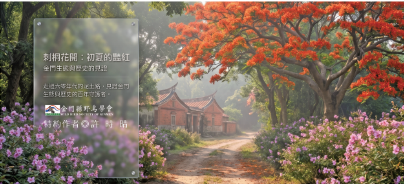
刺桐花開：初夏的豔紅 金門生態與歷史的見證 走過六零年代的泥土路，見證金門生態與歷史的百年守護者。 金門縣野鳥學會 特約作者◎許時晴

在金門有一棵赫赫有名的刺桐，您可認識或是見過？金門本地人知道者應該不在少數，這棵刺桐樹住在金門國家公園管理處中山林行政中心前，就在大門入口處，相信每年5、6月來金門而到訪中山林的遊客們都會被它的滿樹繁花驚艷。根據金管 園藝維管日照：全日照 刺桐學名：Erythrina variegata 英名：Indian coral tree、tiger's claw 別名：雞公樹、梯枯、英雄樹、大冇樹 分類：豆科、蝶形花亞科、刺桐屬、落葉性大喬木 原產地：金門、台灣、熱帶亞洲、太平洋洋洲諸島的珊瑚礁海岸 花期：3、5月 花色：橙紅色、紅色 果期：8月 果色：莢果，幼果暗褐色；成熟時轉為黑色 樹高：10、15公尺；或可達20公尺 刺桐的樹皮為淡灰色，具明顯縱溝裂。葉片青綠色、厚紙質，為互生的三出複葉，新葉表面有黃褐色茸毛。花期3、5月，盛花期在5月；頂生總狀花序或總狀花序，自枝條頂端直立伸出，長15~20公分；橙紅色蝶形花瓣，鐘形或佛焰苞狀花萼。全樹多具瘤狀銳刺，樹幹、枝條（老枝無刺）、葉背中軸均有刺，葉片形似梧桐葉，因而得名刺桐；樹姿高大挺拔，因此獲得一個別名英雄樹。它的屬名「Erythrina」是源自希臘文的字根「erythro」紅色，指的是刺桐橙紅的花朵。英文名稱「Coral Tree」，是指枝幹上的刺好像老鷹爪。 在金門、台灣的刺桐屬植物，只有刺桐是原生樹種，其餘諸如珊瑚刺桐、雞冠刺桐、火炬刺桐、黃脈刺桐都是引進的園藝栽培種。其生性強健，樹齡壽命長，木材具有極厚的髓部，材質色白、輕軟有彈性，可用於製作木屐、玩具、椿臼等用具。樹皮中藥材，其花、葉、樹皮、根皮、葉皆可入藥，但是這些都含有微量生物鹼，亦即刺桐全株有毒，切不可擅自隨意使用。 2009年，台灣的刺桐屬植物受到「袖小蜂」侵害，從北到南蔓延迅速，稍晚2009年袖小蜂侵襲了金門的刺桐樹，有些地方的狀況頗為嚴重；症狀是葉片、枝條產生腫瘤狀蟲癭，使得植株衰弱甚至死亡，造成嚴重危害，感染的小苗須銷毀，感染的落葉必須集中焚毀，以防止擴散，同時加強施肥與澆水增加刺桐樹的抵抗力；經過農業部林業及自然保育署等相關單位推動防治，時至今日已獲得改善與控制。 刺桐是落葉性大喬木，具傘形樹冠，枝葉寬闊，樹蔭廣大，適合作庭園遮蔭樹與行道樹。春末夏初開花，花開時花顏鮮豔、熱情洋溢，充滿熱帶