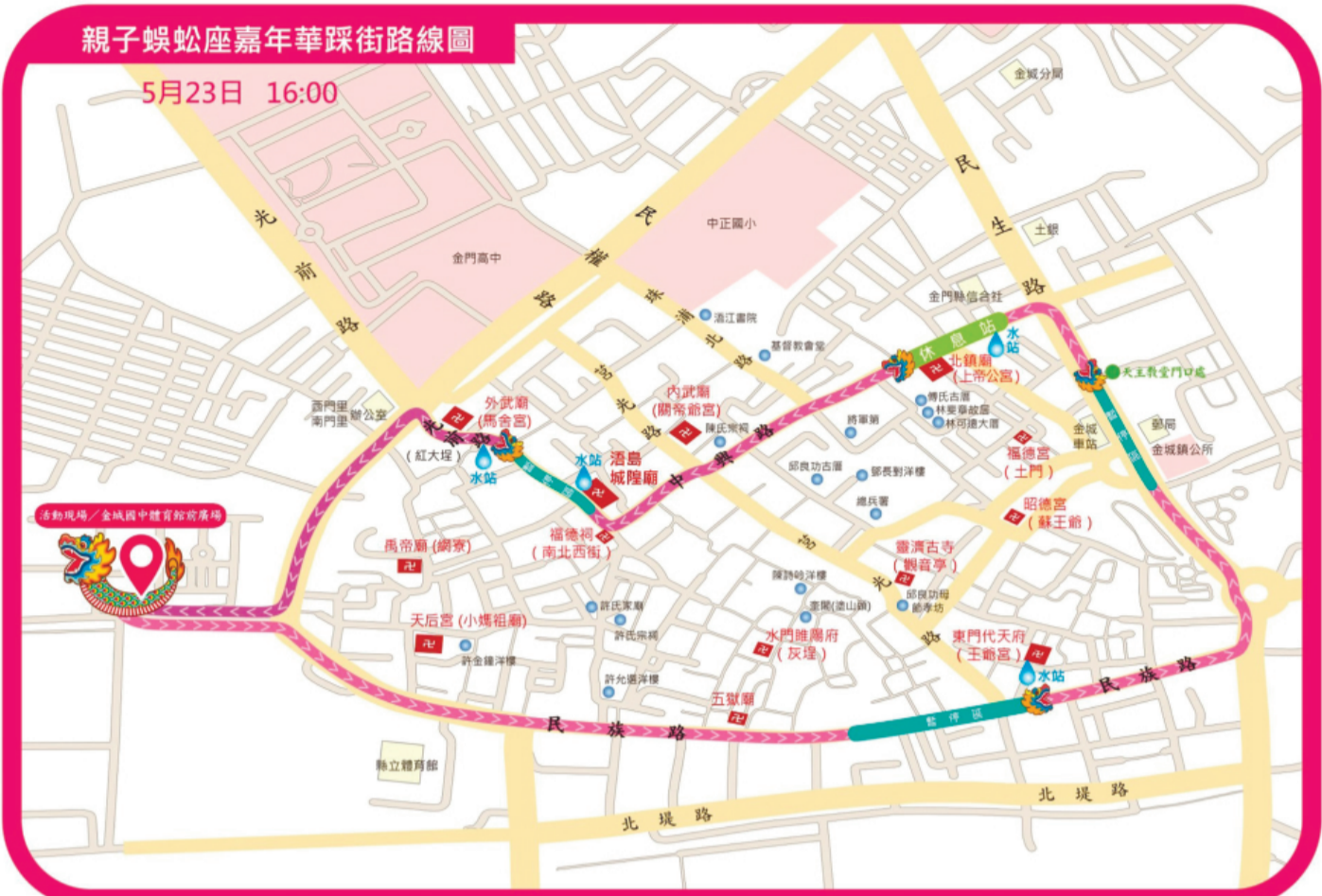
金城鎮公所將於5月23日下午舉辦「2026親子蜈蚣座嘉年華」，圖為活動行進路線圖。

記者莊煥寧／金城報導 為慶祝湄洲島城隍遷治346週年，金城鎮公所將於明(23)日下午4時舉辦「2026親子蜈蚣座嘉年華」，以百組親子共同參與蜈蚣座踩街遊行，提前為農曆四月十二迎城隍盛會暖身。活動結合傳統藝陣、親子互動與文化傳承，不僅讓現金門經典民俗陣頭風華，同時讓孩子與家長透過實際參與，感受湄洲島宗教文化的深厚魅力。 金城鎮長李誠智表示，人力蜈蚣座是金門最具代表性的傳統藝陣之一，象徵瀟灑邪穢、除惡辟邪，承載深厚民間信仰意涵。金門更曾於民國100年，以「世界最長純人力肩扛蜈蚣座陣頭」締造金氏世界紀錄，展現地方文化的凝聚力與特色。 李誠智指出，民間流傳著「坐蜈蚣座的子，會聰明健康好育養」的說法，而參與扛抬的人員則象徵受到神明庇佑，學業、事業平安順遂，因此每年活動都深受家長歡迎。今年報名情形更是相當踴躍，報名網站開放後短短約10分鐘，100個正取名額即全數額滿，顯見鄉親對迎城隍文化及親子活動的高度支持與期待。 他指出，此次活動採親子共同參與方式，每位擔任蜈蚣座「妝人」的小朋友，皆需搭配一位男性親友擔任扛抬人員，一同完成踩街體驗。透過親子攜手參與，不僅讓傳統文化向下扎根，同時增進家庭間的互動與情感交流。 李誠智特別感謝金門防衛指揮部秉持「軍民一家」精神，支援150名官兵協助活動進行。他表示，藉由蜈蚣座團練與踩街，不僅展現軍民合作情誼，凝聚青壯世代對地方文化的認同，共同守護傳統民俗資產。 金城鎮公所提醒，所有報名參加活動的大、小朋友，務必於活動當日中午12時30分前至金城國中體育館完成報到，逾時將視同棄權。活動現場將安排小朋友進行換裝與妝髮，化身蜈蚣座上的小妝人，展現熱鬧討喜的傳統藝陣風采。 此外，參與活動的100位小朋友皆可獲得限量獅獅水獺玩偶掛件；扛抬人員則可獲贈專屬紀念衫、紀念帽及運動毛巾等紀念品，為活動留下珍貴回憶。 活動預計於下午4時舉行開幕儀式後正式出發，踩街隊伍將自金城國中體育館起行，沿民族路、民生路、中興路、濱海路及濱海路等路段繞行，最後返回金城國中。主辦單位沿途規劃多處休息點，並安排每節點2至3人輪替扛抬，同時避開狹小巷弄，以兼顧安全與體力負荷，確保活動順利進行。 李誠智邀請鄉親與遊客踴躍到場，為百人蜈蚣座踩街隊伍加油喝采，一同感受踩街遊行的震撼與熱鬧氛圍。他期盼透過親子蜈蚣座活動，讓更多年輕家庭認識並參與金門珍貴的民俗文化，讓孩子在歡笑與陪伴中，留下難忘且富有文化意義的童年回憶。