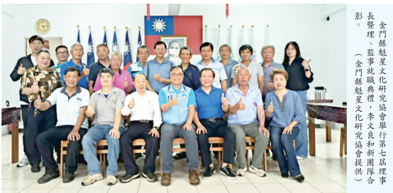
金門縣魁星文化研究協會舉行第七屆理事會暨監事就職典禮，李文良和新團隊合影。

記者許加泰／綜合報導 金門縣魁星文化研究協會昨日舉行第七屆理事會暨監事就職典禮，由縣長李文良頒發當選證書予連任理事長的張志強，同時勉勵新任理事會與行政團隊結合縣府、文化局、學術單位等多方資源，繼續傳承並發揚魁星文化，讓珍貴的魁星文化在地方代代相傳、發揚光大。就職活動於昨日下午假總工會會議室舉行，副縣長李文良代表縣府專程到場致賀。李文良並親自頒發第七屆