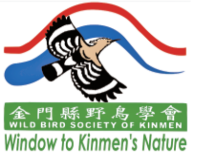
金門縣野鳥學會 Window to Kinmen's Nature

園藝維護需到位 刺桐樹是熱帶及亞熱帶的原生樹種，主要分布於海拔800公尺以下的地區，生長適溫15、20℃，低於20℃容易生長停頓，喜歡溫暖、排水良好、陽光充足的生長環境。