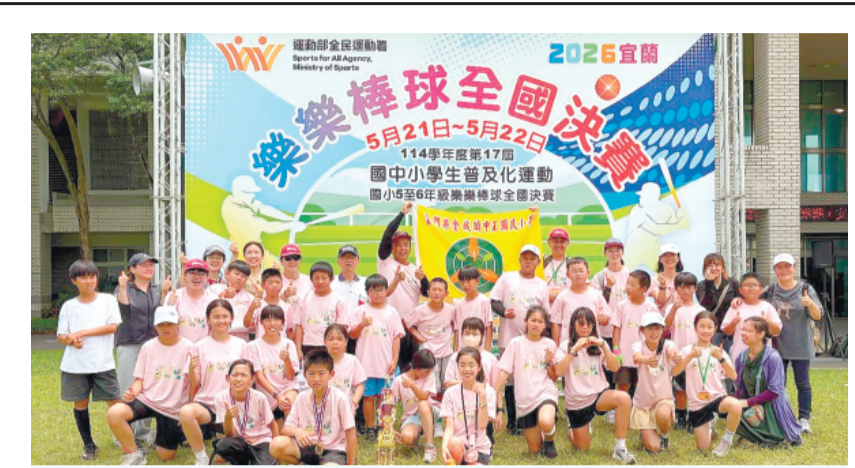
中正國小樂樂棒球隊勇奪「114學年度第17屆國小5至6年級樂樂棒全國決賽」殿軍，創參賽以來最佳成績。

記者蔡麗玉／金沙報導 由金沙鎮公所主辦的「115年金沙盃羽球邀請賽」24日下午5時於金沙國中體育館舉行閉幕典禮，為期三天的賽事圓滿落幕，共吸引來自各鄉鎮計38名羽球好手齊聚一堂，角逐社會組、長青組及學生組等各組賽事。本屆社會團體組20隊、長青團體組4隊、學生組國中4所及國小9所，民衆及學子於賽事中激發出許多精彩對決，不少家長和熱心羽球運動的鄉親也到場予以加油喝采，場面十分熱鬧。