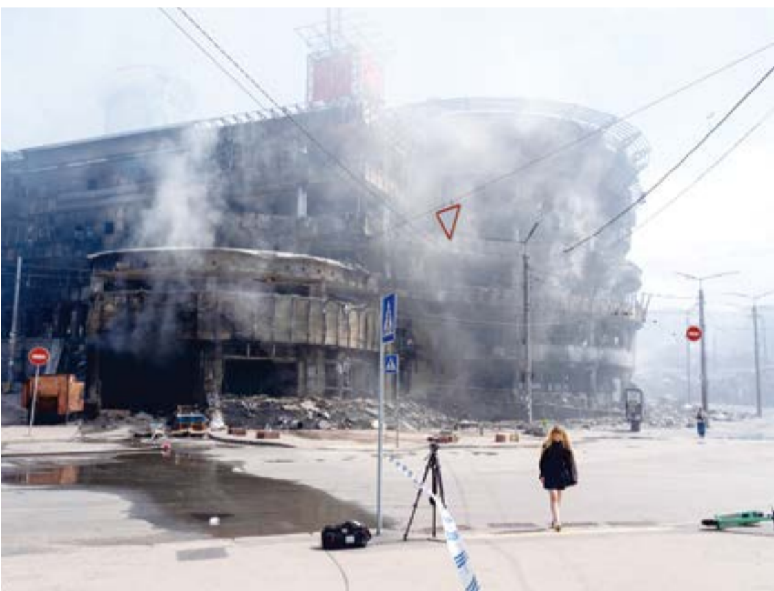
俄羅斯今天凌晨對烏克蘭發動大規模空襲，原有商場及鄰近市場已遭焚毀，只剩焦黑外牆，現場因消防人員仍在灌救，煙霧瀰漫，空氣中傳來煙味。

【中央社基輔24日綜合外電報導】俄羅斯今天對烏克蘭首都基輔及其周邊地區發動了4年來規模最大的一數千枚的攻擊行動，除了出動600架無人機與90枚飛彈，也發射了「榛樹」(Oreshnik)極音速中程飛彈。 綜合路透社和衛報(The Guardian)報導，據烏克蘭官員說法，這場持續數小時的夜間襲擊行動造成基輔(Kyiv)市內2人死亡、周邊地區另有2人罹難，另有近百人受傷。當局表示，數十棟住宅大樓及多所學校遭到破壞，其中許多位在基輔市中心。俄國這波攻擊行動，同時造成烏克蘭內閣大樓及外交部輕微損壞。 此外，基輔市政單位指出，位於市中心的國家美術館和愛樂音樂廳都遭嚴重損毀，市中心多座歷史建築亦受波及。 公開資訊調查組織「資訊初性中心」(Centre for Information Resilience)研究員柯林斯(Rollo Collins)審查路透社攻擊畫面後表示，榛樹的彈頭似乎分裂成了36枚子彈。 烏方表示，俄羅斯在這波攻勢中，總共發射了600架無人機與90枚各型飛彈，其中有36枚為彈道飛彈。總統澤倫斯基(Volodymyr Zelenskyy)指出，俄方也蓄意攻擊供水設施，意圖在夏季用水高峰來臨前破壞供水系統。 俄方發動這波攻擊之前，總統普丁(Vladimir Putin)曾指控，基輔空襲中俄方控制的盧甘斯克州(Luhansk)一處學生宿舍，造成多人死亡，並下令軍方進行報復。 烏克蘭否認俄方指控，表示他們針對當地一支精銳無人機指揮部隊發動攻擊。 法國總統馬克宏(Emanuel Macron)譴責俄國動用榛樹飛彈，認為這顯示「俄羅斯侵略戰爭已陷入死胡同」；德國總理梅爾茨(Friedrich Merz)則稱這種武器的動用是「魯莽的升級行為」。 歐洲聯盟外交與安全政策高級代表卡拉斯(Katrina Litalien)表示：「俄羅斯在戰場上陷入死胡同，便對市中心進行蓄意打擊恐嚇烏克蘭，這是令人髮指的恐怖行徑，目的就是讓盡可能的平民喪命。」 她稱俄國動用榛樹飛彈是「政治恐嚇與魯莽的核邊緣政策」，並透露歐盟外長下週將討論「如何進一步強化對俄羅斯的國際壓力」。