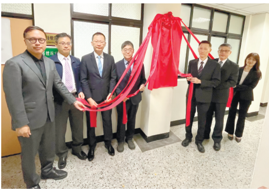
查察妨害選舉執行小組成立並揭牌。

記者莊煥寧／金城報導 為因應即將到來的各項選舉工作，金門地方檢察署依最高檢察署指示，於昨(25)日上午9時30分正式成立「查察妨害選舉執行小組」，並舉行揭牌儀式，宣示全面啟動查察工作，全力維護公平、公正與乾淨的選舉環境。