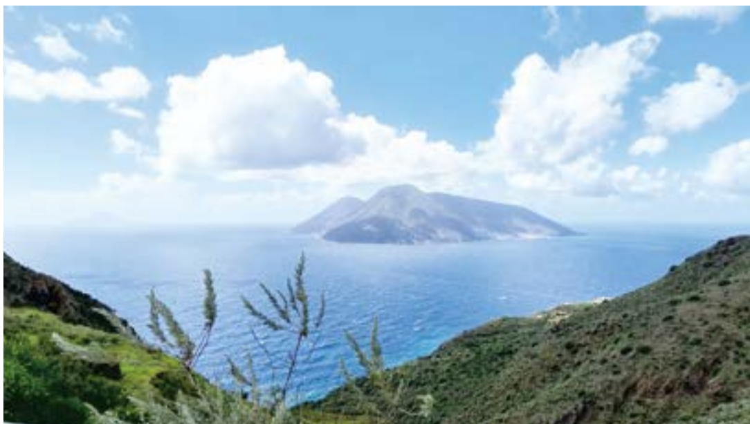
西西里島東北部的7座小島組成的「伊奧利群島」，是聯合國世界遺產，享獨特火山地形、絕美海景。(中央社)

【中央社記者黃雅詩利帕里25日專電】愈來愈多台灣遊客將西西里島納入義大利旅行規劃，但不熟悉位於西西里島東北部、由7座小島組成的「伊奧利群島」，不僅是聯合國世界遺產，享獨特火山地形、絕美海景，還有一段從「墨索里尼惡魔島」變身度假天堂的歷史。 群島近期以「伊奧利品牌」(Brand Eolie)名義，在所屬的墨西拿(Messina)市政府與當地超過百家企業支持下，邀請台灣中央社等15國外媒參訪，盼拓展觀光市場，打破季節性旅遊限制，並藉此激勵年輕人返鄉工作。 ●世外桃源風純樸 盼拓展台灣觀光客源 組成伊奧利(Isole Eolie)的7座群島，包括利帕里(Lipari)、火山島(Vulcano)、薩利納(Salina)、斯通波利(Stromboli)、菲利庫迪(Filicudi)、阿利庫迪(Alicudi)與帕納雷阿(Panara)。 群島宛如一座不斷演變的考古公園，火山灰與熔岩完美保存歷史遺跡，還有沙灘、海灣、海蝕洞穴等絕美景觀，海水則閃耀著土耳其綠與深藍等不同色階。 利帕里是其中面積最大、人口最多的島嶼，當外國團體抵達利帕里，當地樂團在碼頭以傳統樂器演奏民謠，2所高中學生擔任志工迎賓，展現熱情純樸民風。 島上星級旅館、民宿林立，多數歐美人來此是為享受海上活動或海灘日光浴，5月下旬已逐漸進入觀光旺季，根據官方網站統計，每年造訪遊客多達20萬。 不過在記者參訪期間，未遇到任何其他亞洲旅客，義大利全國通訊社安莎(ANSA)也特別採訪中央社，談到「伊奧利群島」的華語觀光資訊相對稀缺，台灣極有潛力成為當地開拓觀光的「藍海」。