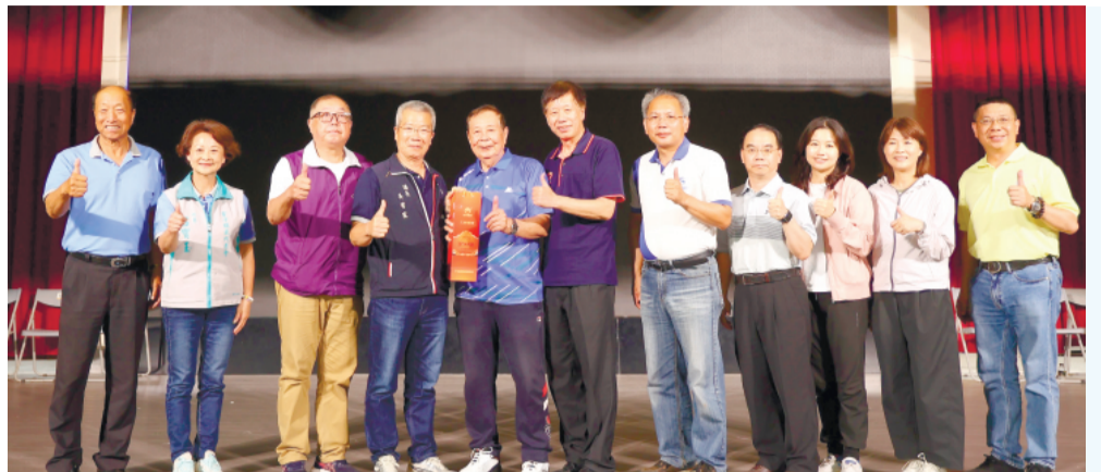
「115年金沙盃羽球邀請賽」圓滿落幕，三天賽事吸引眾多羽球好手齊聚一堂並打出許多精彩對決。

記者蔡麗玉／金沙報導 由金沙鎮公所主辦的「115年金沙盃羽球邀請賽」24日下午5時於金沙國中體育館舉行閉幕典禮，為期三天的賽事圓滿落幕，共吸引來自各鄉鎮計38名羽球好手齊聚一堂，角逐社會組、長青組及學生組等各組賽事。本屆社會團體組20隊、長青團體組4隊、學生組國中4所及國小9所，民衆及學子於賽事中激發出許多精彩對決，不少家長和熱心羽球運動的鄉親也到場予以加油喝采，場面十分熱鬧。