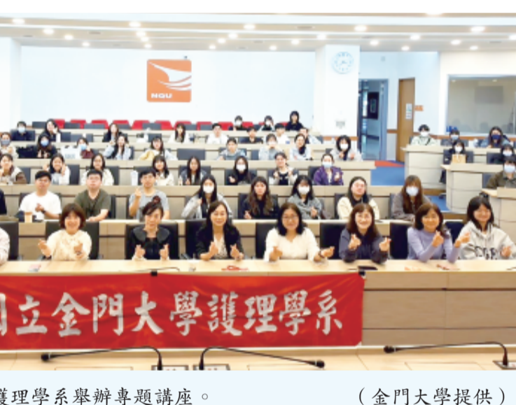
金門大學護理學系舉辦專題講座。

的人力匱乏，而是體制環境造成的專業耗損。她進一步說明護理全聯會長期推動的政策倡議，包含推動「三班護病比」法定明文以優化職場環境，並主張訂定合理的醫事人員薪資標準，讓薪資待遇能實質反映護理專業的勞務價值。 陳麗琴強調，在邁向超高齡社會的進程中，護理專業具有不可替代的核心價值，全聯會亦將持續致力於提升護理人員的社會地位與執業尊嚴。座談過程中，學生亦針對職場適應、勞動權益與臨床支持系統等議題踴躍提問，現場交流熱絡。陳麗琴感性勉勵在場學子，進入職場後並非孤身作戰，護理全聯會將永遠是所有同仁「最堅強的後盾」。從政策倡議到職涯發展，公會皆會站在第一線為護理人員發聲，全力守護專業尊嚴與職權。