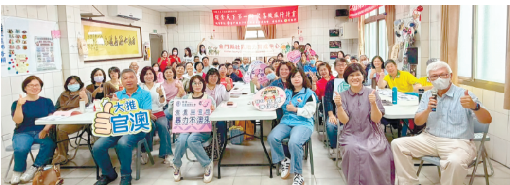
金門縣政府社會處日前於金沙鎮官澳社區發展協會舉辦「AI時代的社區工作」進階課程。

金門縣政府社會處日前於金沙鎮官澳社區發展協會舉辦「AI時代的社區工作」進階課程。課程內容包括：AI工具與社區治理實務、AI工具與社區治理實務、AI工具與社區治理實務。課程內容包括：AI工具與社區治理實務、AI工具與社區治理實務、AI工具與社區治理實務。