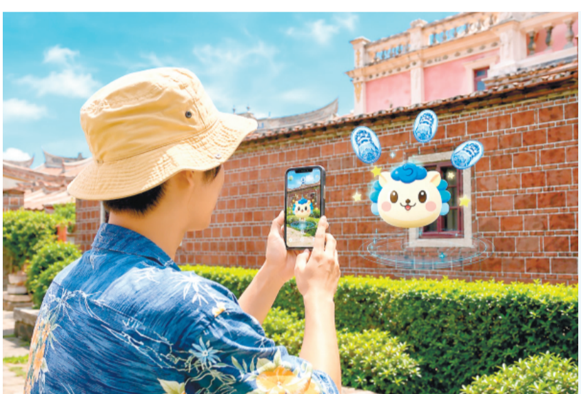
「風獅團的修行之旅」AR互動集章活動同步登場，邀請旅客跟隨風獅團走訪金門特色景點與合作店家。

記者陳冠霖／縣府報導 「2026金門購物嘉年華」主檔期活動已於本（115）年5月30日正式登場，活動自5月30日起至6月30日止，以「買翻金門島，一路抽好禮」為主軸，串聯全島合法店家共同響應。為提升民眾參與便利性及推動數位轉型，本年度活動全面簡化消費登錄流程，主打「綁定載具、自動入抽」，民眾只要綁定一次，整段活動期間消費即可自動參加抽獎，輕鬆就有中獎機會。