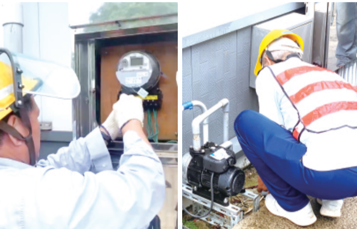
金門縣政府依法執行違規場所停止供水供電，維護公共安全。

記者陳冠霖／縣府報導 金門縣政府持續落實建築物公共安全管理，針對位於金寧鄉榜林29號之場所，因長期未依規定辦理建築公共安全检查簽證及申報，且經通知及裁處後仍未完成改善，已依法執行停止供水供電措施，期督促場所儘速完成改善，以維護公共安全及保障民眾生命財產安全。 縣府指出，該場所現作為D1休閒活動場所使用，依建築物公共安全检查簽證及申報辦法規定，屬應定期辦理建築物公共安全检查簽證及申報之場所。惟受處分人未依規定辦理建築物公共安全检查簽證及申報，縣府前於15年3月6日依建築法第91條第1項第4款規定裁處新臺幣6萬元罰鍰，限期為15年4月12日。 惟受處分人屆期仍未完成建築物公共安全检查簽證及申報，違規情形持續存在。縣府遂於15年5月14日再依建築法第91條第1項第4款及金門縣政府處理違反建築法使用管理規定事件裁罰基準規定辦理裁處新臺幣10萬元罰鍰，並限期改善或補辦手續；另考量其持續違規情形及公共安全維護需要，合併停止供水供電。 縣府表示，建築物公共安全检查簽證及申報制度，目的在於透過專業檢查機制，確認建築物防火避難設施、防火區劃、避難通道及其他公共安全管理事項符合規定，以維護場所使用安全。受處分人長期未依規定辦理申報，影響主管機關掌握建築物公共安全管理狀況，依法應予裁處。 此外，該場所經警察機關查獲涉有賭博行為，並已移送司法機關偵辦。縣府表示，雖相關刑事案件仍由司法機關依法偵辦及審理，但該場所持續違反建築管理規定之事實明確，且其使用型態出入人員複雜，具有較高公共安全风险，縣府爰依法採取停止供水供電措施，並列為專案列管場所。 縣府強調，本次停止供水供電措施係依建築法第91條規定所為之行政管轄措施，其執行依據為建築物公共安全检查簽證及申報辦法規定，與刑事案件之偵查或裁判結果無涉，符合相關法令規定，得依法向主管機關申請恢復供水供電。 縣府將持續落實建築物公共安全管理，並結合警政、消防及相關機關共同維護公共安全，營造安全、合法之生活環境。