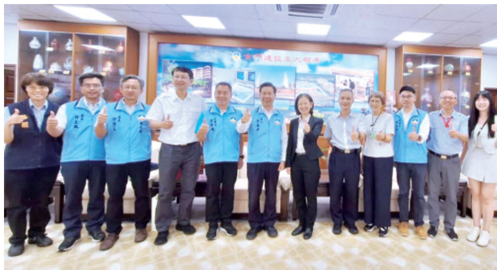
財政部關務署高雄關長劉芳祝(右6)率領團隊拜會金門縣縣長陳福海(左6)。

記者蔡麗玉／金湖報導 財政部關務署高雄關長劉芳祝昨(9)日上午率領主管團隊拜會金門縣政府，雙方就通關服務、人力支援、風險管理、海關執法及兩岸交流等議題進行深入交換意見。會中達成多項共識，包括強化事前宣導、研議地方支援海關勸導人力、改善通關服務品質，以及共同打擊走私與跨境犯罪等工作，展現中央與地方攜手合作、共同提升金門通關效能與安全管理的決心。