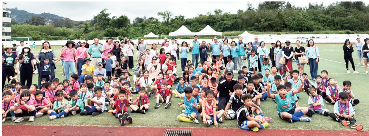
運動i台灣2.0-2026金門縣中小學五人制暨社區親子足球賽閉幕頒獎典禮。

記者呂肇忠／綜合報導 金門縣足球協會承辦的「運動i台灣2.0-2026金門縣中小學五人制暨社區親子足球賽」，於6月6日至7日在金門國小熱鬧登場並圓滿落幕。來自全縣各鄉鎮幼兒園、國小、國中及公開組共35支隊伍參與，兩天賽事累計約2000人次共襄盛舉，選手們在綠茵場上揮灑汗水、展現球技，以熱情與活力共同譜寫金門足球發展的精彩篇章。 賽事閉幕頒獎典禮於7日下午舉行，由金門縣政府副縣長李文良、教育處處長黃雅芬、立法委員陳玉珍服務處主任董志謀、金湖鎮民代表會主席蔡乃靖，以及代表林嘉森、陳秀卿等人共同出席頒獎，向獲獎隊伍及所有參賽選手表達祝賀與肯定。 副縣長李文良表示，體育是教育的重要一環，而足球運動更是一項兼具體能訓練、團隊合作及品格養成的運動。透過賽事舉辦，不僅提供孩子們展現自我的舞台，也讓大家從競技過程中學習互助合作、尊重對手及面對挑戰的精神。他看到許多孩子在場上全力以赴、永不放棄，展現出旺盛的鬥志與運動家精神，令人深受感動，也顯示金門基層足球運動正穩健向下扎根。他感謝各校校長、教練及家長長期支持足球教育，並期盼未來有更多孩子投入足球運動，共同