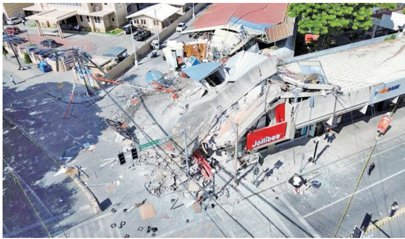
菲律賓民答那峨島7.8強震重創桑托斯將軍城，空拍畫面可見商業建築倒塌、電線桿橫倒街頭，災區滿目瘡痍。

民答那峨島小檔案 民答那峨島(Mindanao)位於菲律賓南部，是菲律賓第二大島，面積約17萬平方公里，人口超過2700萬人，僅次於呂宋島。島上擁有豐富的自然資源，包括香蕉、鳳梨、椰子、橡膠及鮭魚漁業，因此被譽為菲律賓的「糧倉」之一。 民答那峨島主要城市包括達沃市(Davao)、桑托斯將軍城(General Santos City)及卡加延德奧羅等。其中桑托斯將軍城是菲律賓最大的鮭魚