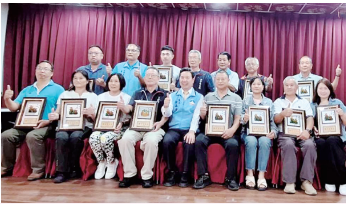
縣長陳福海表揚長期協助縣政推動與服務鄉里的基層民政幹部。

談及金沙未來整體發展方向，陳福海表示，金沙鎮是金門面積最大的鄉鎮，但長期以來建設資源相對不足，因此縣府未來將加大投資力度，加速推動各項重大建設。他指出，金沙體育館將朝高品質、多功能方向規劃建設；金沙幼兒園在副縣長李文良統籌下，預計投入近25億元經費；金沙國中將與幼兒園及國小教育資源整合，