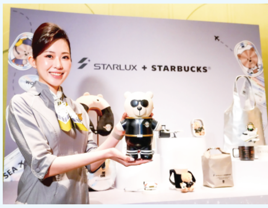
星宇航空11日宣布攜手星巴克推出全新聯名系列商品，Bearista熊也換上星宇制服。(中央社)

【中央社渥太華10日電】加拿大政府今天推出《安全社群媒體法案》(Safe Social Media Act)，大幅收緊兒童及青少年使用網路平台的規範。原則上規定16歲以下青少年禁止擁有社群媒體帳號，並將AI聊天機器人納入監管範圍。 根據加拿大廣播公司(CBC)報導，新法案將監管社群媒體(Facebook)和X等傳統使用者可自行上傳內容的成人網站。除色情網站外，若平台能符合政府訂定的兒童安全標準，經審查後可免資格，有機會讓16歲以下青少年繼續使用服務。 加拿大將成立獨立的「數位安全監管機構」(Digital Safety Commission)，負責制定標準並審核豁免申請。 由於新監管機構預計18個月才能完成設立，在此之前，受規範的平台很可能先面臨16歲以下用戶禁令，無法立即申請豁免。 根據法案內容，不遵守規定的平台將面臨嚴厲處罰，最高為全球營收的3%或1000萬加元(約新台幣2.2億元)，以較高者為準。對大型科技企業而言，這可能代表數億甚至數十億美元的潛在罰款。 除了社群媒體外，法案也將AI聊天機器人納入規範。 雖然AI聊天機器人不受16歲年齡限制約束，但諸如ChatGPT、其他對話式人工智慧服務和AI虛擬助理平台等企業，都需承擔新的法律責任。AI服務業者必須設立危機機