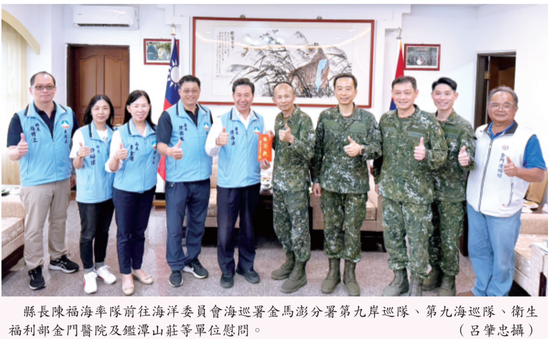
縣長陳福海率隊前往海洋委員會海巡署金門澎分署第九岸巡隊、第九海巡隊、衛生福利部金門醫院及鑑潭山莊等單位慰問。