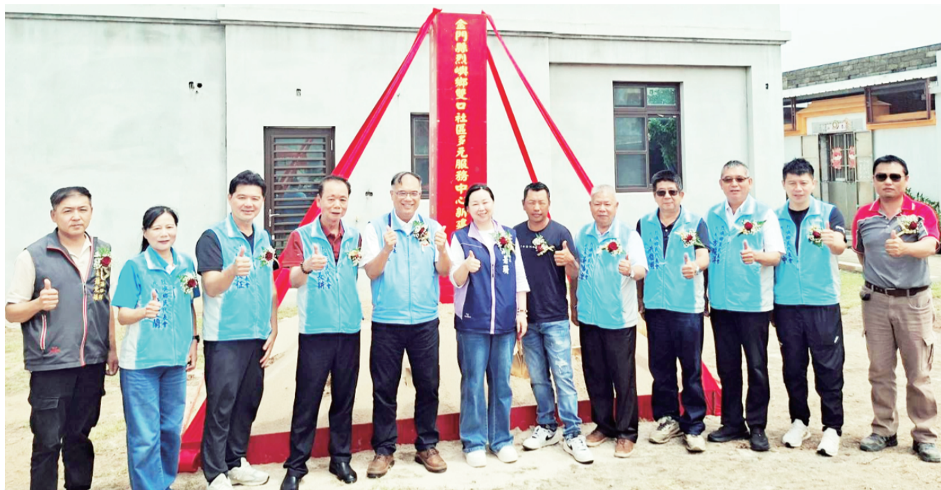
烈嶼鄉雙口社區多元服務中心新建工程舉行動土典禮，與會貴賓於典禮中合照。