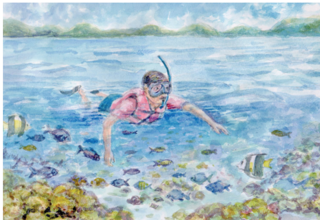
帛琉浮潛。(陳鴻文繪)

中午停泊無人島，一行人將食材搬至木造大涼亭下，有的烤肉、有的炒菜，不多時便炊香撲鼻、大快朵頤。餐後漫步島上，見蔥蘢林木或斜倒生枝、或交纏互生，盤錯的樹根突出岸邊，炭黑的漂流木散落灘頭，千奇百怪，渾然天成。走在細碎珊瑚遍布的沙灘，遙望浩瀚海面，點綴著大小小長滿綠髮的島嶼，海風拂面，浪濤濯足，好似置身異境，