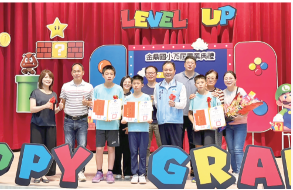
金鼎國小績優畢業生與來賓合影。