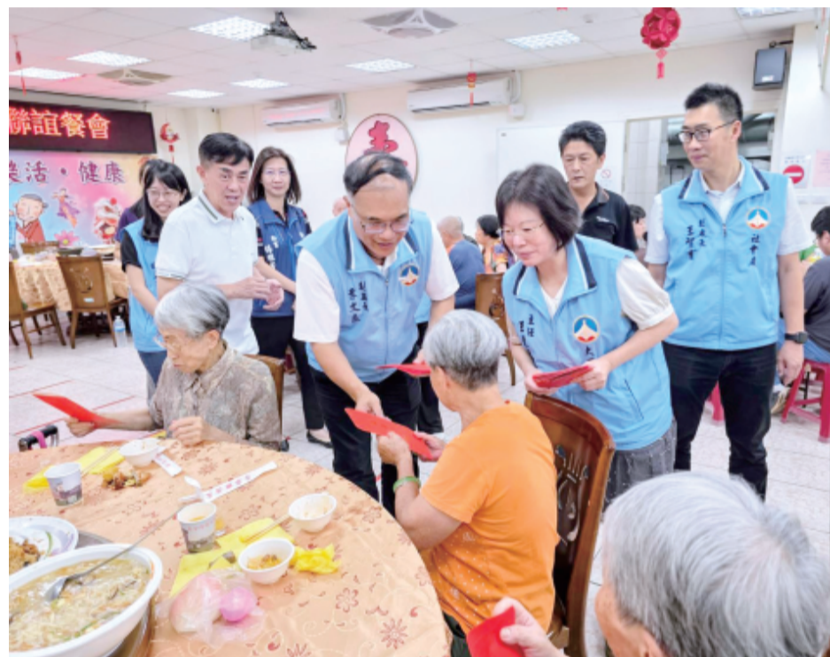
大同之家辦端午節聯誼，副縣長到場致意。

記者許峻魁／金城報導 金門縣大同之家在端午節前舉行「一五年端午節聯誼餐會」，副縣長李文良代表縣長陳福海到場向院內的每一位長輩賀節，並且發給端午節聯誼金。 李文良表示，縣府對於長輩們樂於安居相當重視，也積極致力於照顧好每一位老人家，他祝福大家端午節快樂、平安健康呷百二。 李文良由金門縣政府社會處處長王智育等人陪同賀節，受到大同之家主任王麗娟與多位長輩歡迎。此外，董燕輝、盧根陣等多位大同之家前任主任也來與老人們敘舊。 李文良表示，地區的長輩們，幾乎都會經歷過戰火的洗禮，在他們年輕時候的生活也是過得相當辛苦，而每一位長輩們在年輕的時候，不只是为了家庭，也為了金門社會的發展貢獻良多，付出青春，因此縣府對於老人福利與照顧都相當重視，他也肯定大同之家主任王麗娟的用心與努力，與同仁一起為長輩提供優質的服務。 餐敘在進行至中途之後，副縣長李文良隨即起身，與副處長王智育、主任王麗娟等人逐桌向長輩們致意，一句句「佳節愉快」掛在嘴上，並致贈每位長者各份端午節慰問金，祝福大家平安健康。