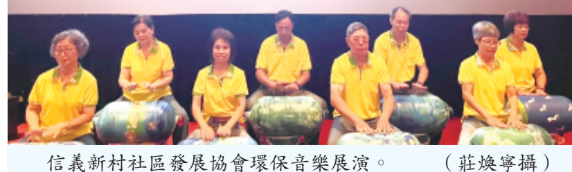
信義新村社區發展協會環保音樂展演。