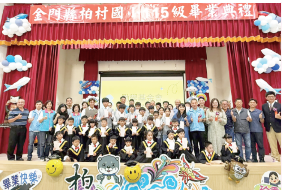
柏村國小115級畢業典禮日前登場。