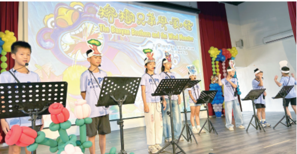
何浦國小英語讀者劇場帶來精湛演出，獲得好評。