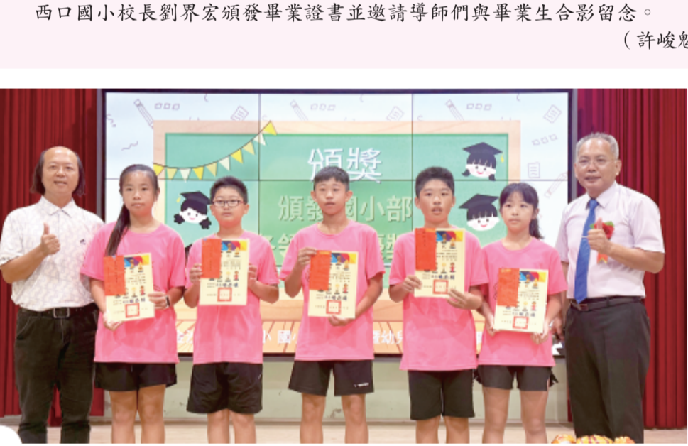
述美國小頒發畢業生獎項。