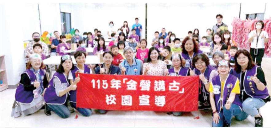
為深化廉潔誠信教育向下扎根，金門縣政府政風處持續推動「金聲講古」廉潔繪本校園巡迴宣導活動。

記者陳冠霖/縣府報導 為深化廉潔誠信教育向下扎根，金門縣政府政風處持續推動「金聲講古」廉潔繪本校園巡迴宣導活動，透過生動活潑的故事劇場及互動式學習方式，將誠信、廉潔與公平正義等核心價值融入校園教育，讓學童從小建立正確品格觀念，培養誠實守信與遵守法治的良好態度。 政風處表示，廉潔教育不應僅停留於課堂知識傳授，更應融入日常生活與品格教育之中。透過繪本校園故事、戲劇表演及母語文化元素，能有效拉近學童與廉潔議題之間的距離，讓誠信價值自然融入成長過程。尤其以金門在地閩南語進行演出，不僅有助於母語傳承，也讓廉潔教育更具地方特色與文化溫度。 此外，廉潔志工長期投入各項宣導工作，透過深入校園、社區及各類活動場域，持續推廣誠信與反貪觀念。此次參與演出的志均均經過充分準備與排練，希望透過貼近兒童的表演形式，讓廉潔種子在孩子心中萌芽，進一步培養未來公民應具備的責任感與正義感。 政風處指出，推動廉潔教育是一項長期且持續的工作，期盼透過校園巡迴宣導，將誠信、守法與公平正義等價值觀深植於學童心中，並藉由孩子將所學帶回家與社區，形成正向影響力。未來也將持續結合在地文化特色與創新宣導方式，深化校園廉潔教育內涵，讓誠信精神在生活中落實扎根，共同營造廉潔、誠信與友善的社會環境。