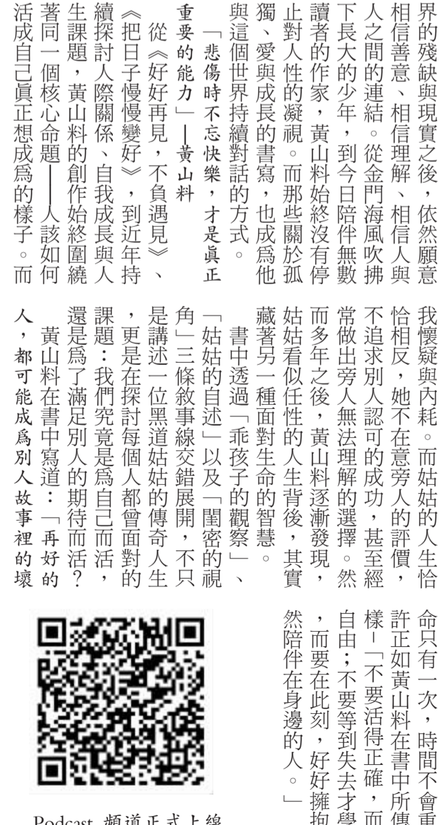
「擁有過就好」與「好好生活 慢慢相遇」。