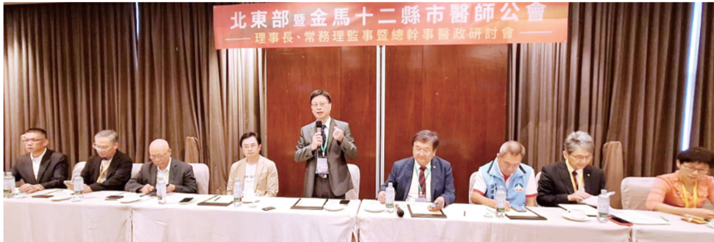
由金門縣醫師公會主辦的「北東金馬12縣市醫師公會理事長、常務理事暨總幹事醫政研討會」昨在金湖鎮恆昌金湖大飯店二樓會議廳盛大舉行。

由金門縣醫師公會主辦的「北東金馬12縣市醫師公會理事長、常務理事暨總幹事醫政研討會」，昨（14）日在金湖鎮恆昌金湖大飯店二樓會議廳盛大舉行。來自台北市、新北市、基隆市、桃園市、新竹市、新竹縣、苗栗縣、宜蘭縣、花蓮縣、台東縣、連江縣及金門縣等12縣市醫師公會代表齊聚一堂，針對離島醫療發展、全民健保給付制度改革、醫師執業環境優化、醫事人力培育與留任，以及台灣醫師公會國際參與等重要議題深入交換意見。