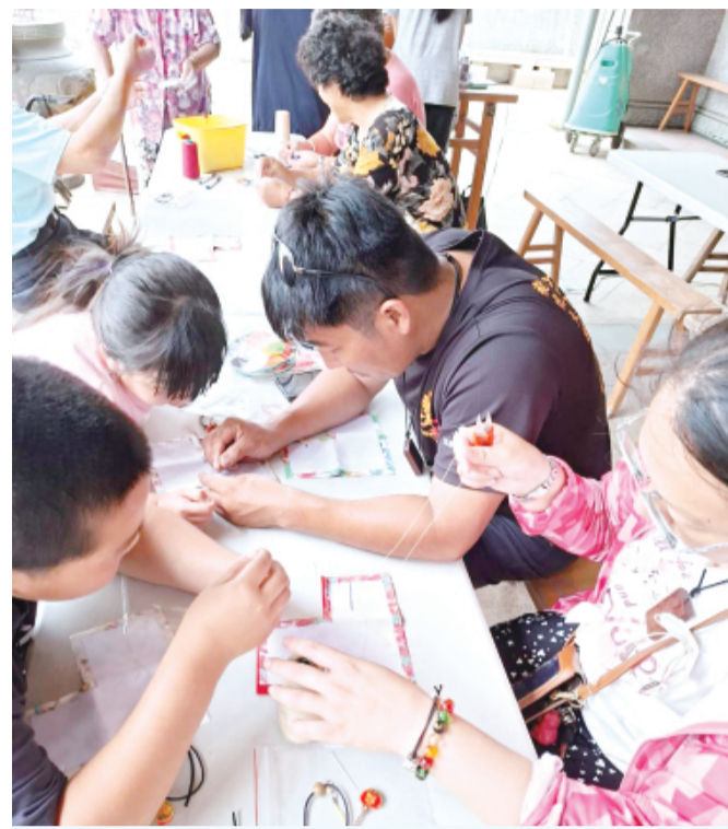
親子手作「粽型零錢包」。

記者高凡淳／金寧報導 迎接端午節，金寧鄉湖南社區發展協會規劃一系列兼具文化傳承與親子互動的端午節主題活動，從學包粽到手作香包、大手牽小手，讓民俗技藝在歡樂中體驗，也讓社區居民提前感受端午節慶的氛圍。 端午系列活動由兼具實用與應景的「粽型零錢包」手作DIY打頭陣，吸引許多長者與家長帶領小朋友前往廟口共襄盛舉，活動現場可看到一幅幅親子一同穿針引線、黏貼裝飾的溫馨畫面。當一個個小巧可愛的粽型零錢包在小小朋友手中誕生時，孩子們都興奮地向大家展示，湖南廟口充滿溫馨的歡笑聲。 第二場是專為小朋友規劃的「豆沙粽手作體驗」，作為接下來