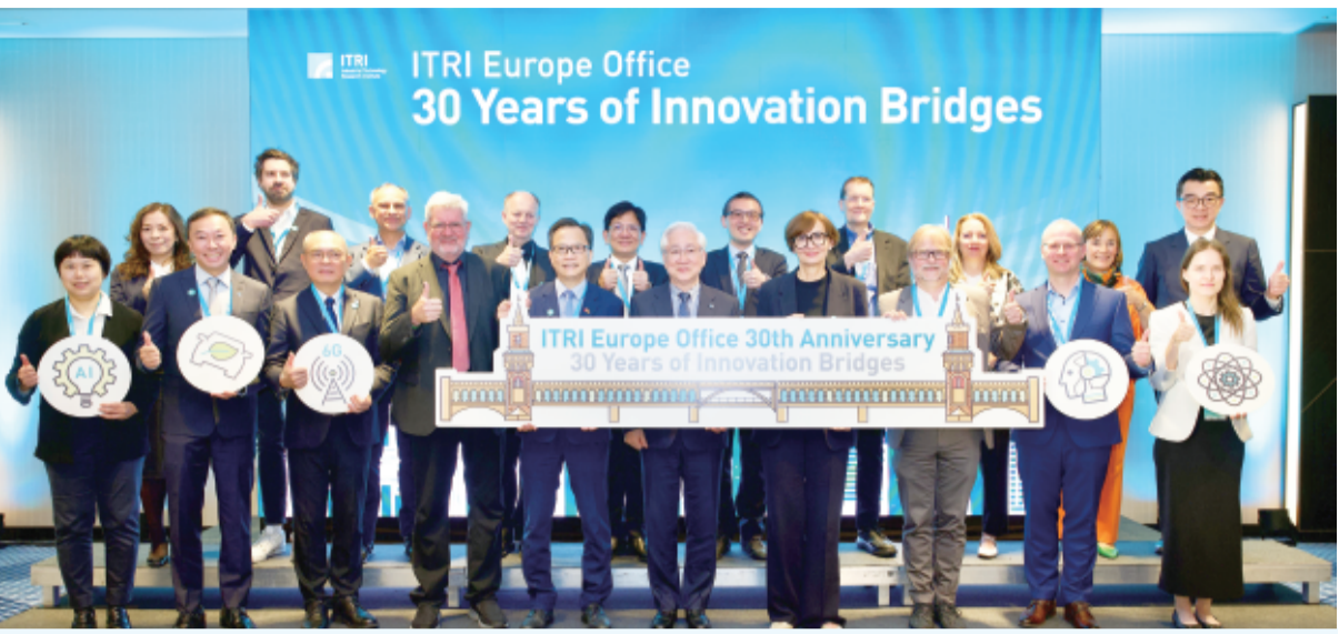
工研院12日在柏林舉辦歐洲辦公室30週年慶祝活動暨科技論壇，台德產官學界代表共同出席。(中央社)

【中央社柏林13日電】工研院慶祝德國辦公室成立30週年，並與德國最大應用研究機構佛羅恩霍夫協會簽署合作備忘錄。從30年前赴德取經機械與自動化技術，到如今攜手投入AI與新世代電池研發，台德研創合作已從技術交流走向共同創新，攜手迎接一波科技浪潮。 工研院12日在柏林舉辦「工研院歐洲辦公室30週年慶祝暨科技論壇」，並於會中與佛羅恩霍夫協會簽署合作備忘錄。出席者包括工研院董事長吳政忠、駐德代表谷瑞生、德國前聯邦教育與研究部長瓦特辛格(Berthold Weizsäcker)等120多位產官學代表。