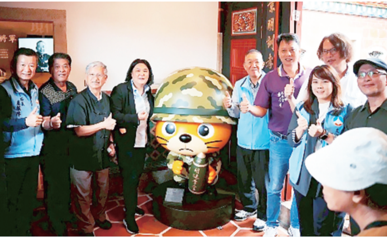
守護塔后的水瀨——砲彈大金公共藝術揭示。