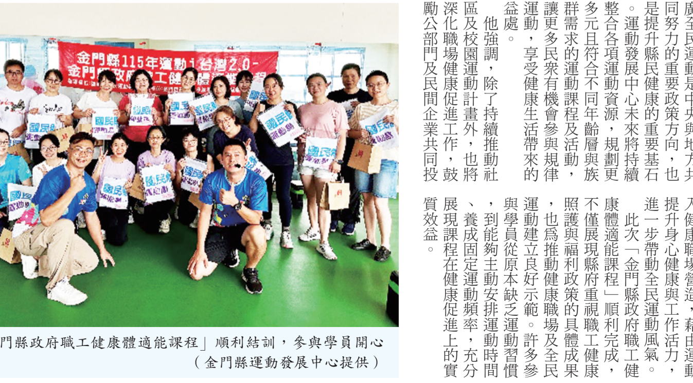
「金門縣政府職工健康體適能課程」順利結訓，參與學員開心合照。(金門縣運動發展中心提供)

記者莊煥寧／綜合報導 為響應運動部全民運動「運動·臺灣2.0計畫」，落實健康促進與職場照顧理念，金門縣政府發展中心於今年3月至6月期間辦理「金門縣政府職工健康體適能課程」，歷經12週、24堂課的系統化訓練後，日前順利結訓。 參與職工普遍在體能、肌耐力及運動習慣養成方面獲得顯著提升，不僅為公務部門健康促進樹立良好典範，也為打造健康、活力的職場環境奠定基礎。 本項課程由金門縣政府主辦、運動部全民運動署指導，並由金門縣運動發展中心承辦，期望透過運動介入職場，提升公務人員身心健康與工作效能。課程自開辦以來獲得縣府同仁熱烈響應，許多學員即使工作繁忙，仍積極利用下班時間參與訓練，展現對健康管理的重視與支持。 運動發展中心表示，本項課程規劃兼顧安全性、實用性與訓練成效，每週安排兩次課程，每次90分鐘，由具備國民體適能教練指導員資格的專業教練授課，依照學員身體狀況與運動能力進行調整，讓不同年齡與體能程度的參與者都能循序漸進投入訓練。 課程內容涵蓋動態暖身、關節活動訓練、有氧運動、上下肢肌力與肌耐力訓練，以及核心肌群強化等項目，並搭配課後伸展與放鬆運動，協助學員提升心肺功能、肌肉力量與度，同時降低運動傷害風險。透過多元化課程設計，讓學員在專導員的學習氛圍中享受運動樂趣，也逐步培養自主運動能力。 金門縣運動發展中心主任王志仁表示，現代公務人員工作型態多以久坐辦公為主，長時間缺乏活動容易造成體重增加、肌力不足、肩頸痠痛及慢性疾病等健康問題。因此，中心特別規劃職工健康體適能課程，希望藉由規律且持續的運動訓練，引導同仁建立正確運動觀念與健康生活方式。 王志仁指出，健康是個人幸福與工作效能的重要基礎，當職工擁有良好的體能與健康狀態，不僅有助於提升工作效能，也能增進生活品質與身心平衡。透過本項課程推動，同仁彼此相互鼓勵、共同運動，逐步形成正向健康的職場文化，讓運動成為日常生活的一部分。 王志仁進一步表示，推廣全民運動是中央與地方共同努力的重要政策方向，也是提升縣民健康的重要基石。運動發展中心未來將持續整合各項運動資源，規劃更多元且符合不同年齡層與族群需求的運動課程及活動，讓更多民眾有機會參與與規律運動，享受健康生活帶來的益處。 他強調，除了持續推動社區及校園運動計畫外，也將深化職場健康促進工作，鼓勵公務部門及民間企業共同投入健康職場營造，藉由運動提升身心健康與工作活力，進一步帶動全民運動風氣。此次「金門縣政府職工健康體適能課程」順利完成，不僅展現縣府重視職工健康，也為推動健康職場及全民運動建立良好示範。許多參與學員從原本缺乏運動習慣，到能夠主動安排運動時間，養成固定運動頻率，充分展現課程在健康促進上的實質效益。