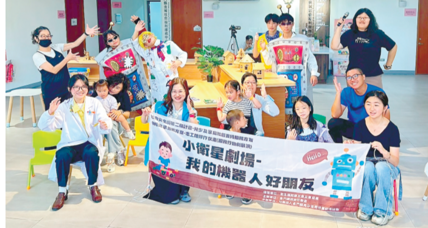
《我的機器人好朋友》獲得家長、教師及孩子們的高度肯定。

記者李薇薇／綜合報導 為增進兒童、青少年及其家庭對社會福利資源的認識，並提升兒少生活自理能力與家庭互動品質，金門縣青少年暨兒童關懷協會攜手呼鳥劇團，推出親子互動劇場《我的機器人好朋友》巡迴演出。日前分別前往西口國小、中正國小、安瀾國小、金城綜合社會福利館及金門縣兒童及少年福利服務中心等地演出，共吸引約50名師生、家長及社區居民熱情參與。活動透過寓教於樂的戲劇展演與互動體驗，讓民眾在歡笑與感動中認識兒少福利服務的支持服務，獲得各界一致好評。 此次巡迴以《我的機器人好朋友》為主題，劇中透過貼近生活的情節與生動活潑的角色互動，傳達親子溝通、誠實品格、正向思考及家庭支持的重要性，讓觀眾在欣賞戲劇的同時，進而反思家庭陪伴與情感交流的外化，活動除了精彩的戲劇演出外，現場亦安排多項互動體驗關卡，包括摺疊衣物、垃圾分類及居家