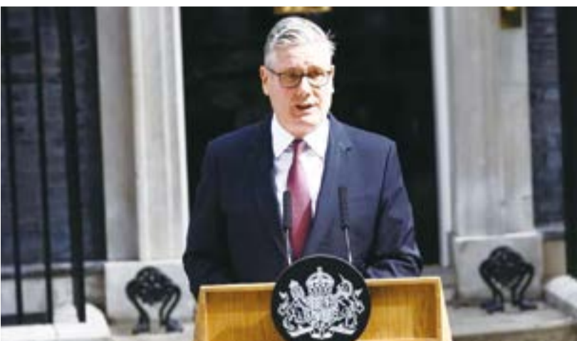
英國首相施凱爾宣布請辭執政黨工黨黨魁。

【中央社記者陳韻華倫敦22日電】英國首相施凱爾(Boris Johnson)今天上午在唐寧街宣布請辭執政黨工黨黨魁一職。新黨魁的選舉將自7月9日起接受候選人提名，最晚在8月底確認新黨魁；在此之前，施凱爾將擔任看守首相。 在英國的內閣制體制下，首相原則上就是執政黨黨魁，執政黨選出的新黨魁就是英國新首相。 新選出的工黨黨魁將是英國自2016年舉行脫歐(Brexit)公投以來，近10年來的第7位首相。 施凱爾今天在唐寧街對全國民眾發表談話時，面色凝重、略顯蒼白，近結尾提到家人支持時，更明顯語帶哽咽。 他說，工黨現在面臨的關鍵問題是，他不是領導工黨迎戰一場國會大選的最佳人選。針對這個問題，黨籍國會議員已給了他答案，他欣然接受。 施凱爾強調，他作任何決定的出發點都是「將他熱愛的國家擺第一」，因此他將請辭工黨黨魁。今天稍早，施凱爾已告知國王查爾斯三世(King Charles III)請辭相關決定。 至於新任黨魁如何產出，施凱爾表示，他將請工黨的全國執行委員會(NEC)訂定黨魁選舉時間表，預定7月9日開始接受候選人提名，整個程序有必要在英國國會夏季休會結束前完成。 施凱爾說，這樣的程序規劃將確保國會9月恢復會期時，工黨新黨魁已就位。在此之前，施凱爾將繼續擔任首相，直到黨魁選舉完成。 施凱爾強調，他將竭盡所能確保黨魁和首相權責有序交接，並將對他的繼任者給予毫無保留、毫不含糊的支持。 這意味施凱爾不會參加黨魁競選，雖然在今天之前，他曾數次公開表示將「奮戰到底」、「不會一走了之」，並向親近人士透露他有信心在黨魁選舉勝出。 然而，英國各家媒體報導，近日有越來越多黨籍官員和國會議員告訴施凱爾，「時間到了」。黨內各方願意給他一些時間，讓他在尊嚴地卸職職務，但據了解，若施凱爾至明日上午每週二例內閣會議舉行前仍堅持不下台，原本即有官員醞釀在會議期間當面逼宮，或以多位高階官員陸續請辭的方式，逼施凱爾認清他的領導已無以為繼的現實。 英國國會預定7月16日休會，並於9月1日恢復會期。一旦工黨黨魁選舉程序，且只有一人參選，沒有其他人挑戰黨魁地位，則該唯一候選人將自動成為黨魁，並可望在國會7月16日休會之前就任。 若同時有數人競選黨魁，則整個程序預計將持續數週。按施凱爾所述，黨魁選舉應以最後在8月底結束為規劃目標，以利銜接各選區議員9月返回國會。 在英國的內閣制體制下，擔任黨魁(首相)的前提是取得國會議員身分。 目前最有可能競選工黨黨魁的是前大曼徹斯特地區(Greater Manchester)市長柏南(Andy Burnham)，以及5月中旬請辭的前衛生大臣、國會議員斯特里廷(Wes Streeting)。 柏南在英格蘭西北部選區梅克菲爾德(Makefield)18日舉行的英國國會議員補選勝出，成功重返國會，今天下午將前往國會報到。他是最被看好當選黨魁的可能候選人。 除了啓動黨魁選舉，另一個可能的發展是工黨內部達成共識，讓斯特里廷及其他原本有意競選黨魁的國會議員放棄挑戰，並由他們將在柏南領導的內閣擔任要職為交換條件，促成工黨儘快在7月中旬確認新黨魁，為執政黨做準備。 不過，也有工黨籍國會議員認為，急於讓新黨魁就位、新黨魁因此未經過完整的選舉競爭和政策辯論考驗，這恐讓柏南政府的執政正當性和號召力更顯薄弱，工黨恐怕也未能提早偵測到並拯救柏南本人及其團隊的弱點。