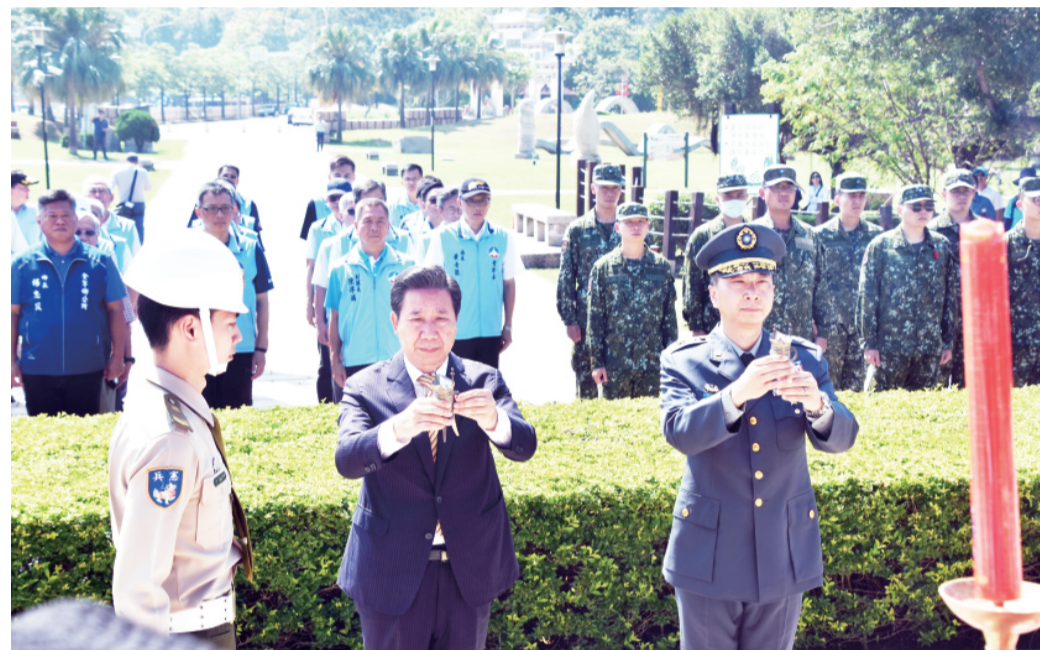
適逢胡璉將軍逝世49週年，金門縣政府於金城鎮石碼公園伯玉亭前廣場舉辦追思祭典。

記者莊煥寧／金城報導 適逢金門「現代恩主公」胡璉將軍逝世49週年，金門縣政府昨(22)日上午9時30分於金城鎮石碼公園伯玉亭前廣場舉辦追思祭典，由縣長陳福海與金門防衛指揮部副指揮官李其桓擔任主祭官，率領縣府團隊、駐軍代表及地方各界人士齊聚胡璉紀念碑前上香、獻花並進行三