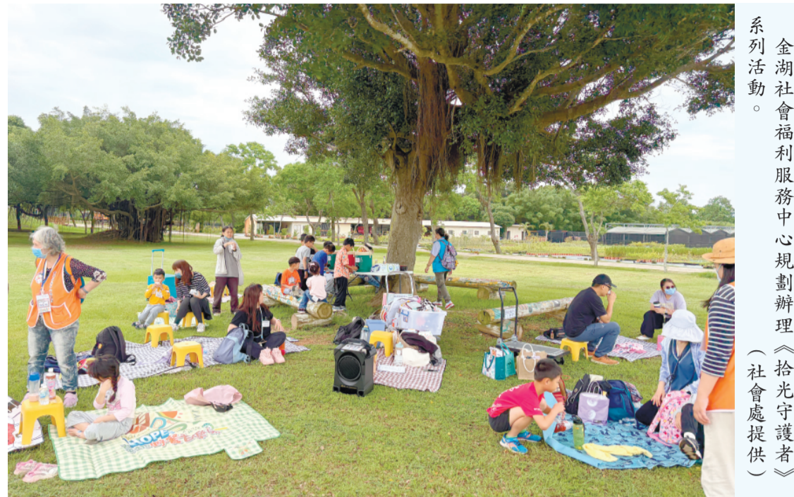
金湖社福中心規劃辦理《拾光守護者》系列活動。

記者陳冠霖／縣府報導 為響應環境永續、海洋保育及家庭關係等重要議題，金湖社福中心與中心規劃辦理《拾光守護者》系列活動，以「體驗、學習、實踐」為核心主軸，結合館內學習與戶外探索，共推出多場親子及兒童主題活動。透過寓教於樂的方式，引導家庭共同關注環境保護、海洋保育與家庭互動等議題，培養兒童環境意識與正向互動能力，並透過親子共同參與，建立溫暖